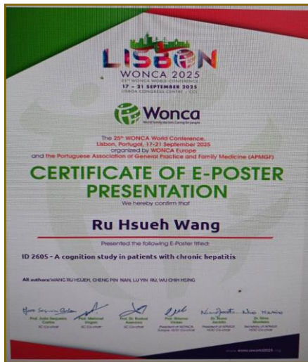
電子海報論文發表證書