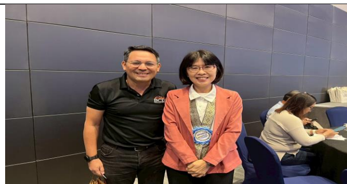
與 BCDA 副總裁合影