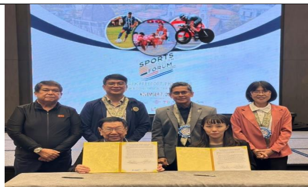
見證中小企總與 PSTA 簽署 MOU