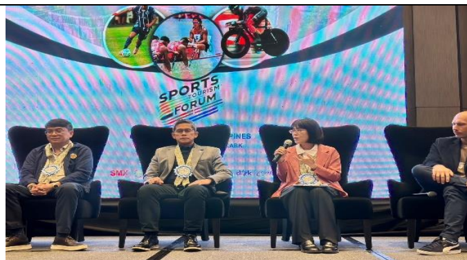
與 PSC 副主委等貴賓同場座談