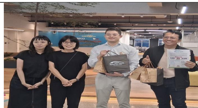
與 MIC 创新中心總監合影