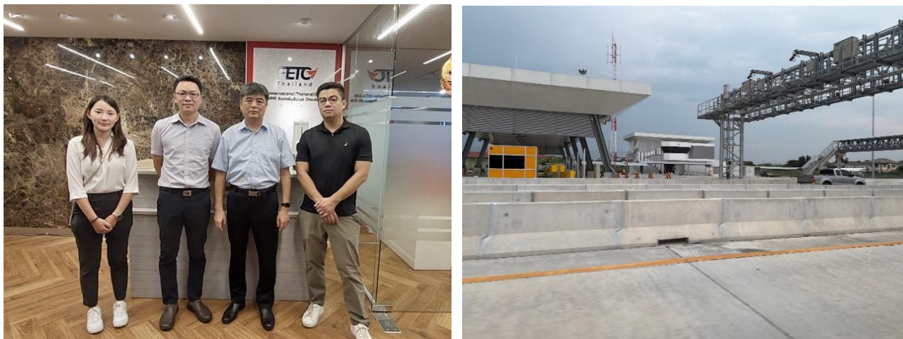
圖 1（左）及圖 2（右）於遠通公司泰國稽核及訪視情形