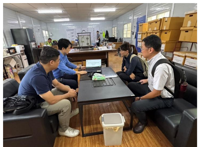
圖 3（左）及圖 4（右）於林同棧公司稽核及訪視情形