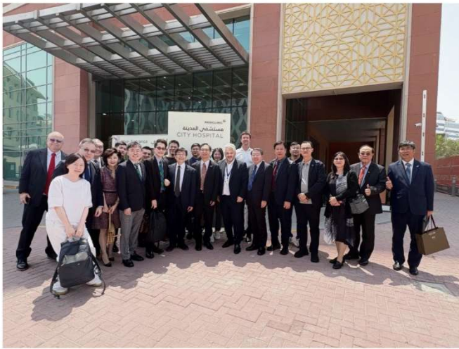
生策會商貿團拜會Mediclinic City Hospital 該院2025 年榮登 Newsweek 全球百大智慧醫院榜單