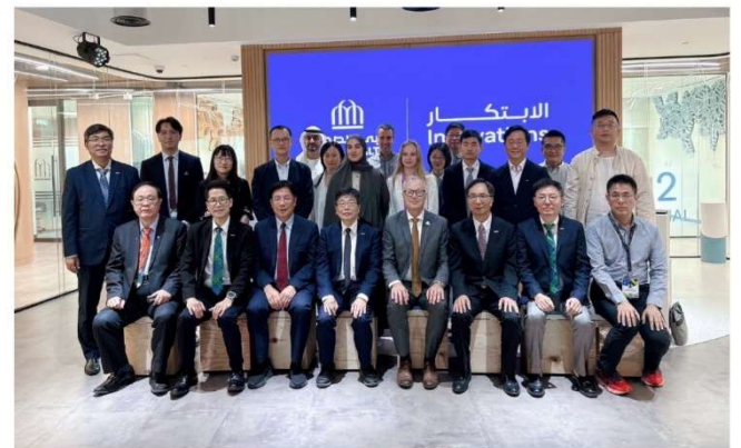
Dubai Health集團提供完整的醫學、護理、牙醫教育，並設有41個住院醫師及專科訓練計畫。主導完成阿聯人群基因組資料，為未來精準醫療與臨床應用提供基礎