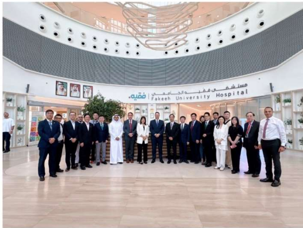
造訪Fakheh University Hospital，該院目前專注醫療創新，包括腫瘤治療、CAR-T 療法、基因編輯（CRISPR）、基因組學、Digital Twin、AI 診斷與可穿戴裝置整合，推動精準醫療。