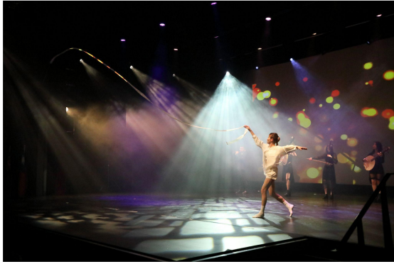
▲ 彩帶炫技令觀眾驚呼連連