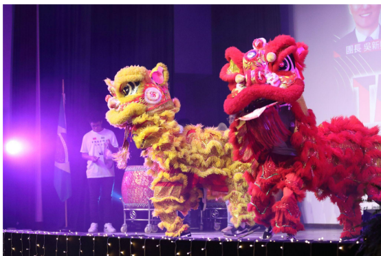
▲ 舞獅及三太子為節目開場