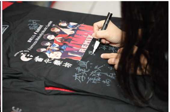
▲ 僑胞自製主題 T 恤，邀請團員簽名留念