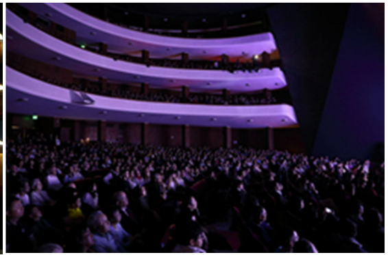
▲ 三層觀眾席全數坐滿