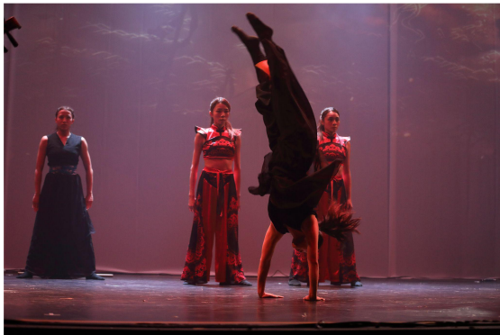
▲ 舞者展現高超技巧