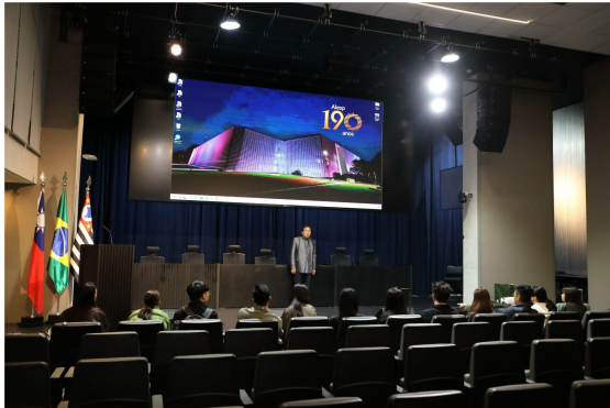
▲ 前往聖保羅州議會彩排