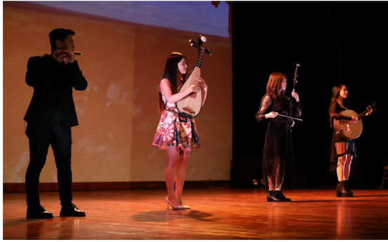
▲ 《中南美洲組曲》演奏貝里斯民謠，引爆全場歡呼聲