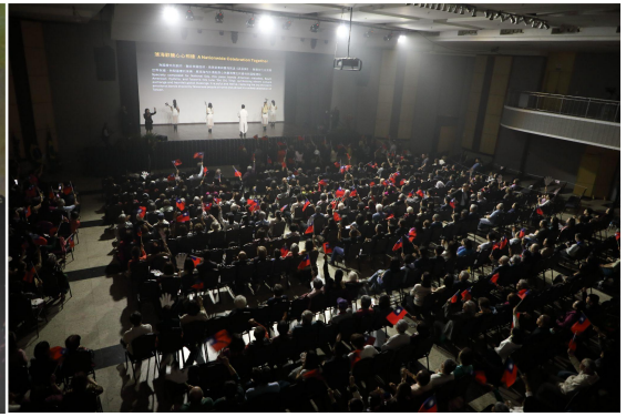
▲ 觀眾齊揮國旗賀國慶