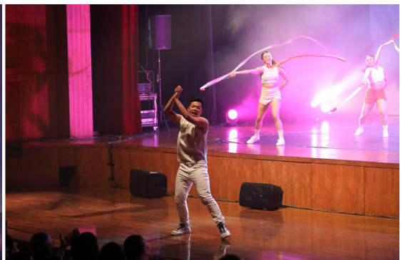
▲ 團員至臺下帶動氣氛，全場沸騰