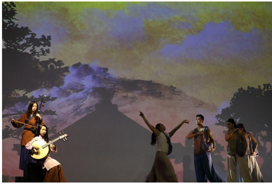
▲ 《篳路藍縷》引發僑胞共鳴