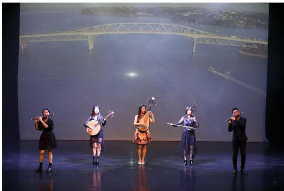
▲ 《大洋洲風華組曲》演奏紐澳民謠 吸引觀眾隨之拍手哼唱