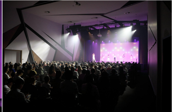
▲ 現場掌聲雷動，熱鬧非凡