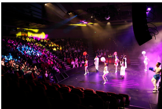
▲ 現場氣氛熱絡，掌聲不斷