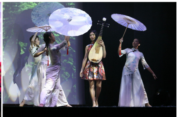
▲ 《戀戀桐花》深獲鄉親好評