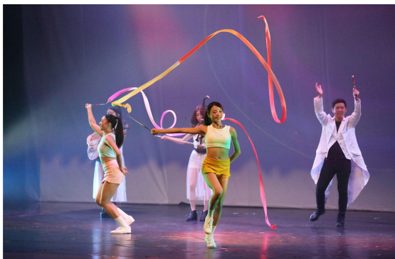
▲ 《薄海歡騰心心相連》與僑胞共享國慶喜悅