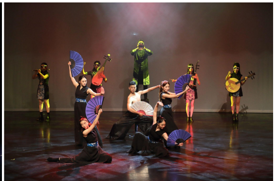
▲ 《將軍令》精彩舞碼博得滿堂彩