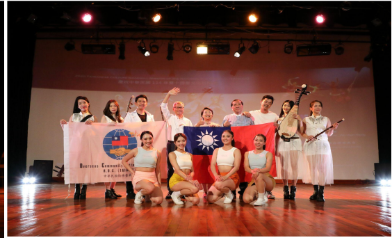
▲ 圓滿完成終站貝里斯演出，巡演圓滿成功