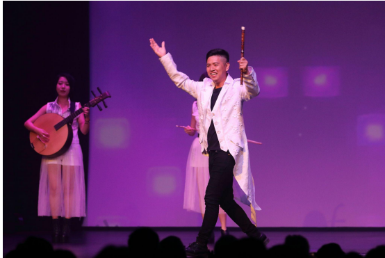
▲ 團員帶動觀眾氣氛