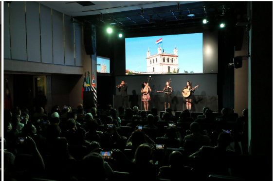
▲ 聖保羅州議會文化交流圓滿完成