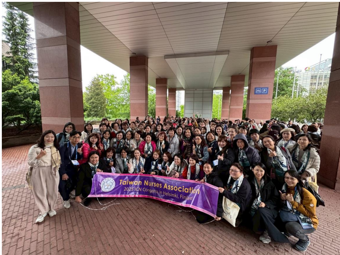
TWNA 會員在芬蘭赫爾辛基 Messukeskus 會展中心外合影(2025.6.9)

參與 ICN Congress 2025 主要目的為藉由與來自世界各地的護理學者、臨床專家互動交流，了解全球護理趨勢，進一步思考自身研究在國際上的應用與連結機會，以深化學術交流與拓展國際視野；透過海報發表方式分享綜合性文獻回顧，分析探討兒科急診病人及其家庭經驗的質性研究結果，促進知識輸出；另外透過與各國及國內其他機構護理人員的互動與經驗學習，重新思考自身在護理專業中的角色與責任，提升職涯規劃的宏觀視野。