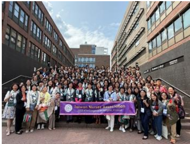
台灣護理學會合影