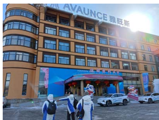
亞布力選手村主村-雅旺斯酒店