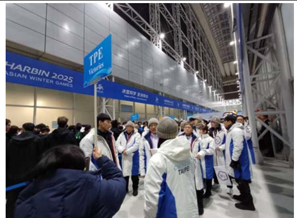
開幕式我代表團進場中