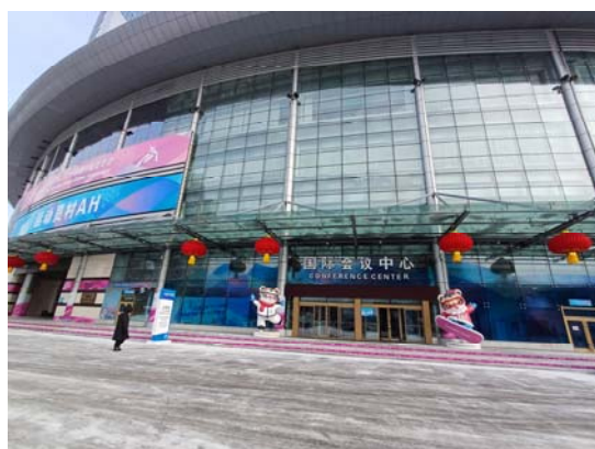
哈爾濱選手村主村-華旗飯店

本屆亞冬運賽事分為冰上項目及雪上項目兩類，賽場分別哈爾濱市區（4 個競賽場館）及亞布力（8 個競賽場館），為便利就近參賽，選手村依照競賽項目，冰上項目設置於哈爾濱之華旗飯店（主村）及北大荒國際酒店（分村）；雪上項目設於亞布力之雅旺斯酒店（主村）、亞布力山莊（分村）及滑雪者之家酒店（分村）。選手村飯店內，管制嚴格，進入選手村須經嚴密安檢。