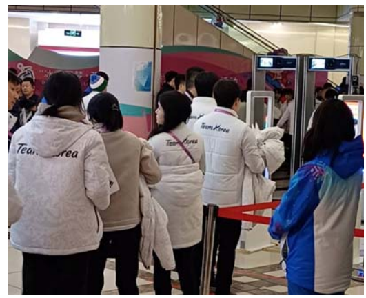
於華旗飯店進行安檢