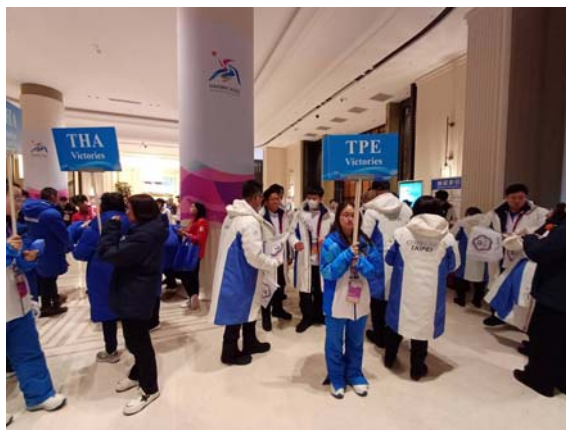
華旗飯店大廳集合準備出發