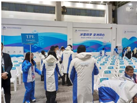
志工引導我代表團參加開幕式