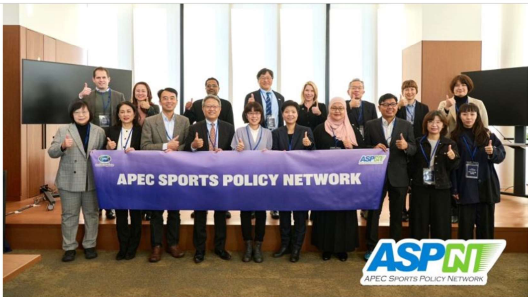
Participating officials from member economies give the thumbs-up at the 2025 APEC Sports Policy Network meeting organized by Taiwan's Ministry of Education Feb. 6 in Yokohama, Japan.

The 2025 Asia-Pacific Economic Cooperation Sports Policy Network Roundtable Meeting and Forum took place Feb. 6-7 in Yokohama, Japan, with representatives from participating economies sharing experience of global sports trend and discussing the application of sports technology innovation in major sports events.