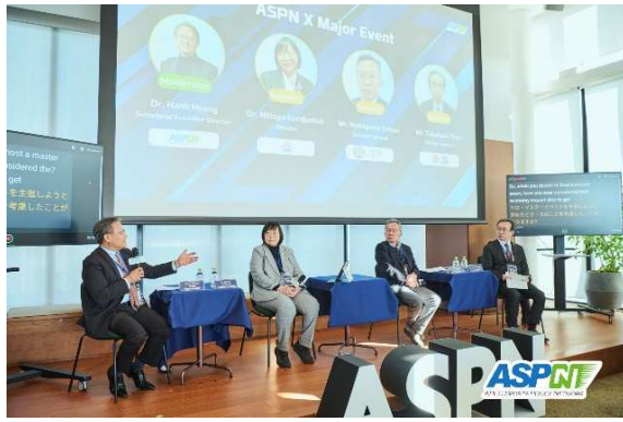
座談會交流分享情形