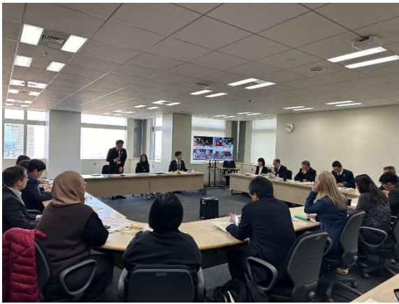
拜會東京都廳生活文化體育局