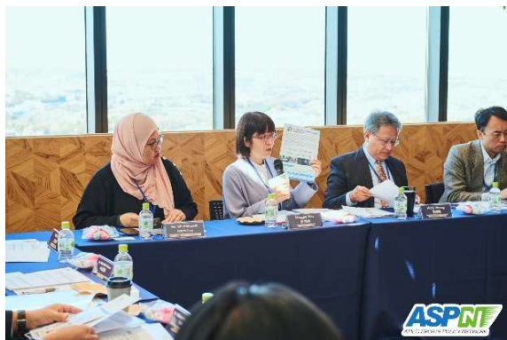
許組長分享臺灣品牌國際賽研習營