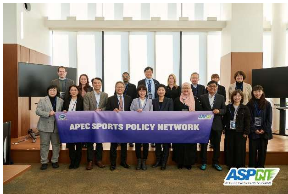
ASPNT 圓桌會議各成員合影