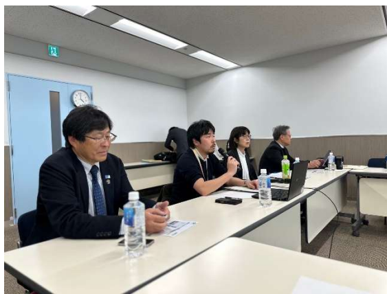
2025東京聽障奧運組委會分享賽事背景