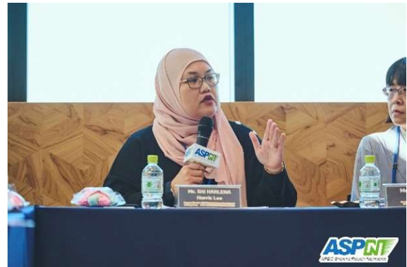
APEC HRD WG 計畫主任代表致詞