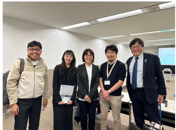
與2025東京聽障奧運組委會合影