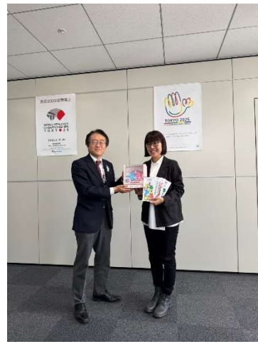
許組長致贈2025雙北世壯運吉祥物予副局長