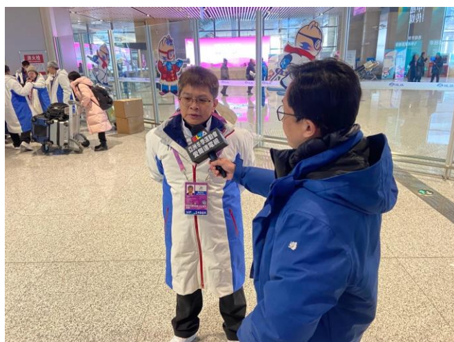
圖 8：房副署長於哈爾濱太平機場接受我國媒體採訪