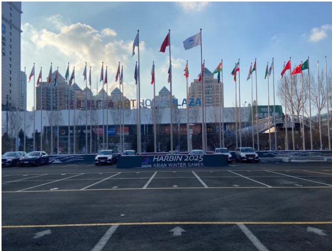
圖 21：選手村(華旗飯店)陳列參賽之各國奧會會旗情形