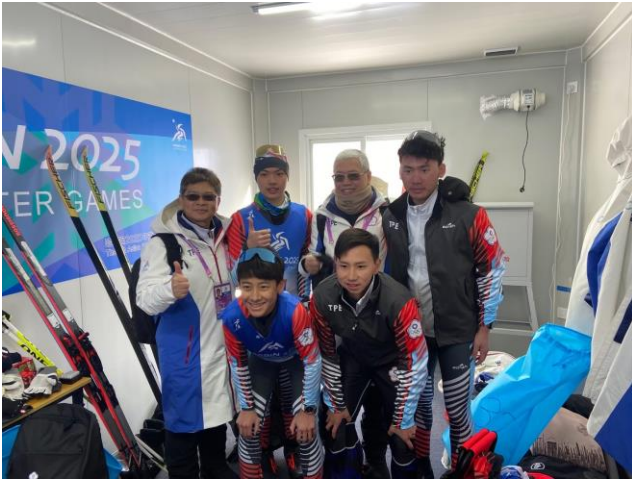
圖 1：房副署長探視滑雪及冬季兩項選手備戰情形