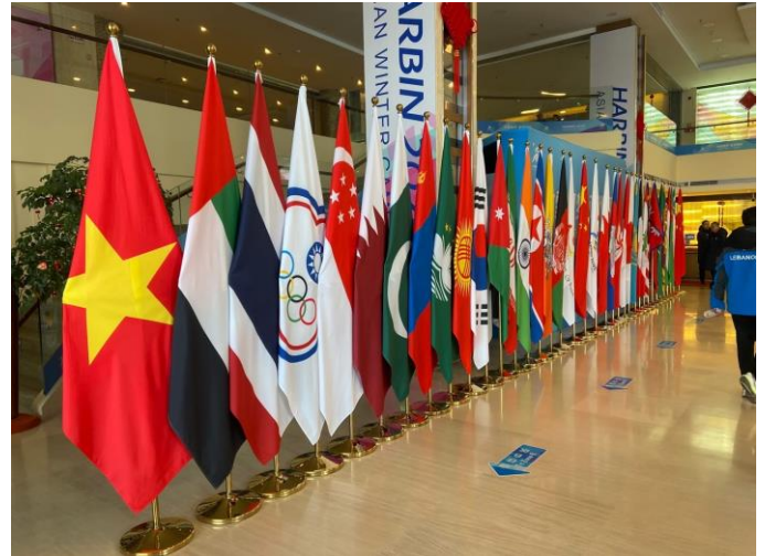
圖 22：選手村(亞布力雅旺斯飯店)陳列參賽之各國奧會會旗情形