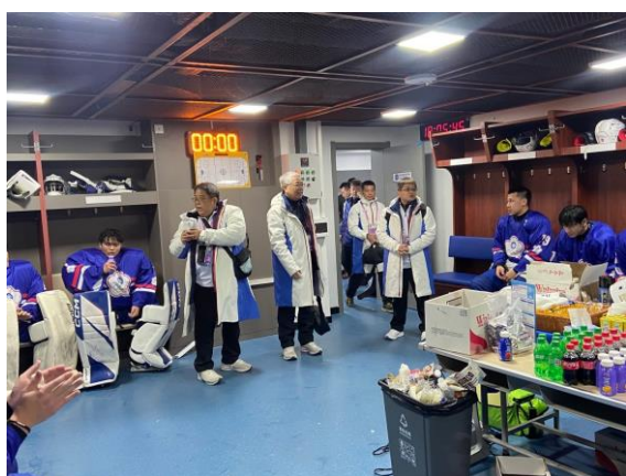
圖 5：房副署長至男子冰球休息室為教練、選手打氣加油