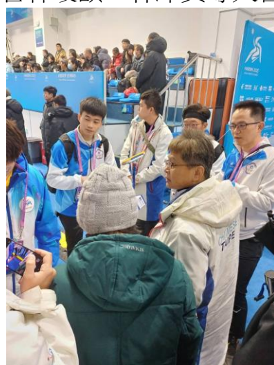
圖 6：房副署長至冰石壺賽場為選手加油