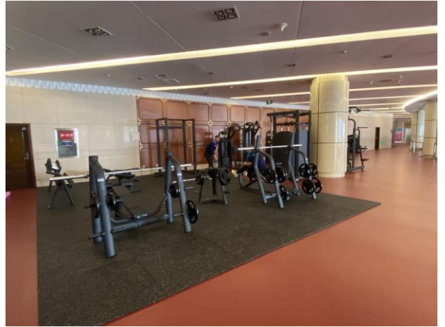
圖 16：選手村健身器材配置情形