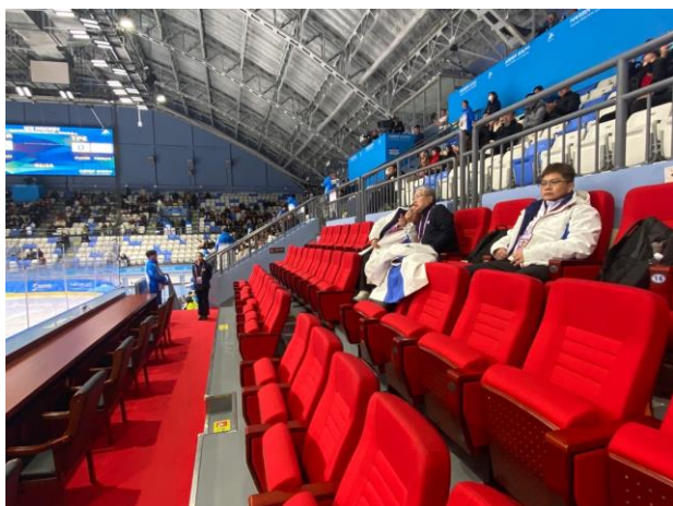
圖 3：我國男子冰球隊出賽，房副署長與陳士魁總領隊至現場觀賽