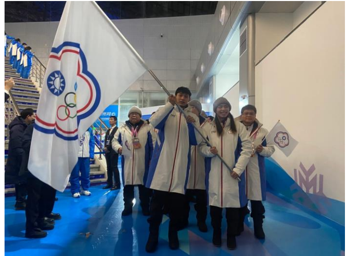
圖 10：房副署長與掌旗官，於後台等候開幕式進場(我國排第 27 序位國家)