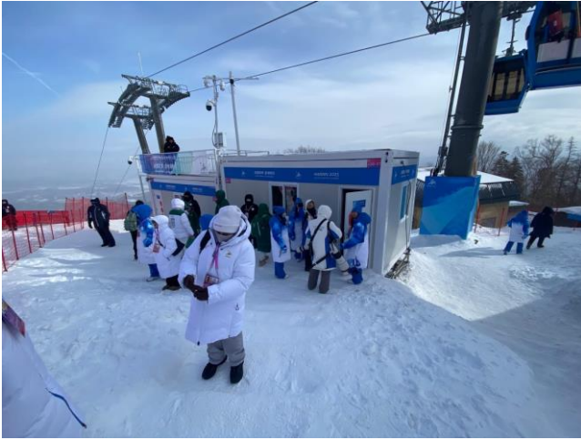
圖 9：房副署長至滑雪賽場觀賽