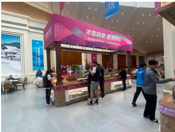
圖 17：我國選手於選手村餐廳用餐情形