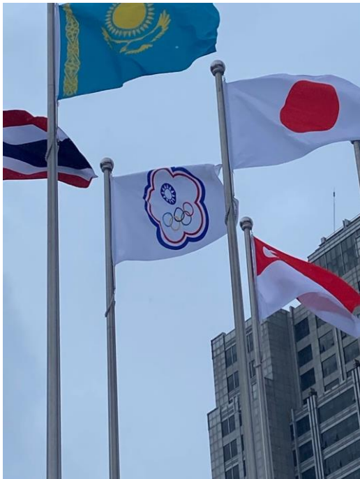
圖 23：我國奧會會旗於選手村飄揚