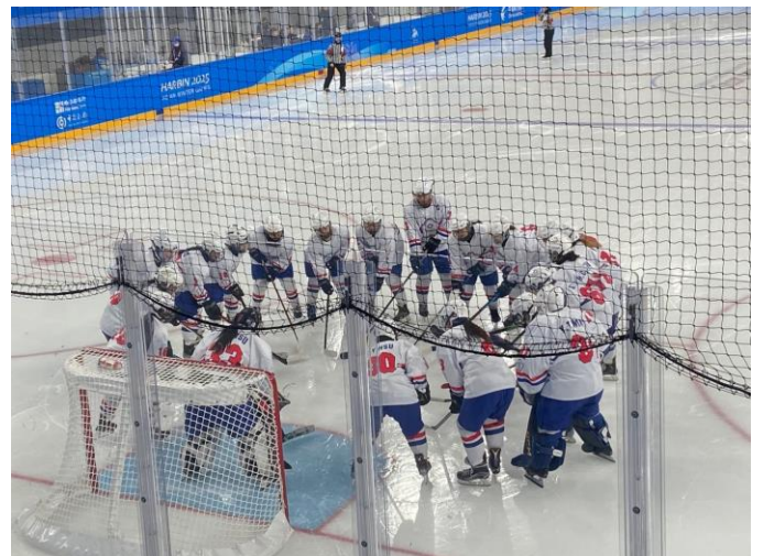
圖 14：女子冰球隊比賽情形