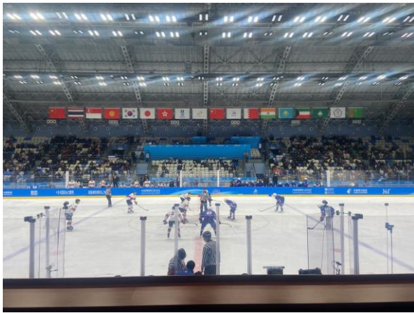
圖 11：男子冰球代表隊賽況(對戰南韓)