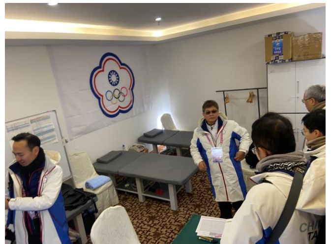
圖 2：房副署長視察亞布力地區團本部