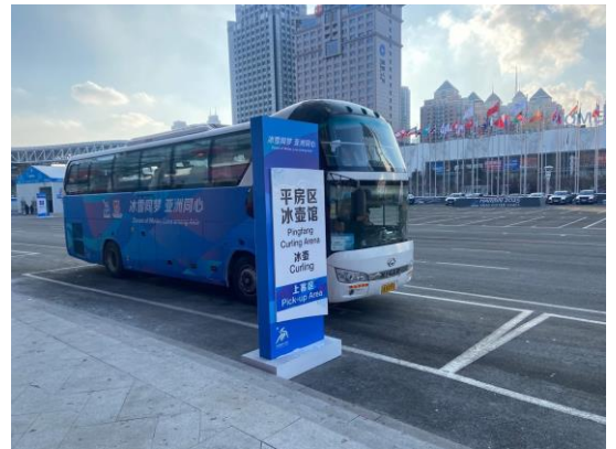
圖 20：以單一運動競賽種類提供專車路線，接駁教練、選手(冰石壺)