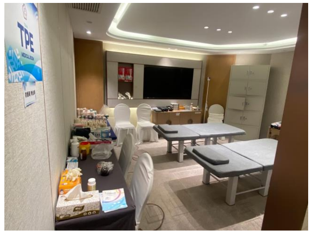
圖 18：華旗飯店團本部一隅(醫療防護區)