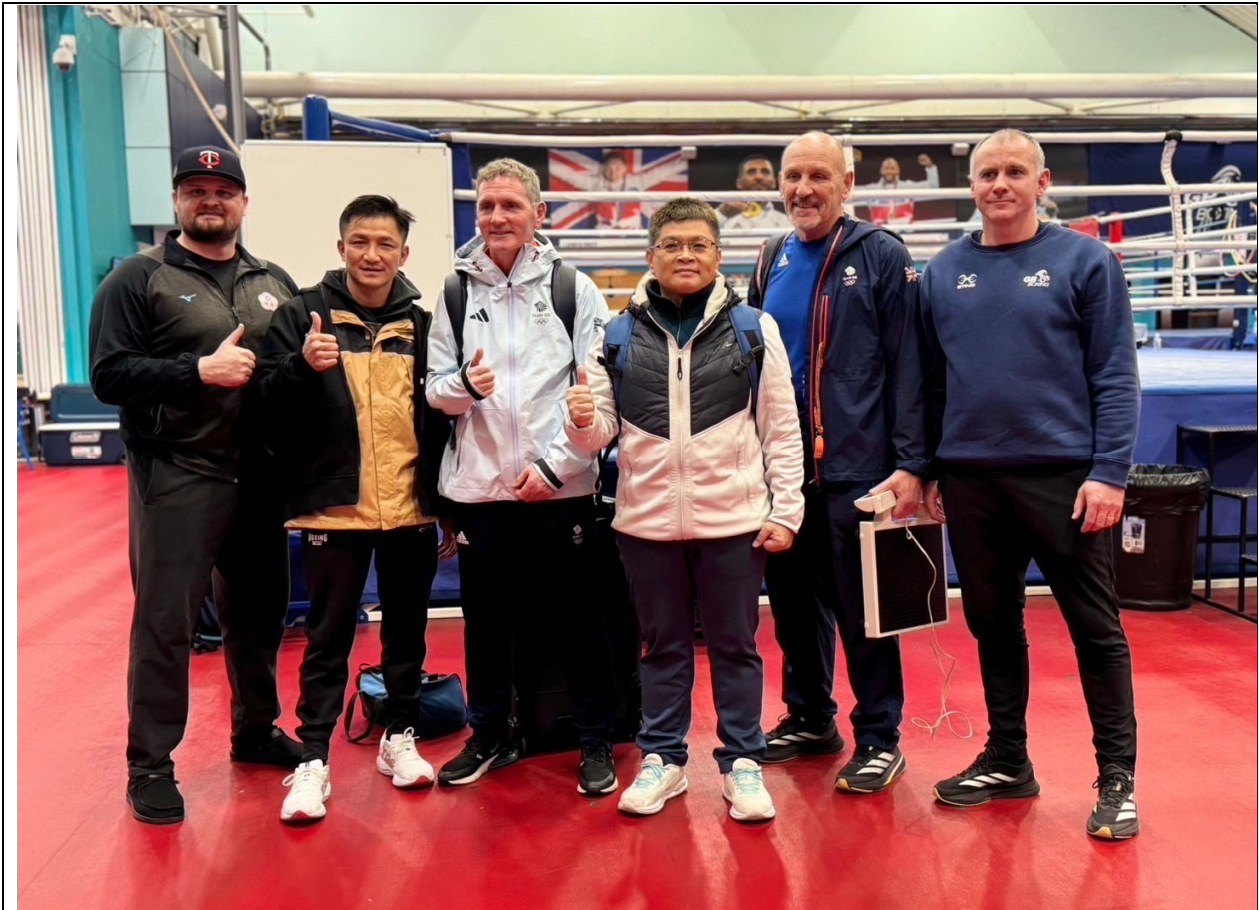
臺灣代表隊隊職員與英國隊教練合影