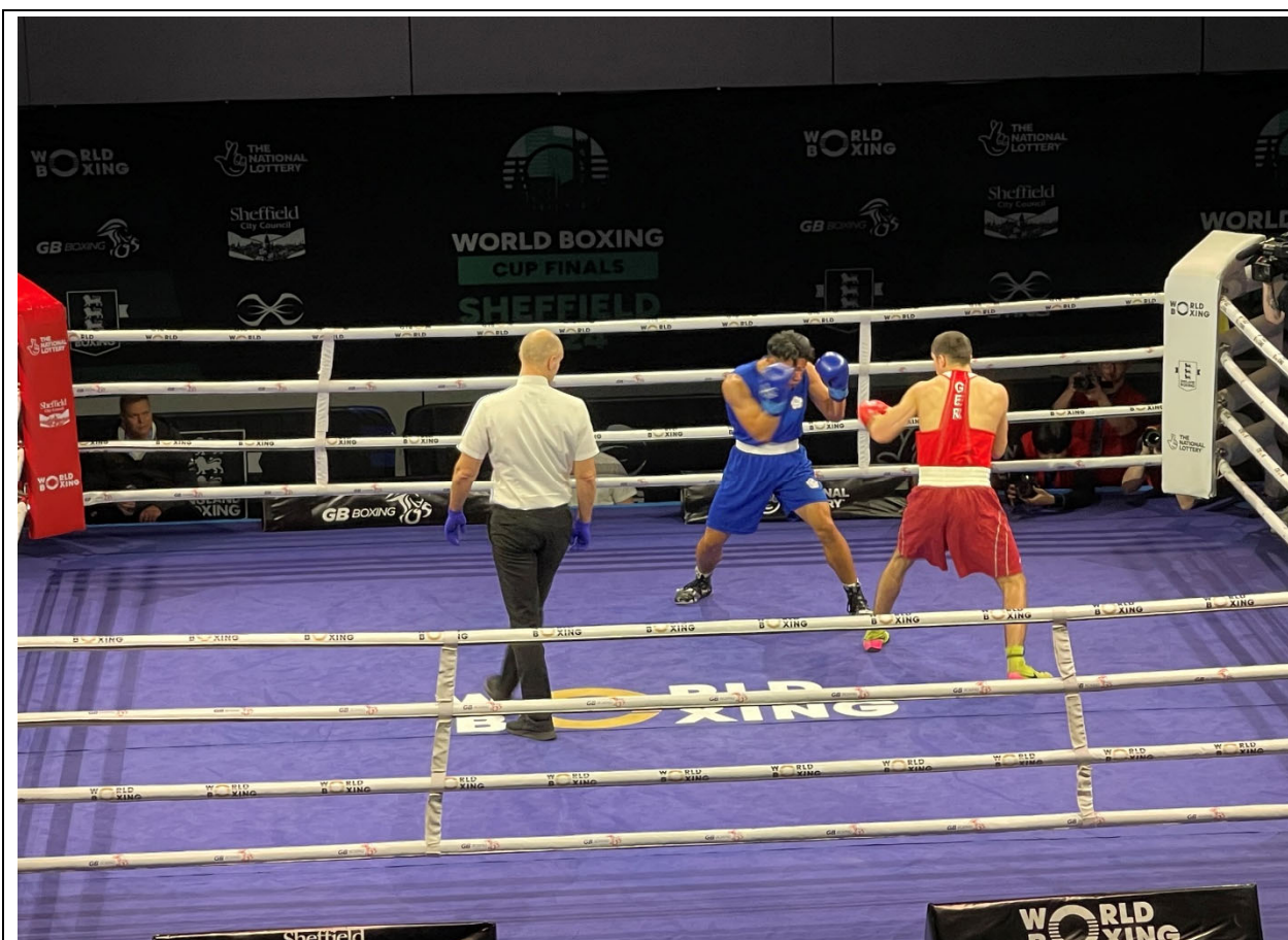
男子 71KG 甘家崙比賽情景