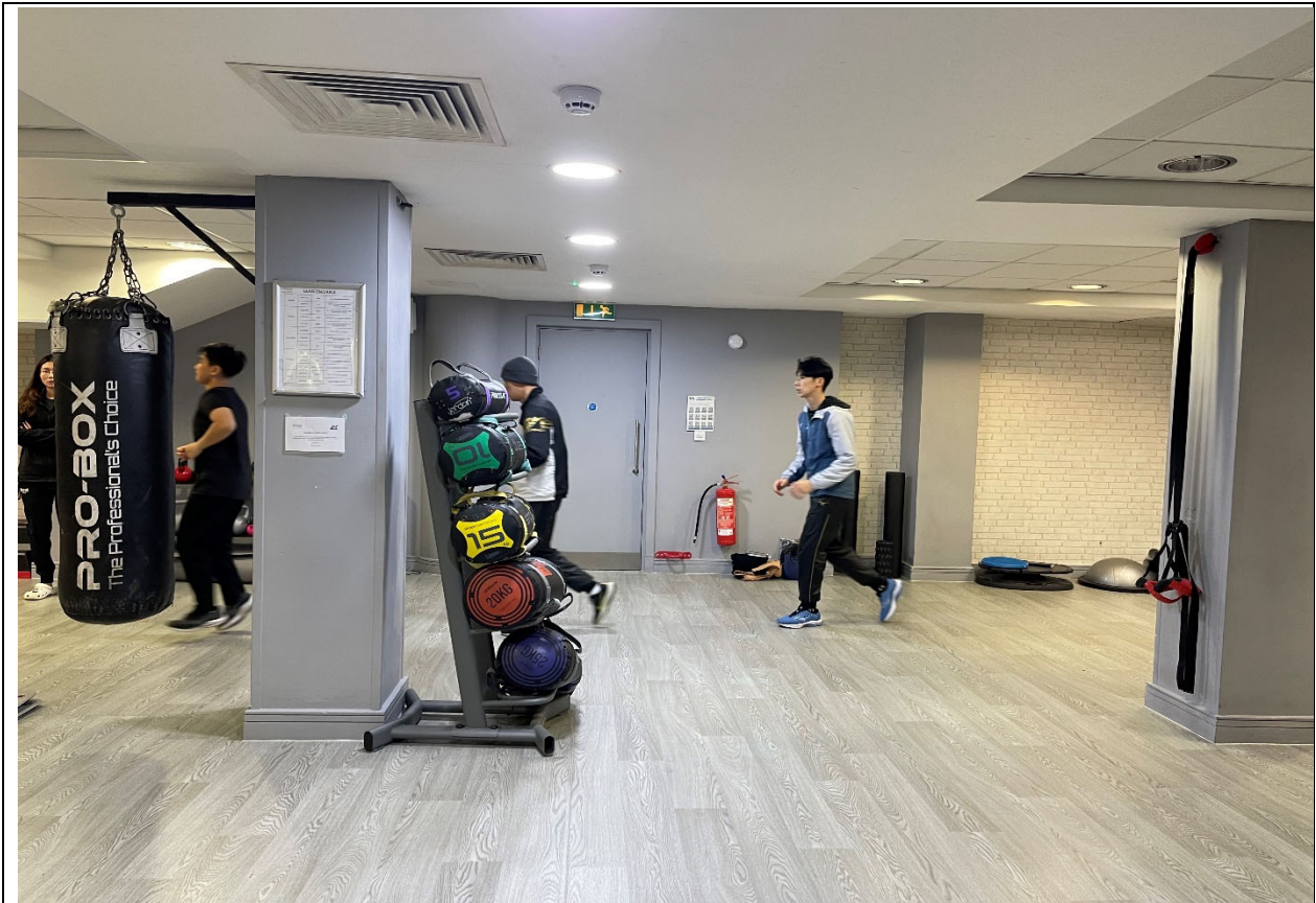
我參加 2024 世界拳總年終賽選手在飯店自主練習