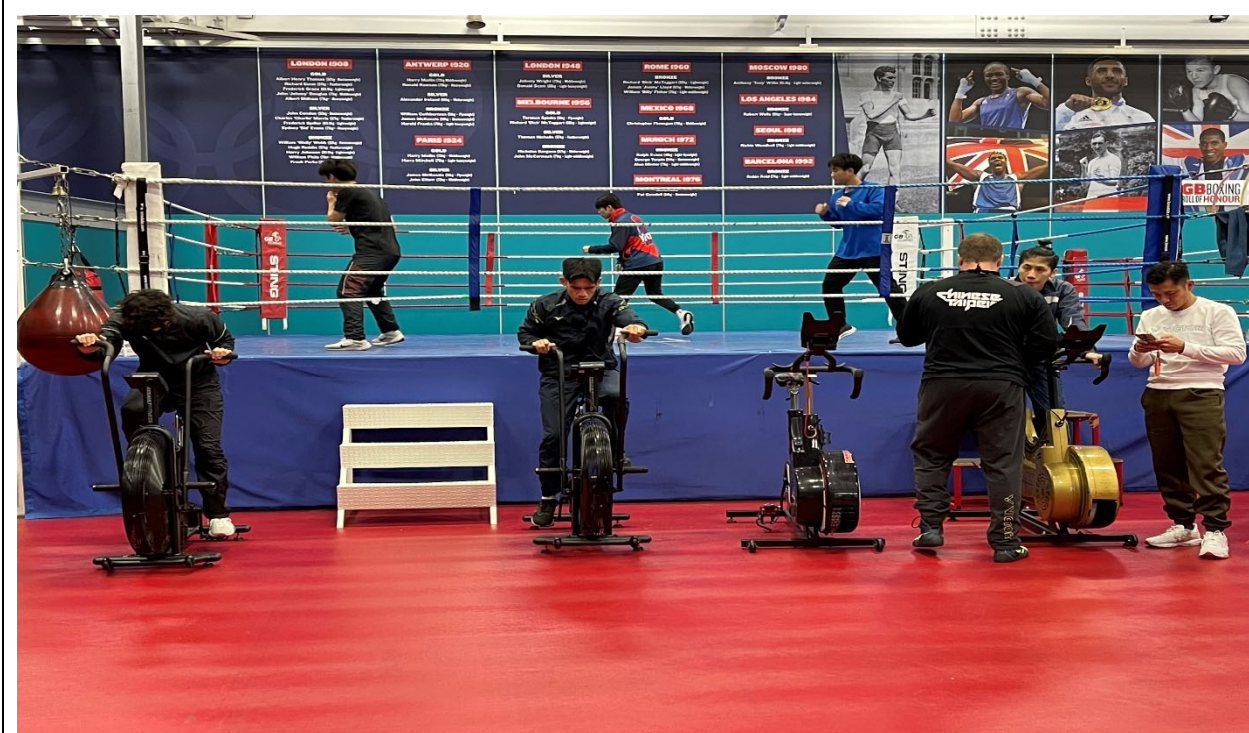
我國選手在大會提供訓練場地練習