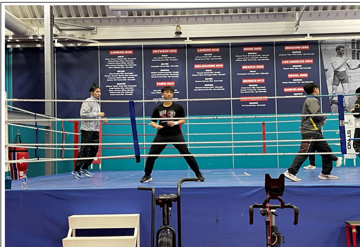
我國選手在大會提供訓練場地練習