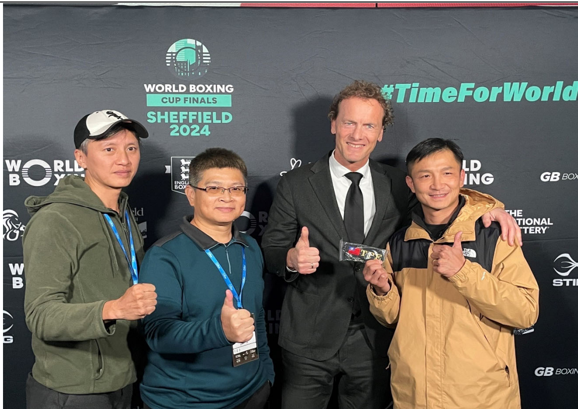
與世界拳總主席 Boris 合影