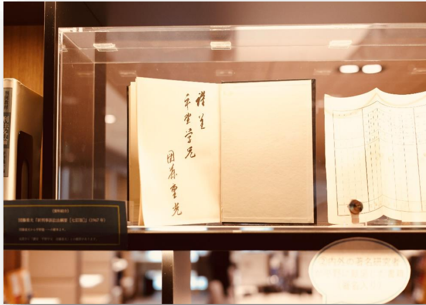
2024.10.29 中央大學館藏 團藤重光著書