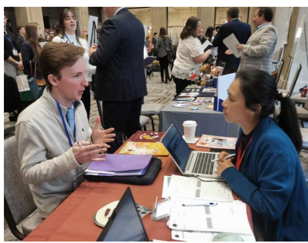
圖九：各校與外籍教師應徵者面談