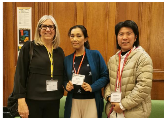
圖四：與專題講座教授合影