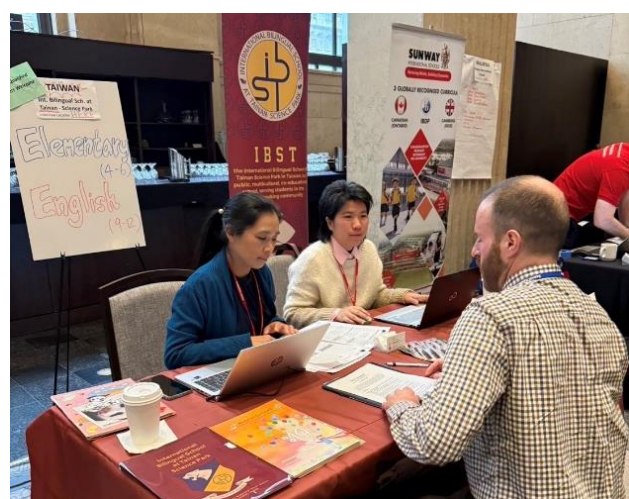
圖六：預約外籍教師應徵者面談時間