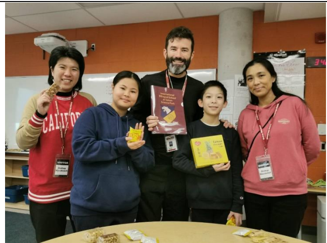
圖二：拜訪多倫多當地教師