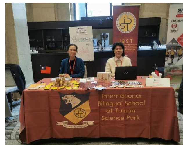
圖五：報到後布置會場