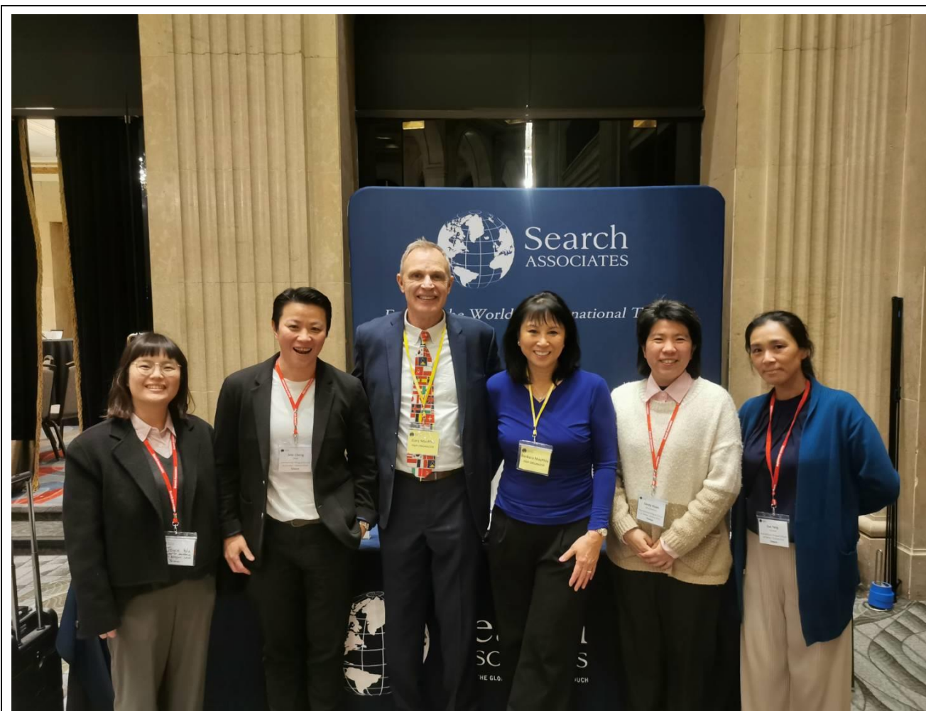
圖七：竹科實中、多倫多博覽會主辦人、南科實中合影