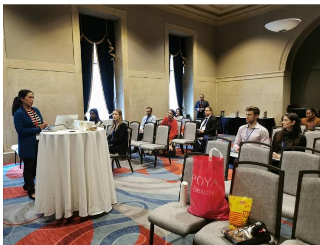
圖八：各校進行學校介紹簡報