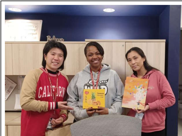
圖一：與多倫多當地學校校長合影