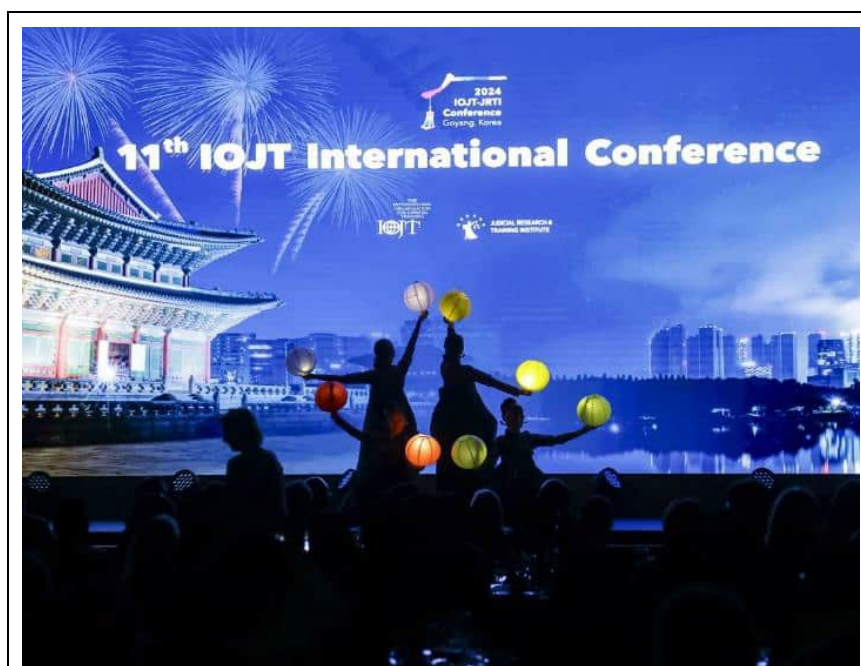
大會晚宴的傳統南韓舞蹈表演

用西式套餐及觀賞精彩的傳統南韓舞蹈，主辦單位並在晚宴的最後精心安排了摸彩活動，獎項為 Galaxy Tablet 和 Galaxy Watch，除了向世界各國展現南韓高科技的實力外，也讓年會在高潮迭起的活動中落幕。大家把握最後與來自世界各國的新朋友、舊朋友交流的機會，盡情聊天寒暄，並互相約定在 2026 年的年會中相見。