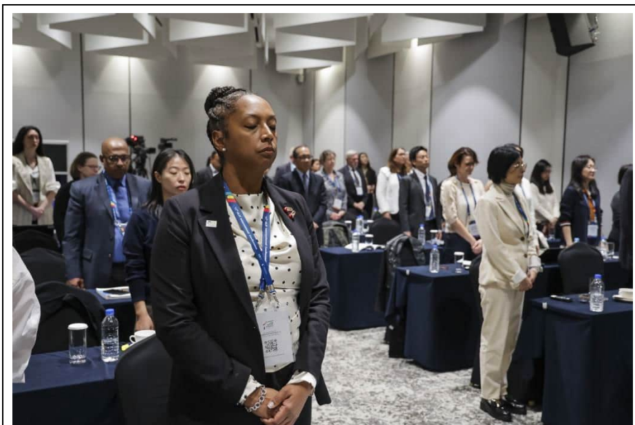
講者帶領現場參與者進行冥想與減壓練習

司法人員往往因專業壓力而感到孤立，可藉由建立互信互惠的關係，並尊重彼此的專業性與個人空間，以同理心和包容態度學會開誠佈公地溝通，維持健康的人際網絡。