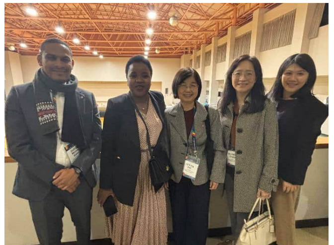
代表團與莫三比克代表合影