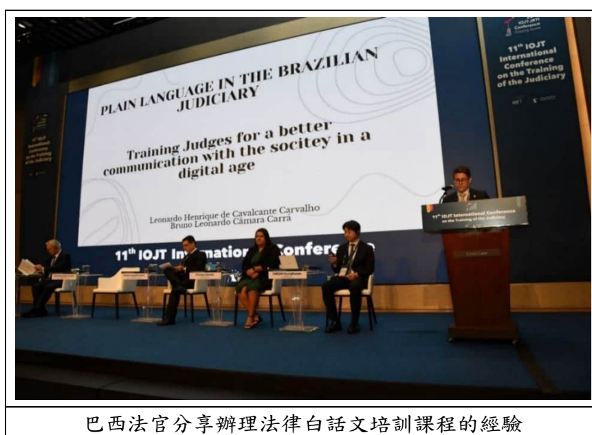
巴西法官分享辦理法律白話文培訓課程的經驗

文字搭配簡明易懂的「圖畫」，將能大幅提昇這些族群對判決主文的理解程度，例如：被告被判入獄 3 年，就以「有一個人被關在牢裡」的圖像加上「3 年」的文字來示意；離婚及子女監護的案件，就以「夫妻分開」的圖像來示意法院判准兩造離婚，並以「小孩和母親在一起」的圖像來示意子女的監護權判給母親。KWEON 法官的研究顯示，簡易判決書提升了民眾對判決主文 80% 的理解力，其中以 2 至 5 歲的兒童理解增加的幅度最明顯，另有 55% 的人表示簡易判決書比一般的判決書更容易理解。最後 KWEON 法官並提倡司法培訓機構應針對此議題開設相關培訓課程，因為只有人類法官才能理解案件當事人個別的情況，並基於對個案真誠的關注來撰寫判決，如此也才能獲得人民對司法更多的信賴。