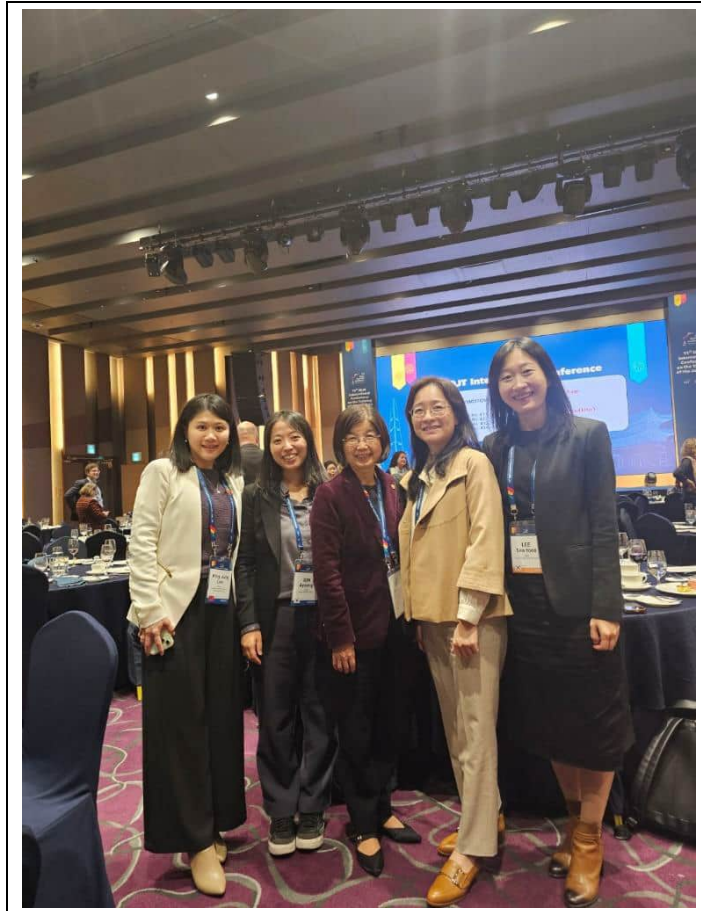
代表團與同桌用餐的南韓地方法院法官合影