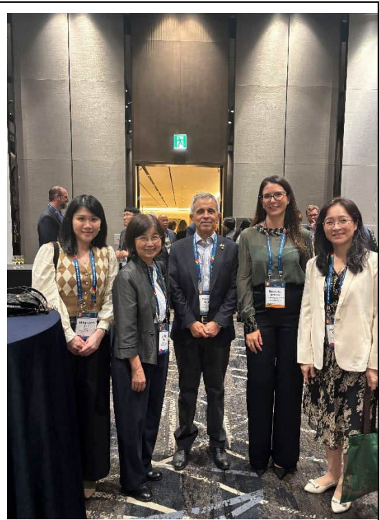
代表團與巴西法官合影