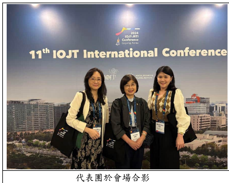
代表團於會場合影

席間代表團與克羅埃西亞、阿根廷、愛爾蘭、南非、巴西、葡萄牙、斯里蘭卡、加拿大等國的代表進行交流，並與南韓法官深入探討南韓 2009 年司法改革至今的影響及制度優缺點，度過一個熱絡且豐富的夜晚。