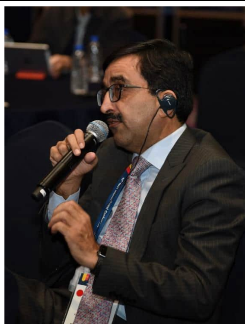
各國與會者踴躍的分享各國的作法與意見