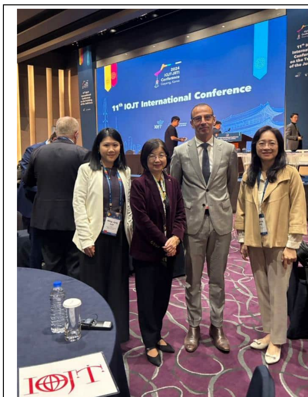
代表團與法國國家法官學院副院長 Haffide Boulakras 合影