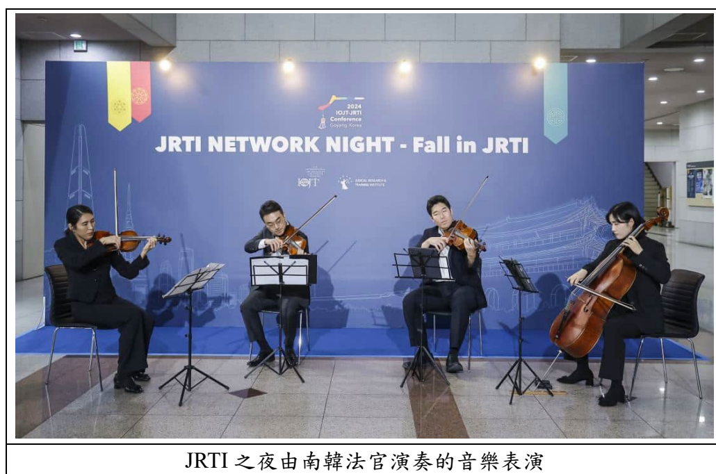
JRTI 之夜由南韓法官演奏的音樂表演

在 JRTI 之夜，主辦單位特地安排南韓法官們以小提琴及大提琴演奏，在優美的音樂盛會中，與會者度過一個愉快且悠閒的夜晚。