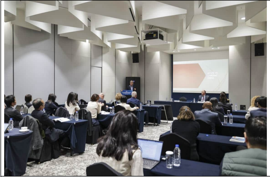
司法健康與抗壓能力演講現場