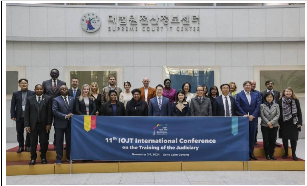
參加者在南韓最高法院 IT Center 內合影