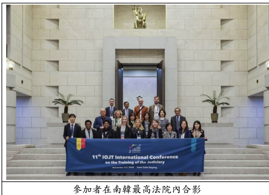
參加者在南韓最高法院內合影

南韓最高法院共14名大法官(Justice)，首席法官(Chief Justice)需經總統任命、國會同意，其餘13名大法官則需經首席法官提名、總統同任命、國會同意。這13名大法官中，有1名大法官負責行政職，其餘12位大法官與首席大法官共同負責司法審判工作，目前13名大法官中有3名女性大法官。南韓最高法院大法官的任期為6年，首席法官不得連任，其他大法官得連任一次 1 。