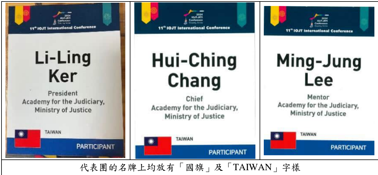
代表團的名牌上均放有「國旗」及「TAIWAN」字樣