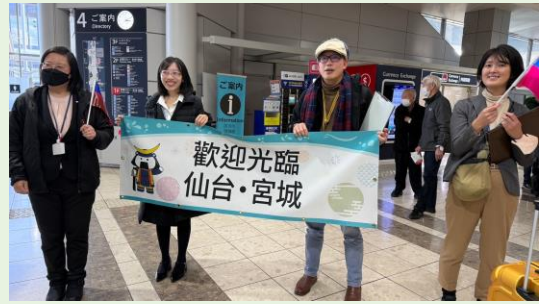
仙台機場迎接參訪團成員