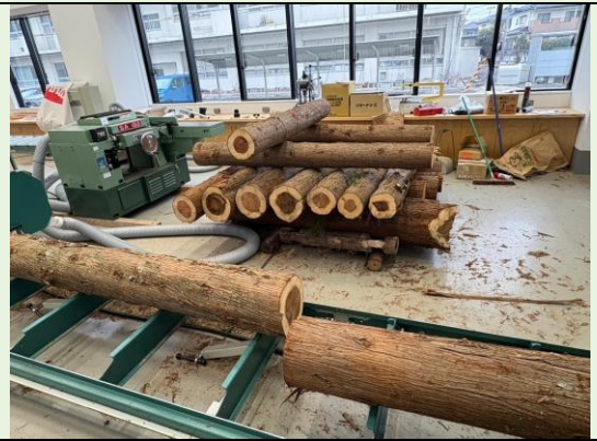
環境科學科木材加工實習工場