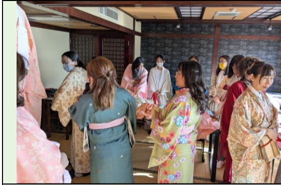
專業人員協助和服穿著體驗