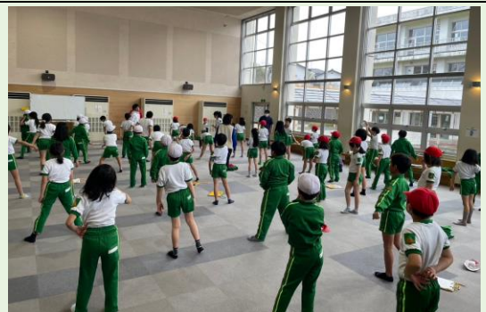
舒適寬敞的體育課室內活動空間