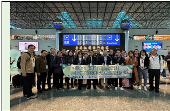
桃園機場出發前團員合影