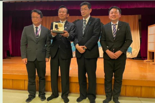
簡任視察致贈紀念品合影