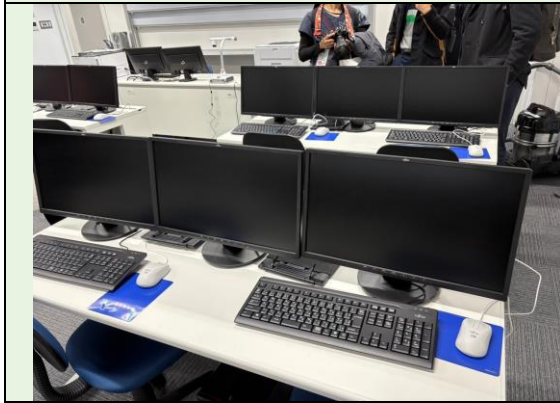
科技資訊電腦教室