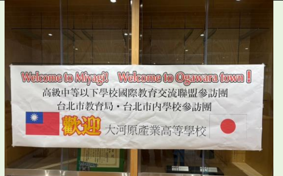
大河產業高等學校製作歡迎海報