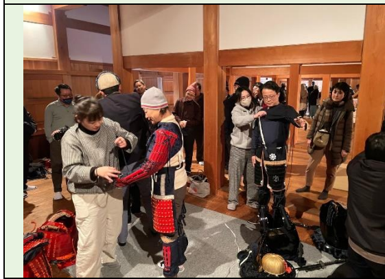
盔甲體驗工作人員協助著裝