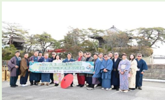
松島町內和服散步漫遊合影