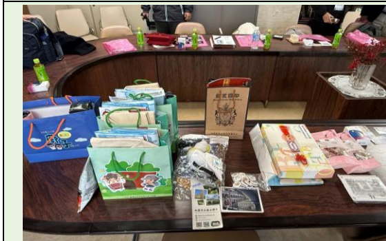
聯盟與國際教育中心準備紀念品