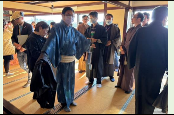
專業人員協助和服穿著體驗