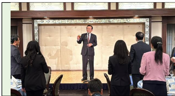
宮城縣菊地議員致詞