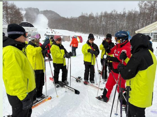
Kokeshi 博物館收藏木芥子圖案