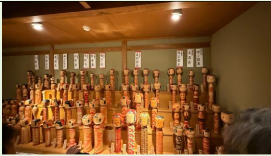
木芥子彩繪作品陳列