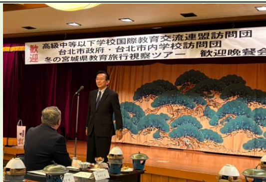
宮城縣菊地議員致歡迎詞