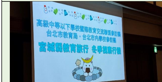
宮城縣於晚宴結束前播放行程回顧影片