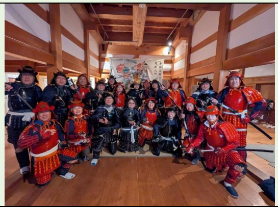
盔甲體驗全員著裝完畢合影