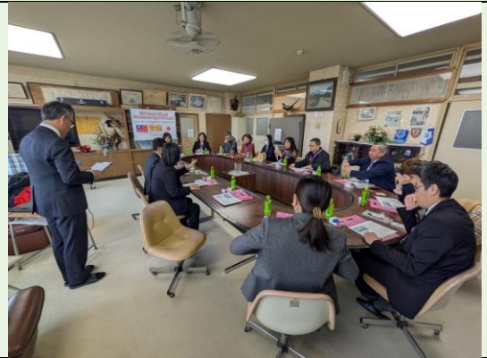
大河原南小學校校長室歡迎式與說明會