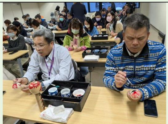
木芥子彩繪體驗實作