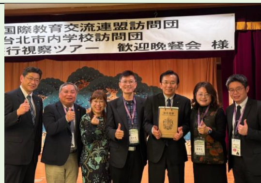
國際教育中心致贈紀念品合影