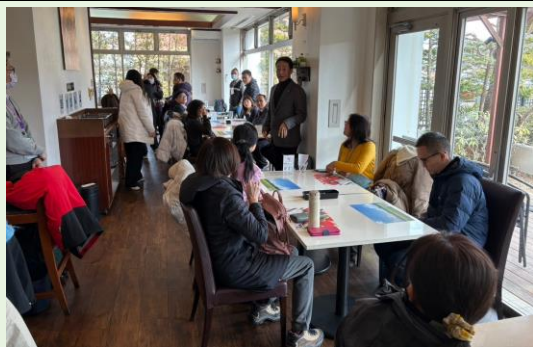
六丁目經營理念介紹說明