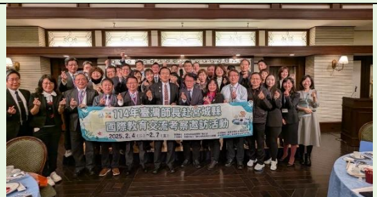
全體團員於晚宴一起合影