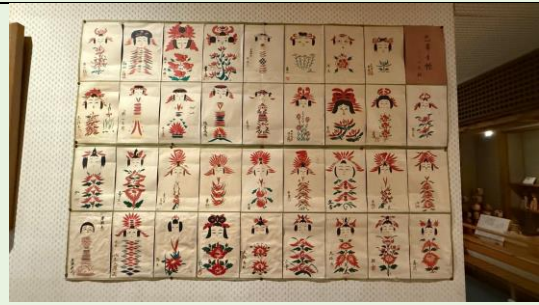
團員與木芥子彩繪作品合影