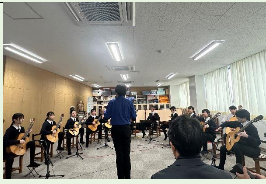
大河產業高等學校吉他社迎賓演奏