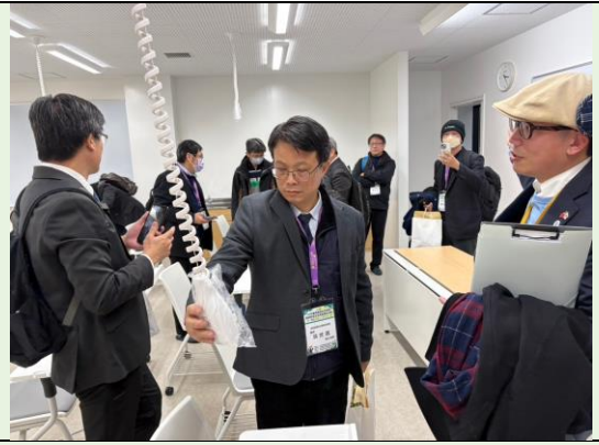
現代化的教室空間及設施設備