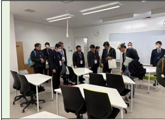
現代化新穎的教室學習環境