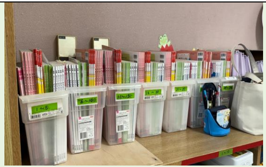
教室內學生個人書籍擺放整齊