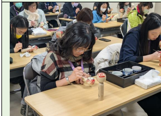
木芥子彩繪體驗實作