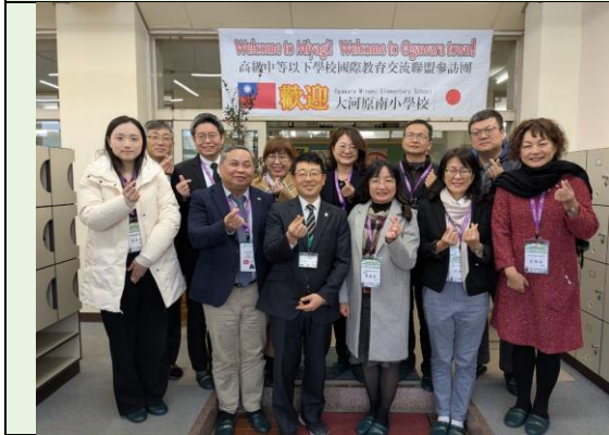
大河原南小學入校門口迎賓合影