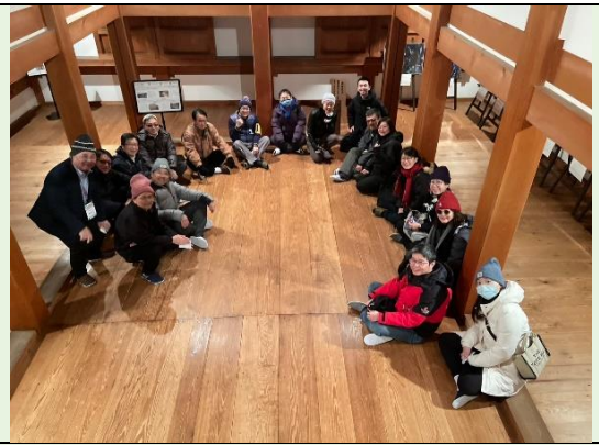
模仿武士召開戰前會議