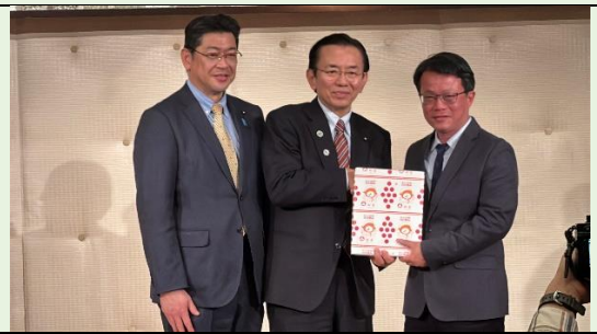
團長與議員們互贈禮物