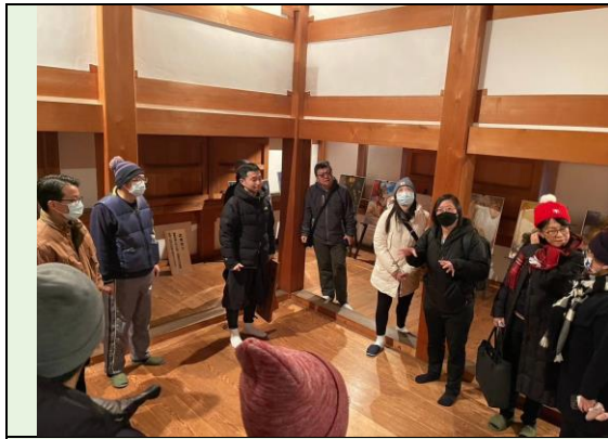
解說建物設計與作戰前準備