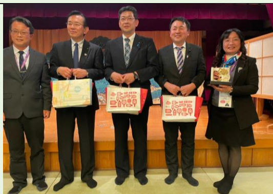
聯盟致贈紀念品合影