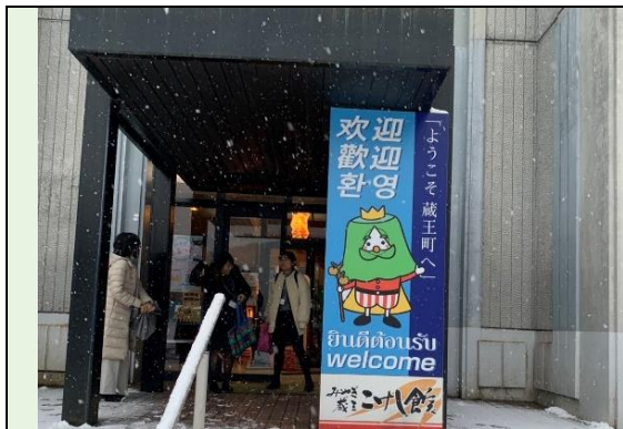
Miyagi 藏王 Kokeshi 館