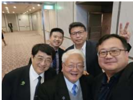
與國民健康署吳昭軍署長合影