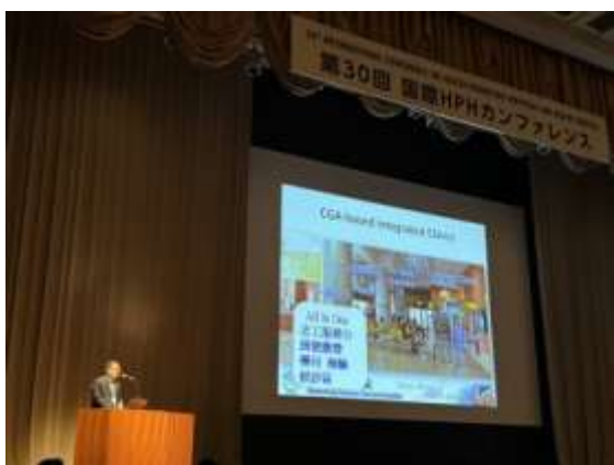
專題演講，分享高雄榮總高齡友善經驗