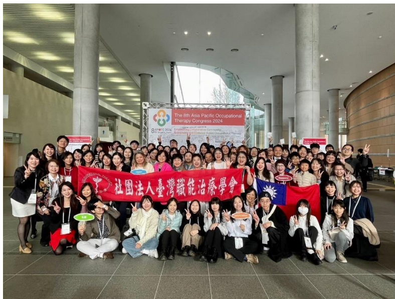
研究交流及台灣團合影