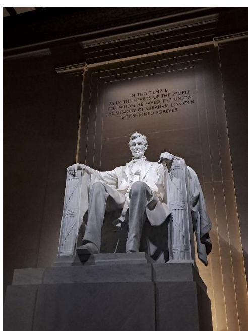
圖 3. 林肯紀念堂