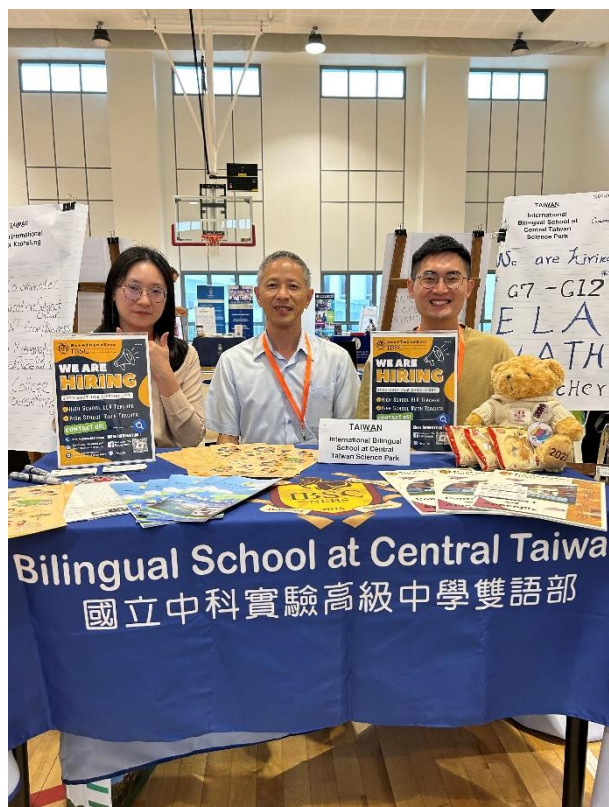
▲本校於徵聘會議的攤位