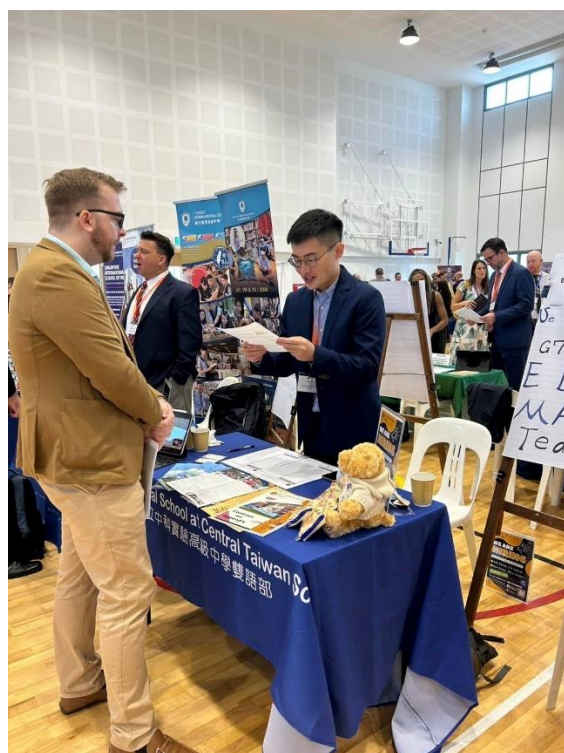
▲和外師排定面試時間