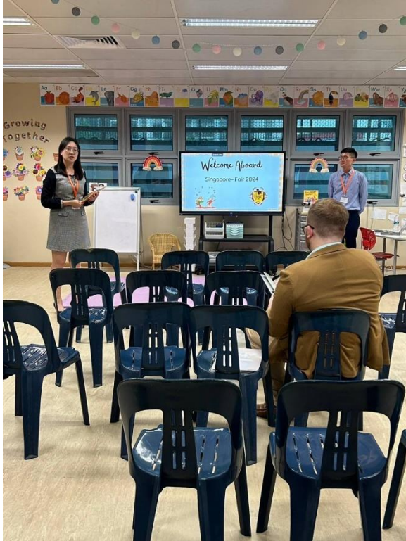
▲本校秘書與雙語部主任進行學校報告