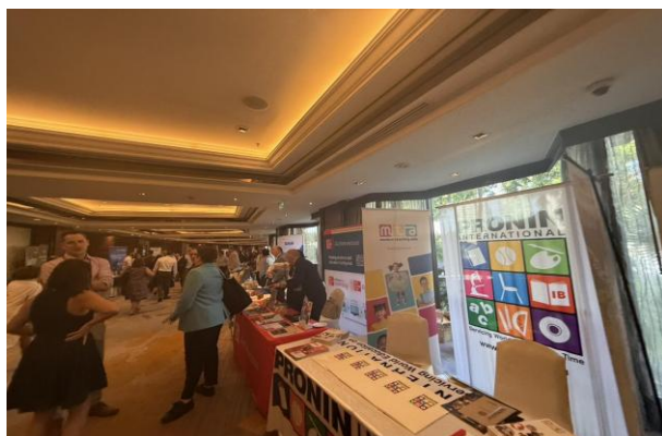
圖三、與會廠商展覽會場