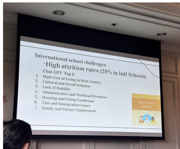
圖二、國際學校甄聘教師的困境與討論