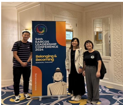
圖一、理事會會場旗幟與與會同仁合影