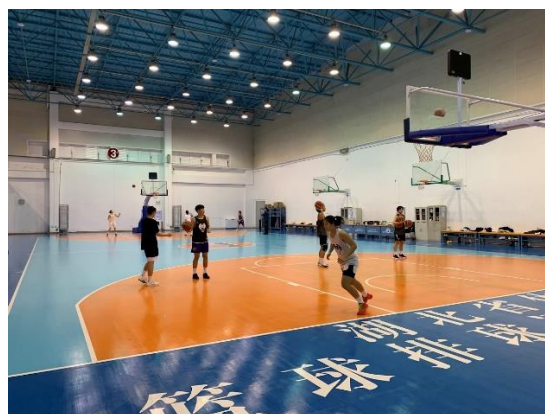
參觀奧體中心籃球運動訓練場館