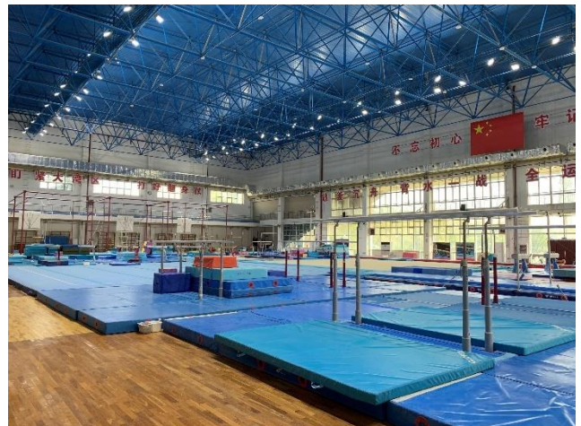
參觀奧體中心體操場館