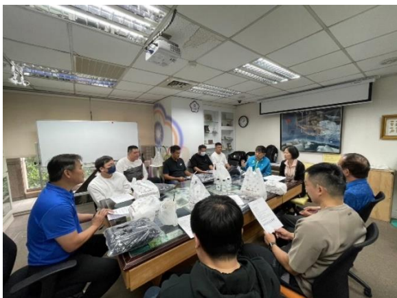
競技教練團行前說明會