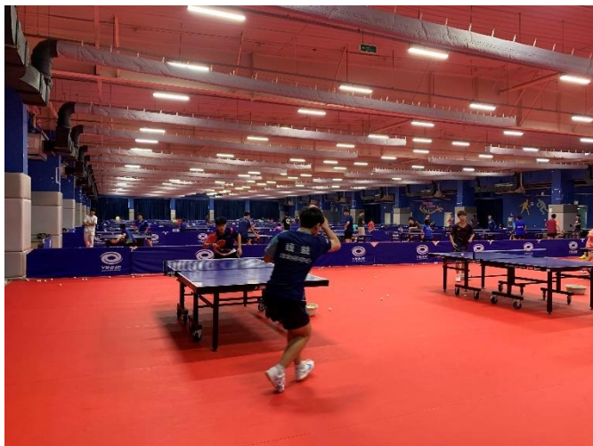
參觀武漢市體育運動學校桌球場館