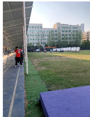
參觀武漢射擊射箭學校訓練場館