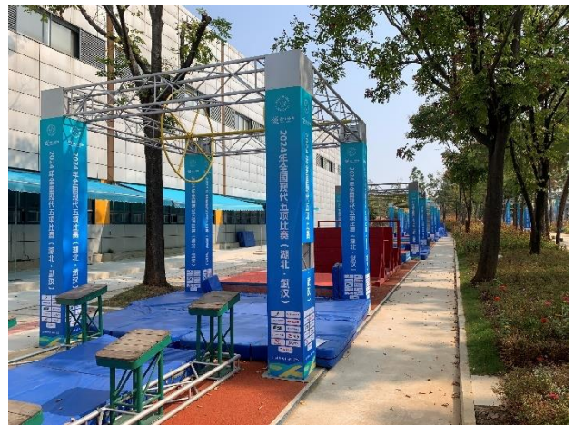
參觀奧體中心現代五項設施