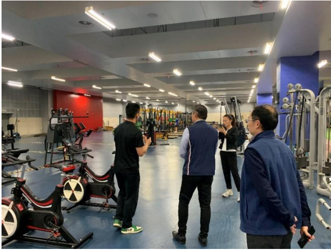
參觀奧體中心重量訓練場館