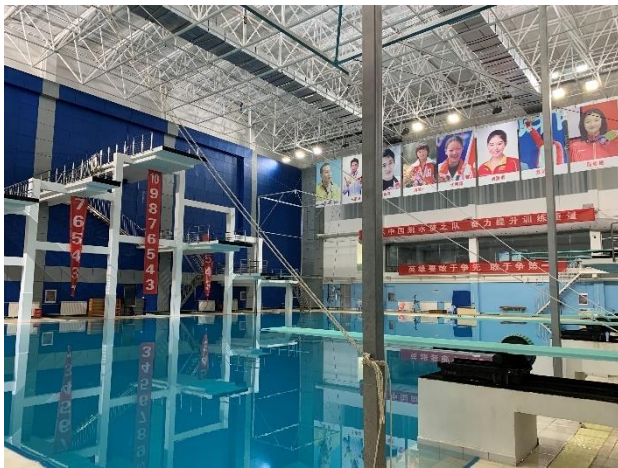
參觀奧體中心跳水場館