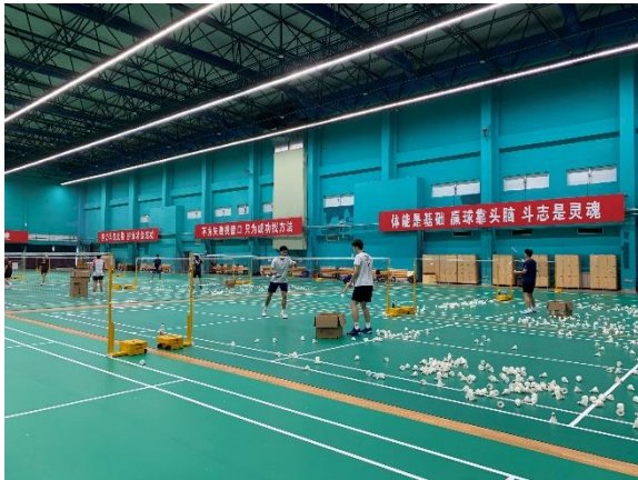
參觀奧體中心羽球場館