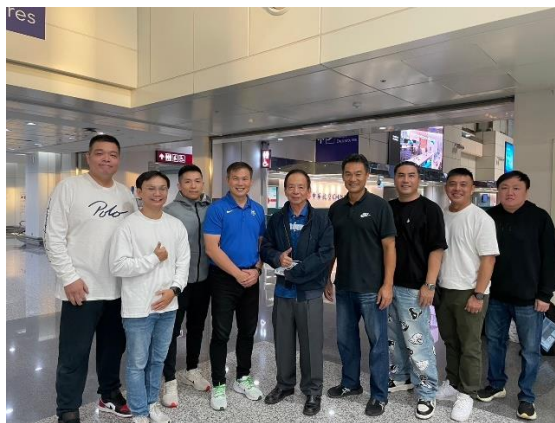
競技教練團出發大合照