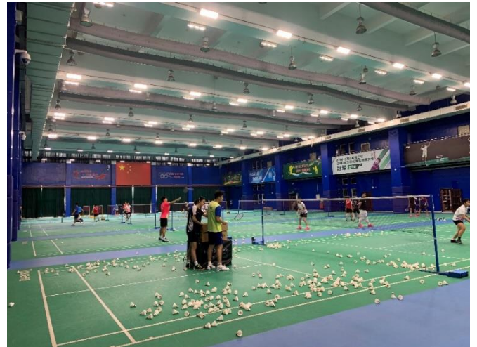
參觀武漢市體育運動學校羽球場館