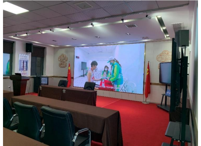
參觀湖北省反興奮劑中心