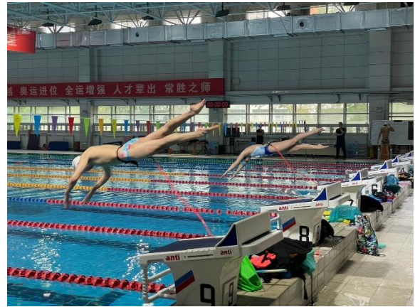
參觀奧體中心游泳場館