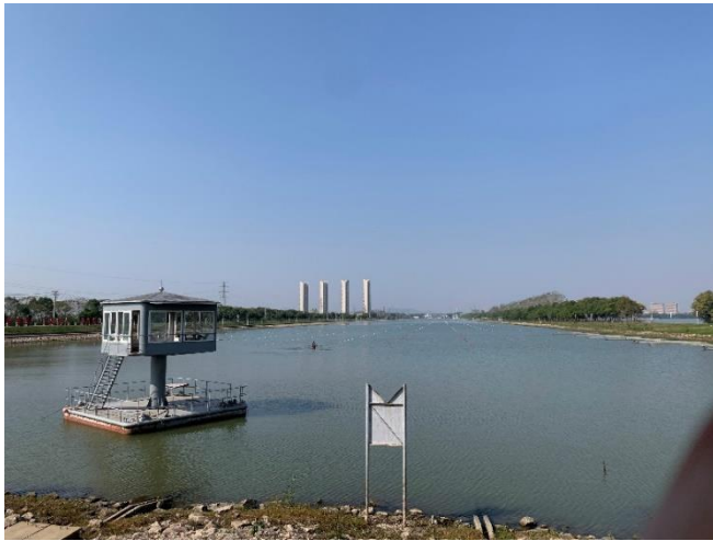
參觀湖北省水上訓練基地