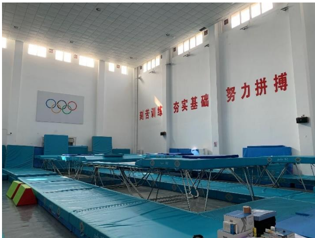
參觀奧體中心彈翻床場館