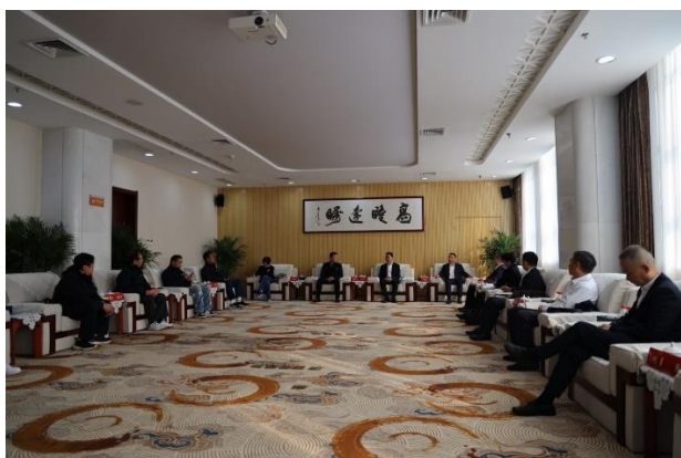
競技教練團歡迎座談會