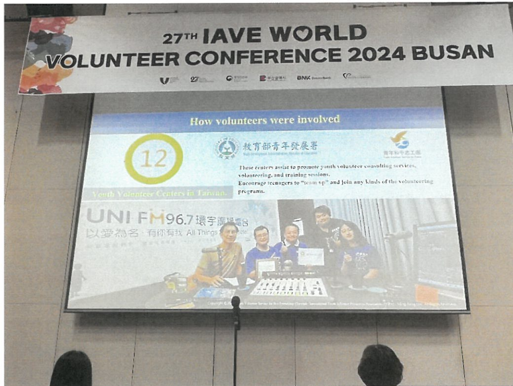
研討會-來自我國的志工團體環保星勢力於演講中提到教育部青年發展署