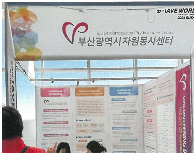
會場擺攤-釜山市志願服務中心