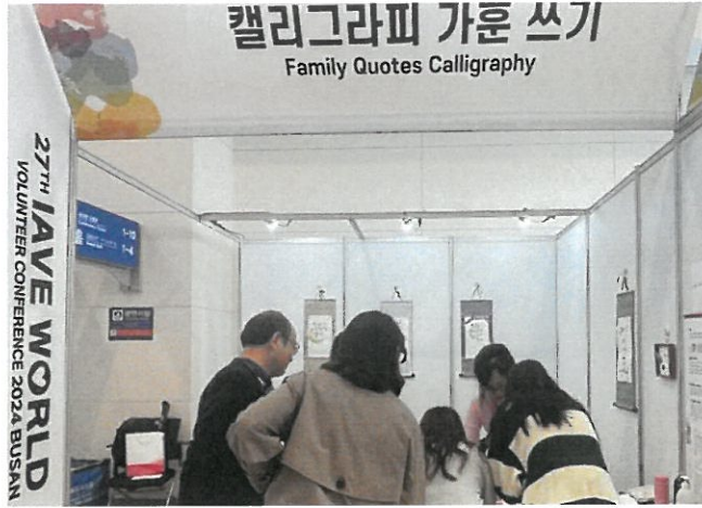
會場擺攤-韓國家庭書法