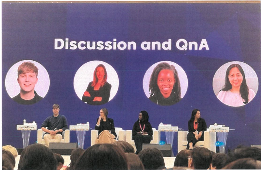
全體會議 III-講者 QA 時間