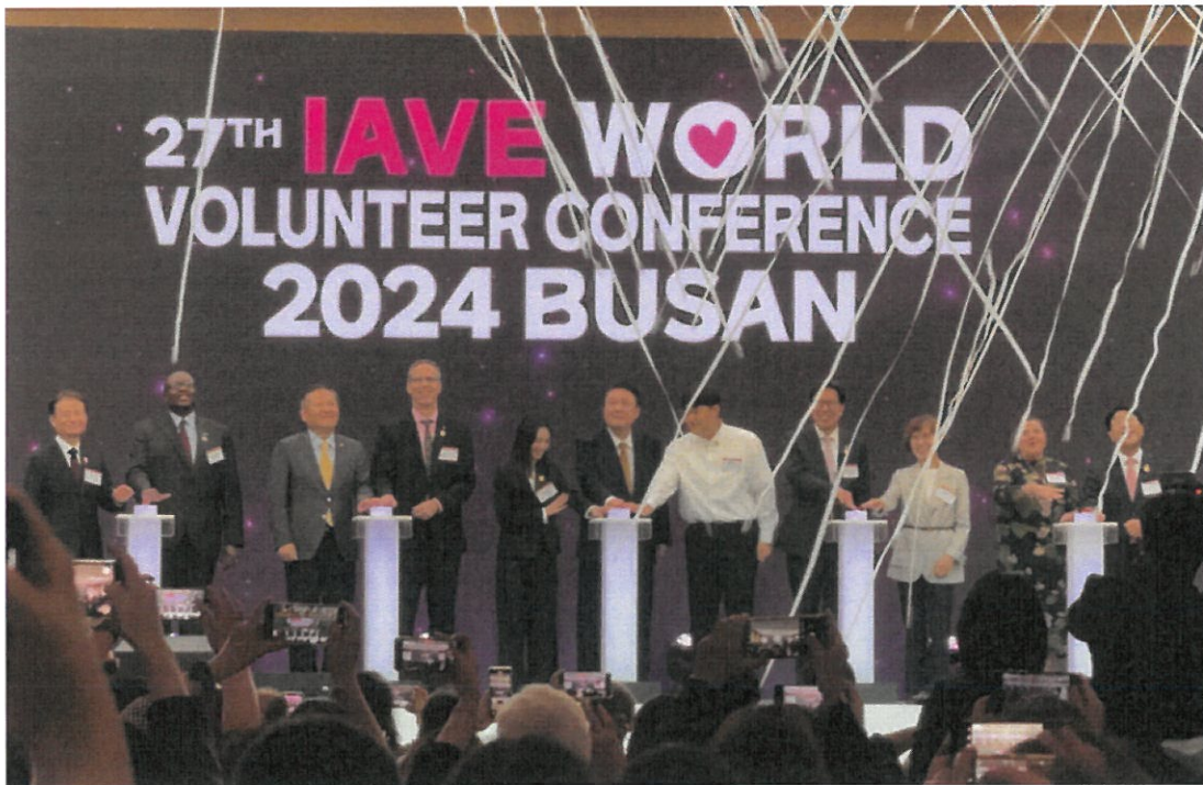
開幕式-第 27 屆 IAVE 世界志願者大會在彩帶表演中拉開帷幕，南韓總統尹錫悅（中）參與開幕