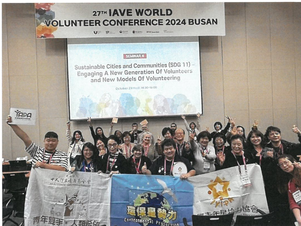
研討會-來自我國的志工團體環保星勢力分享新生代志工的參與志願服務，會後合影