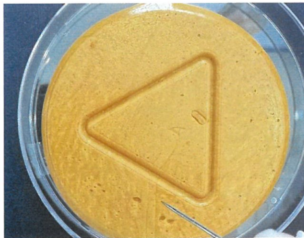
會場擺攤-提供南韓知名戲劇中的椪糖挑戰