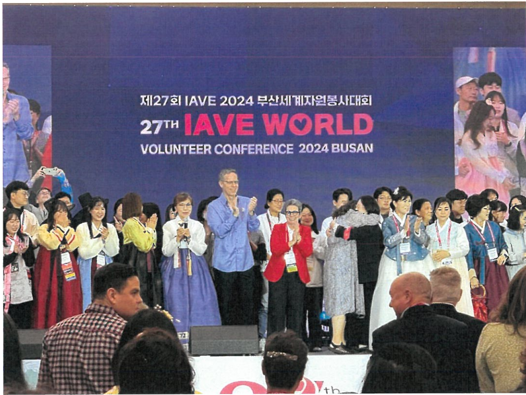
閉幕式-主辦方國際志工協會及釜山志願者服務中心於台上集合進行謝幕