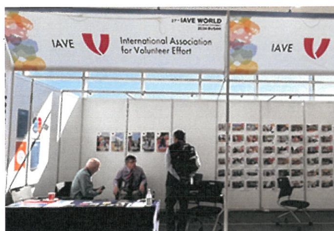
會場擺攤-國際志工協會