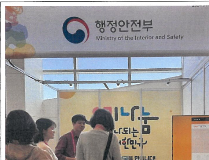
會場擺攤-南韓政府的行政安全部