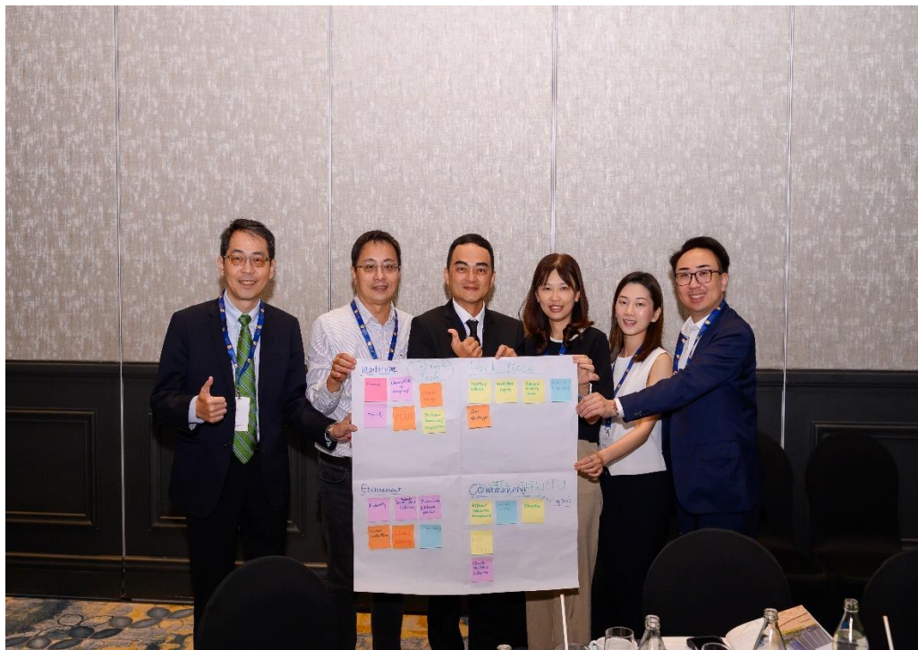
台灣中油公司、瑞昶科技公司與香港恆基兆業地產公司腦力激盪成果