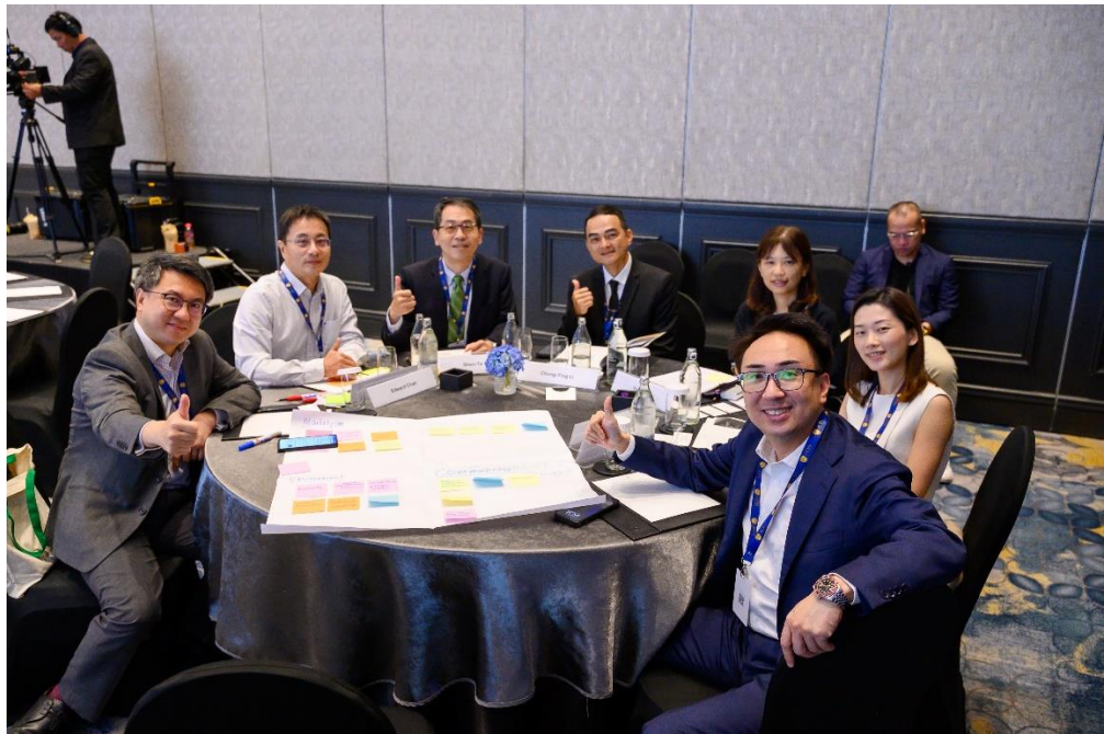
本公司、瑞昶科技公司與香港恆基兆業地產公司同桌交流