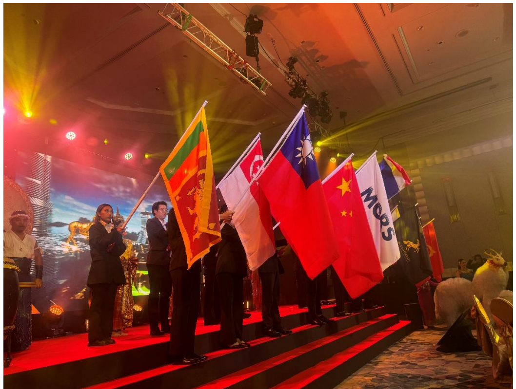
台灣國旗再次飄揚在國際舞台上