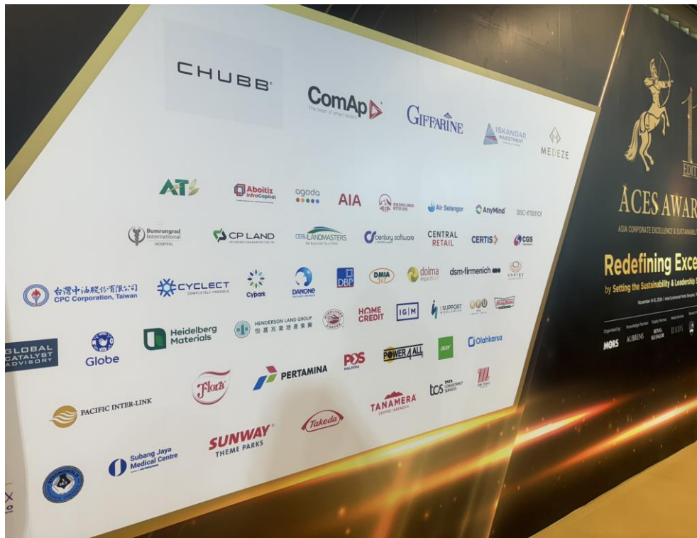
企業品牌牆印有本公司logo