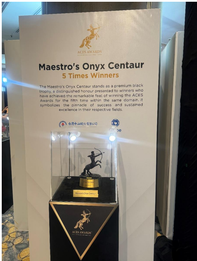
會場上表揚五次以上獲獎企業