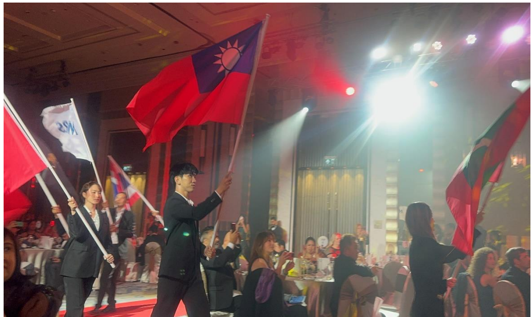
台灣中油公司代表台灣優勝企業，榮耀進入會場