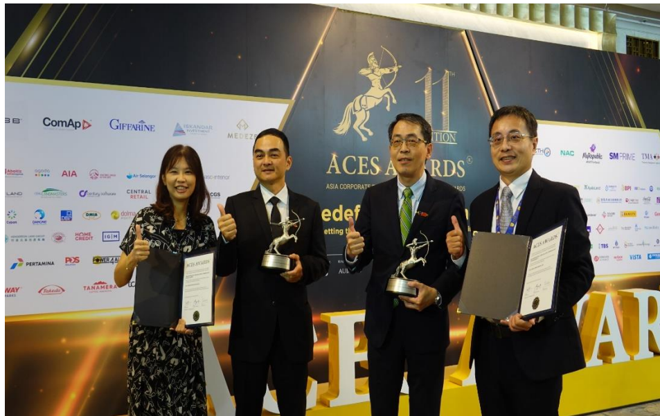
2024ACES 本公司與瑞昶科技公司代表獲獎團隊於得獎企業品牌牆