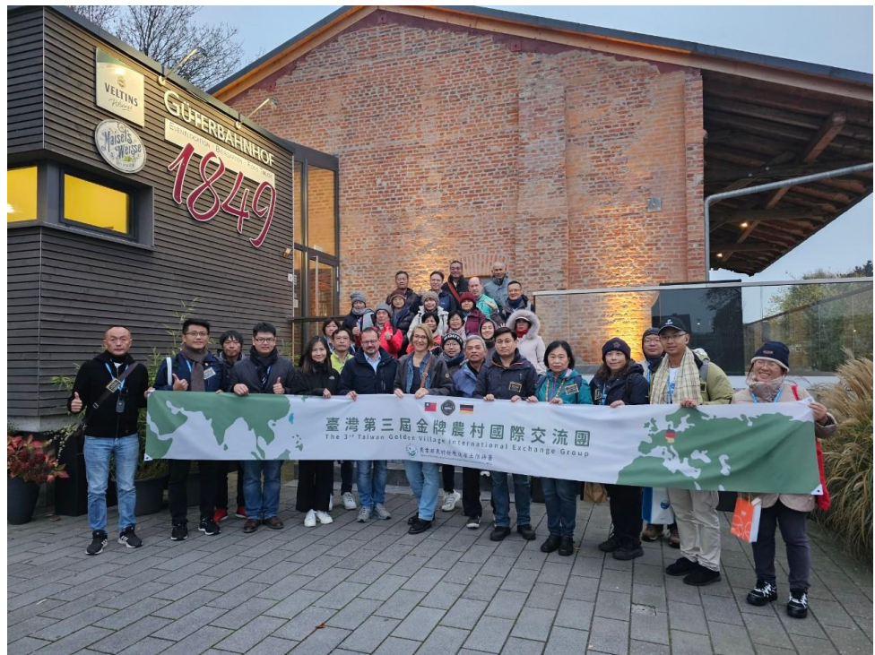
圖3 餐廳 Güterbahnhof 1849 GmbH & Co KG 案例參訪