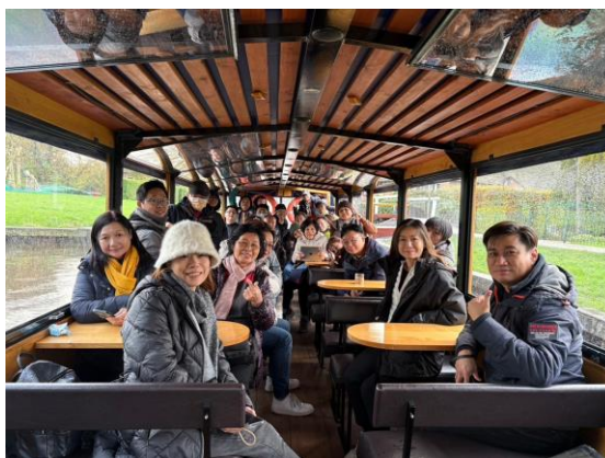
圖23 入境隨俗的參訪團

Giethoorn村良好的生態條件，如今仍保持著美麗的自然風光，沒有汽車、沒有公路，只有縱橫密布的河網，和176座連接各戶人家的小木橋。整個鄉村就是一個公園，一個公園田園社區，被譽為「荷蘭威尼斯」、「人間仙境」，現在每年擁有不少於50萬人次的遊客量。