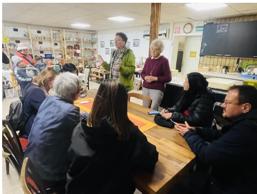
圖9 村莊小店DORFTREFF經營理念分享