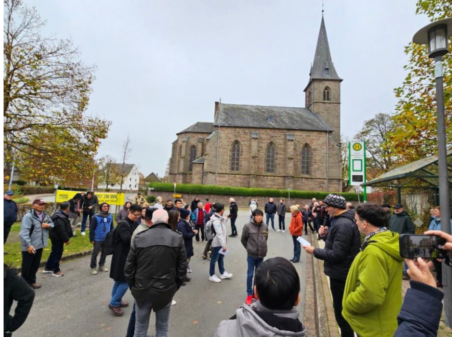
圖13 村民在巴士站重現聯邦競賽實況