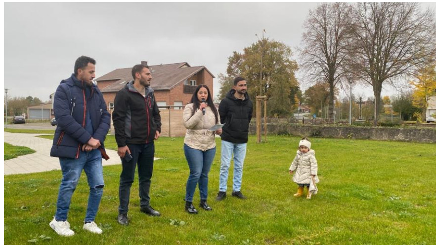
圖15 誠摯邀請新移入與難民申請入住，提高在地人口

4.村民友善的態度、主動協助進行語言訓練與日常生活技巧，讓難民安心入住，能對未來再次充滿希望。