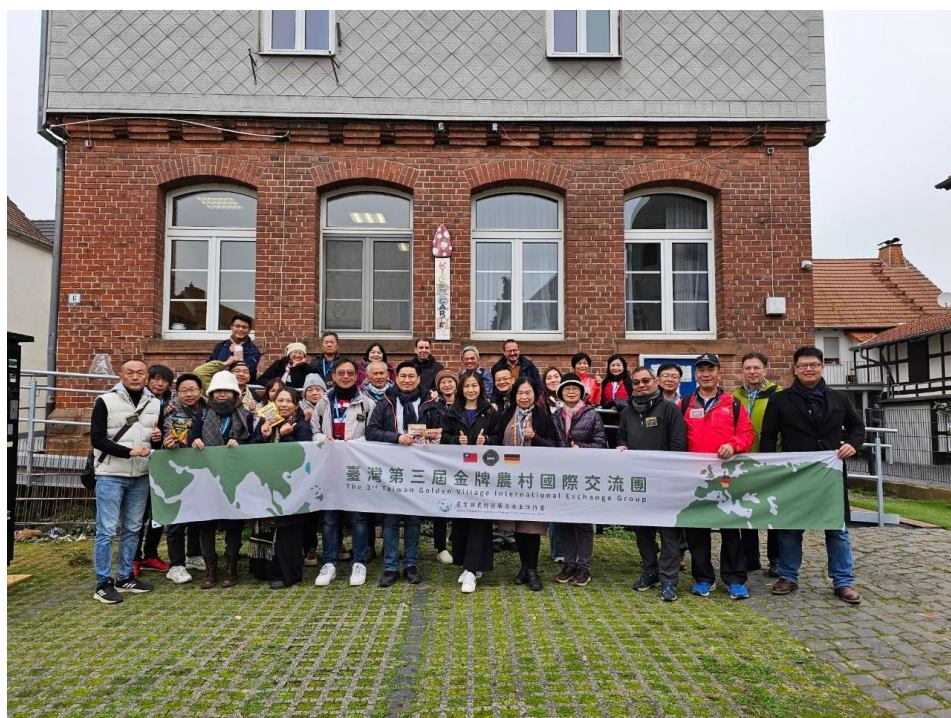
圖 7 Roth 村-老屋活化轉型青銀共創據點