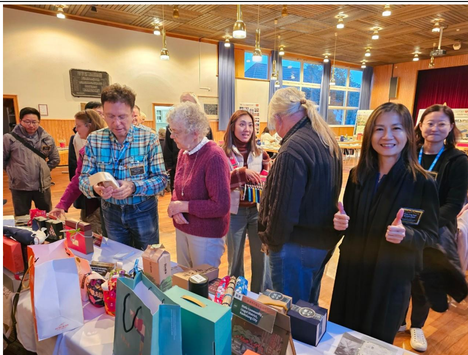
圖11 向尼德瓦爾根村民解說臺灣金牌農村產品