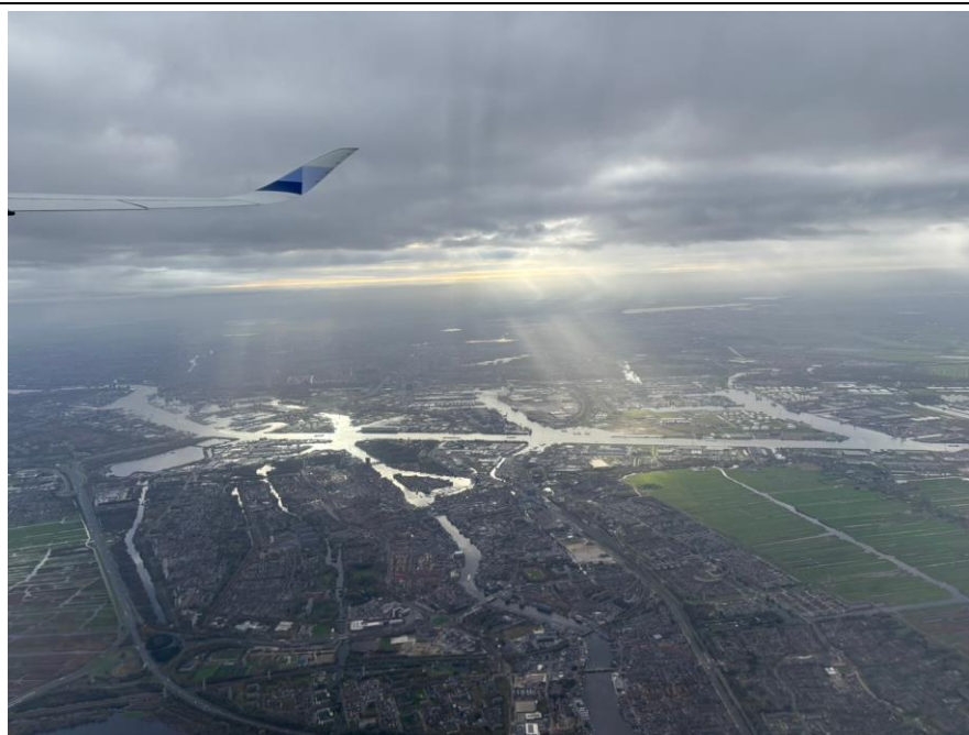
圖25 俯瞰與海爭地的歐洲農業大國-荷蘭