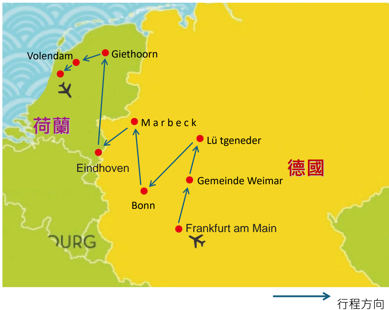
圖 1 行程路線圖