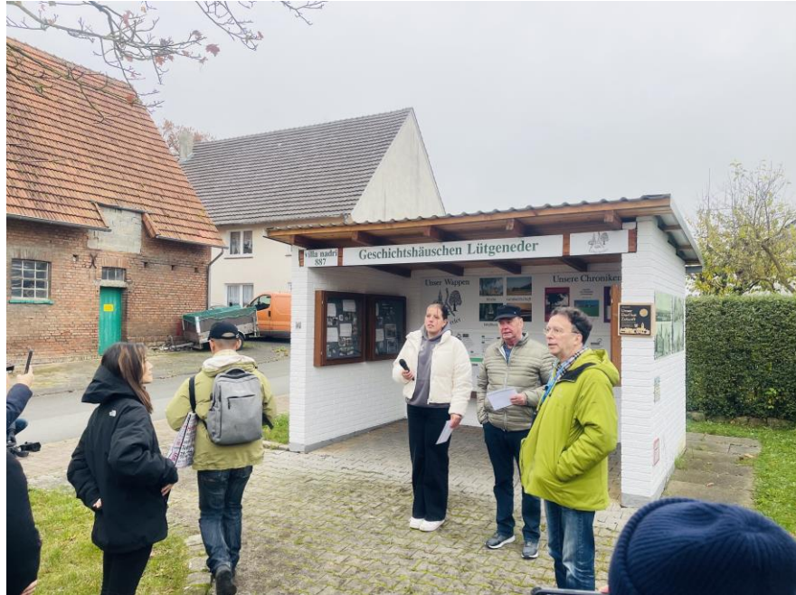
圖14 村民在歷史小屋重現聯邦競賽實況