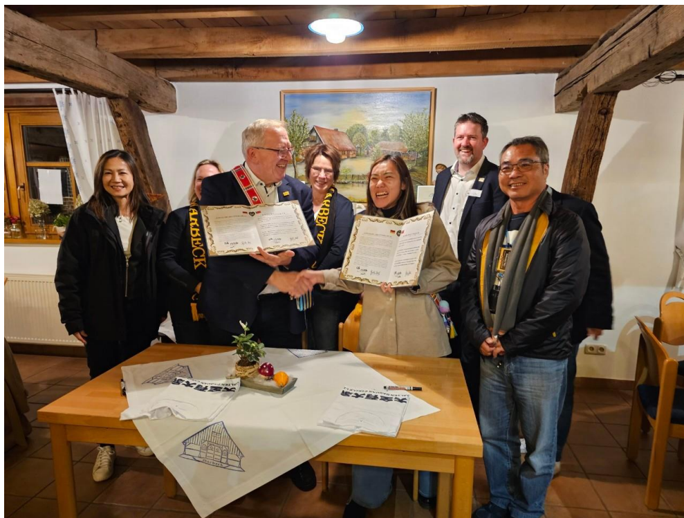
圖19 花蓮大全社區與馬貝克村簽署臺德姊妹村