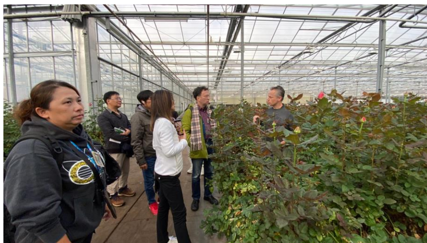
圖21 解說運用發電過程中製造出來的二氧化碳，