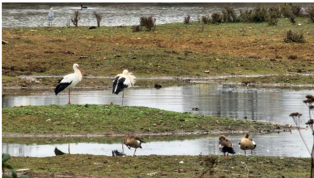
圖8 受保護的馬丁湖，展現了自然生態的恢復力

馬丁湖的形成與地下水位上升密切相關。自1989年水泥場遷走後，出現了三個小湖，這為當地的生態環境帶來了顯著變化。如今，這裡成為了鳥類北歐遷徙至非洲過冬的必經之地，並已被劃定為受保護的生態池，展現了自然生態的恢復力。