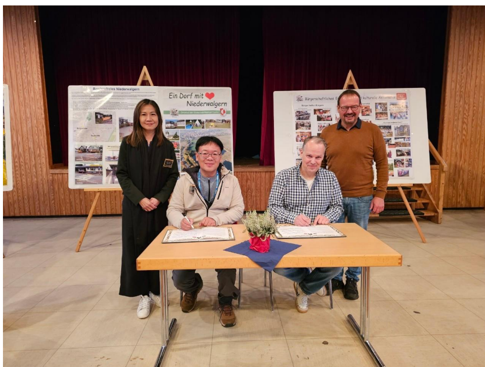
圖10 雲林華南社區與尼德瓦爾根村簽署臺德姊妹村