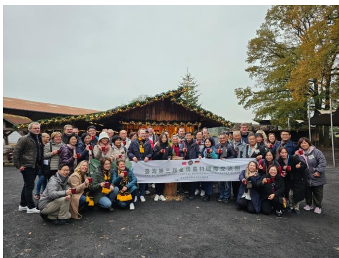
圖18 爾茲·貝克爾森林農場歡迎臺灣參訪團