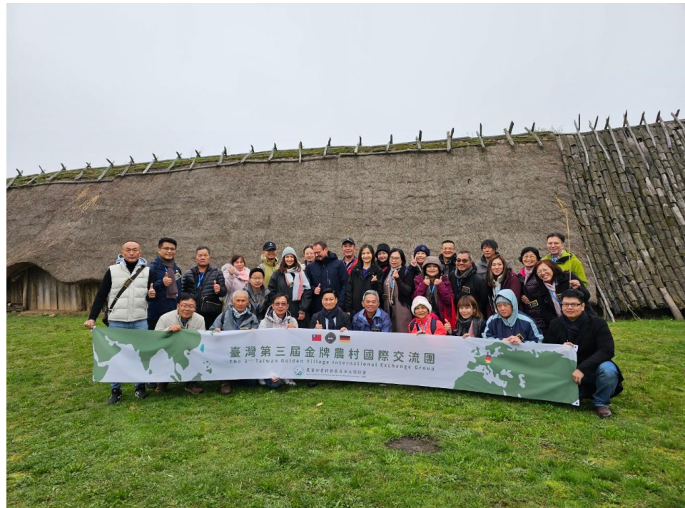
圖 6 Argenstein 村-時代之島旗艦計畫

Argenstein 村-時代之島(考古博物館)旗艦計畫(威瑪市與馬堡大學合作)