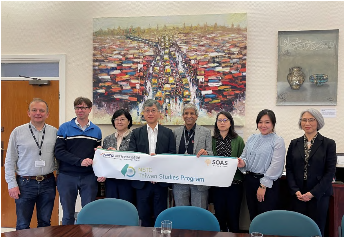
圖九、雙方於SOAS校長室合影