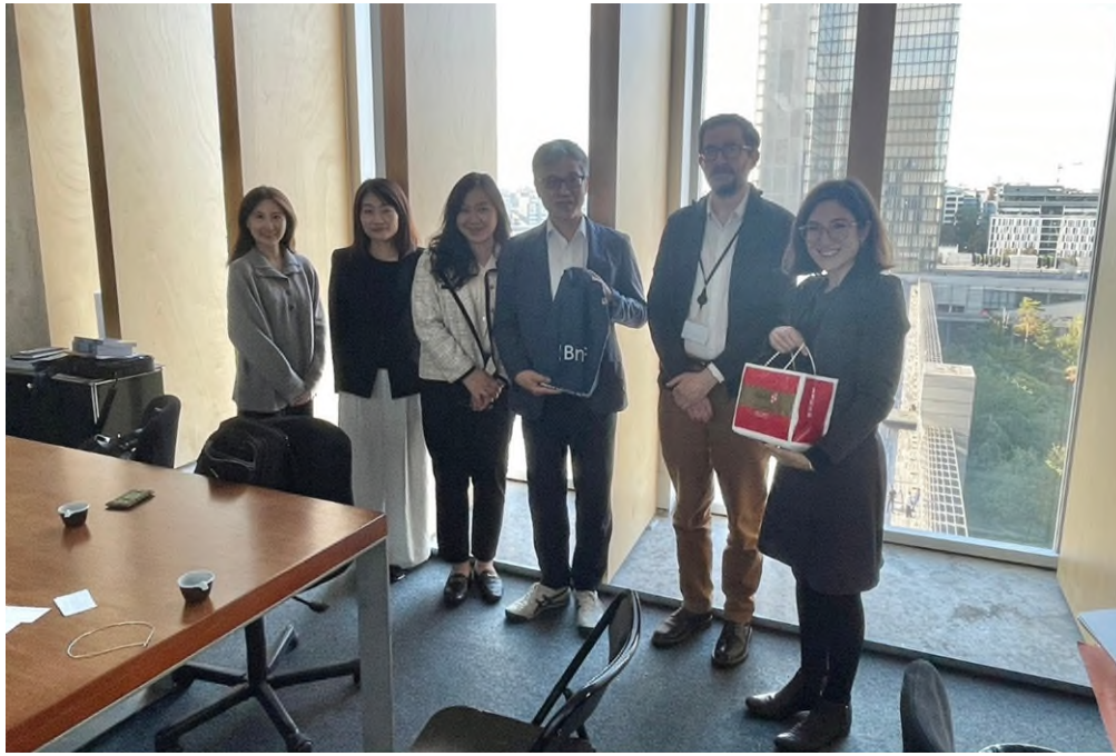
圖二、參訪法國國家圖書館