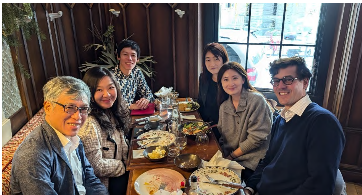
圖一、與法國高等社科院副校長 Leopoldo Iribarren 合影