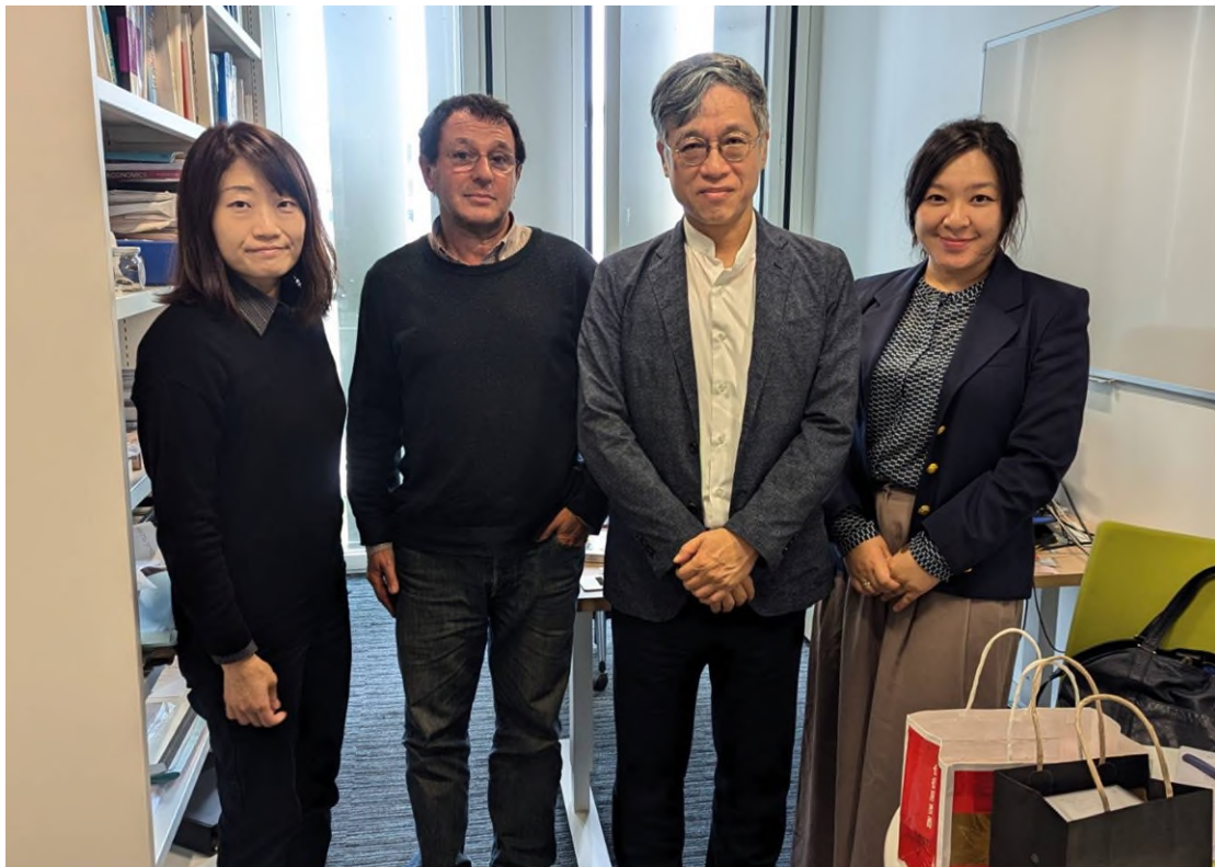
圖四、參訪巴黎經濟學院

目前巴黎經濟學院內雖無專責於臺灣或區域研究的學者，該校對於未來與臺灣學者的學術交流與合作機會持開放態度。Rapoport 教授表示，若國科會希望促進雙方合作，可以安排與巴黎經濟學院董事長會面，以討論更具體的合作模式和計畫方向。