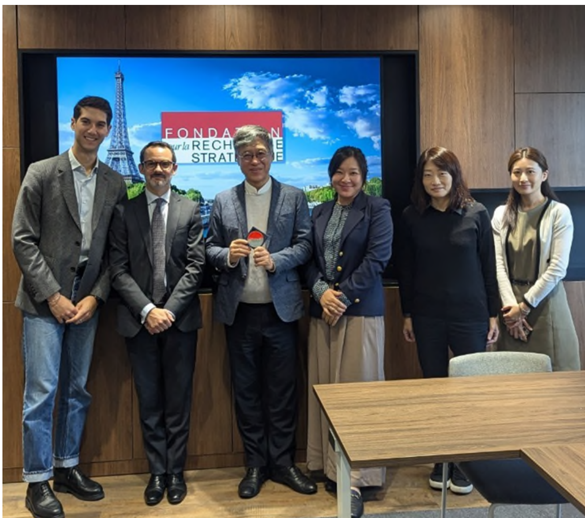
圖三、參訪戰略研究基金會

需求之情況下，實現臺灣講座計畫在法國的進一步推廣，並提升國際學術界對臺灣研究的關注。