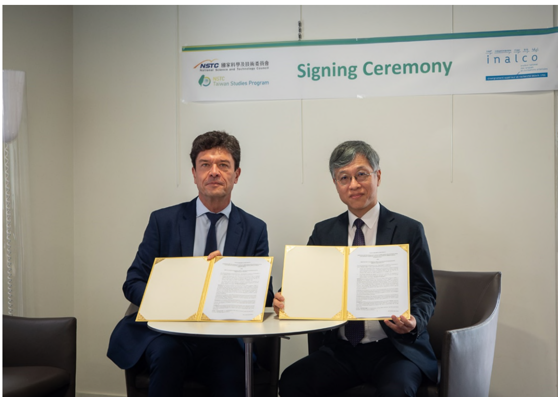
圖六、雙方合約簽署