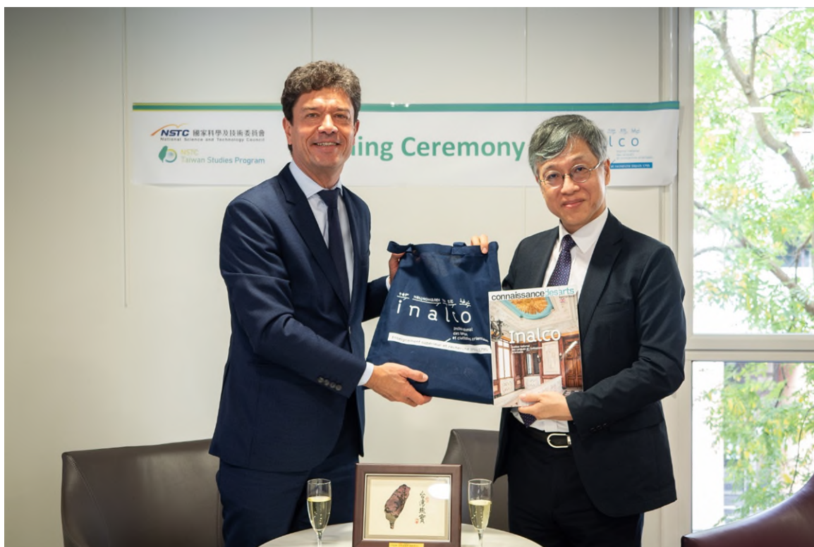
圖七、雙方互贈禮品