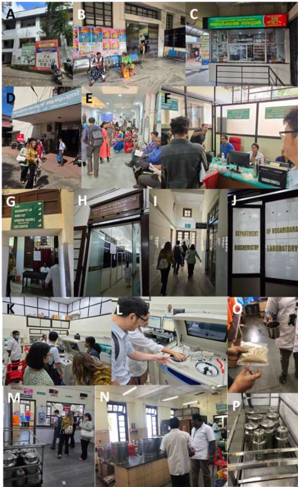
圖四、政府阿育吠陀醫學院和醫院 (Government Ayurveda Medical College and Hospital, Trivandrum)。停車場 (A)；眼科門診 (B)；付費藥局 (C)；醫院 (D 和 E)；口腔牙科門診 (F)；往醫學、臨床病理系所的通道 (G-J)；生化實驗室 (K 和 L)；阿育吠陀藥局與配藥室 (M 和 N)；以及配藥室配置的藥粉、藥油和膳食 (O 和 P)。