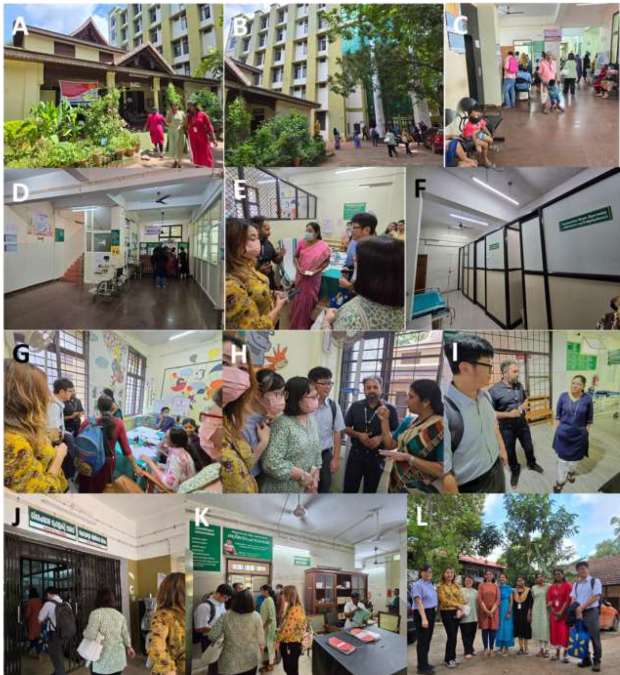
圖一、政府阿育吠陀學院婦幼醫院（Government Ayurveda College Hospital for Women and Children）。主管辦公室（A）；醫院（B）；病患等候區（C）；繳費區（D）；婦產科門診（E）；治療室（F）；兒科門診（G 和 H）；婦產科主任在二樓產房與手術室前介紹設備（I）；淨化療法（Panchakarma）病房（J）；淨化療法（Panchakarma）診療室（K）；以及我們離開前與醫院實習醫生們的合影（L）。

及淨化療法（Panchakarma）。我們在淨化療法診療室（如圖一 K）裡，看到正在接受熱油階段治療的小兒麻痺病童，治療師將加熱後的藥油塗抹在腿部（受疾病影響的部位和身體周圍區域）進行藥油按摩，反覆塗抹與按摩約一小時（因病患隱私權無法拍照），該病童須長期定時回診。