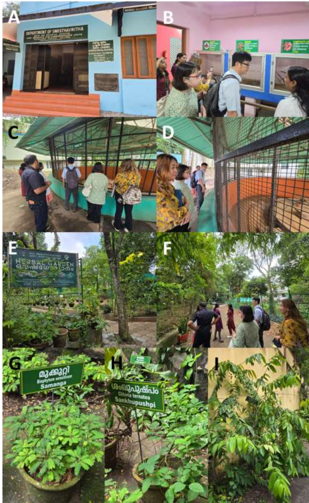
圖三、政府阿育吠陀學院（Government Ayurveda College）。毒理學系（Department of Agadatantra）（A）；蛇館和飼養蛇的圍場（B–D）；藥用植物園（E 和 F）；以及阿育吠陀藥用植物：羞禮花 [Samanga，學名為 Biophytum sensitivum (L.) DC.] G)、蝶豆（Sankhpushpi，學名為 Clitoria ternatea L.）（H）和 Sveta kutaja 又稱為 Stri kutaja [沒有中文名，學名為 Wrightia tinctorial (Roxb.) R. Br.]（I）。