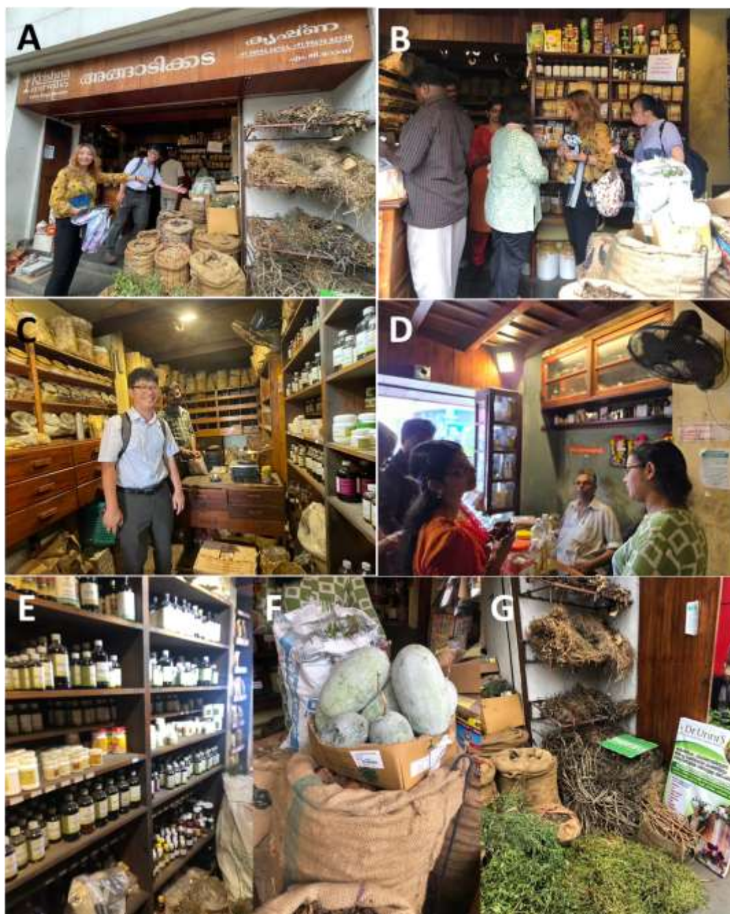
圖六、當地阿育吠陀傳統藥房。藥房外觀（A）；藥房人員諮詢與介紹（B）；整個櫥櫃的傳統藥材（C）；藥房的阿育吠陀醫/藥師（D）；瓶瓶罐罐的常用複方水藥/水萃物（E）；以及新鮮的阿育吠陀藥材（F和G）。

下午參訪柯欽市區的當地阿育吠陀傳統藥房，街上分散不少間阿育吠陀傳統藥房和現代藥局，印度的傳統藥房都非常相似，但販售的物品像台灣傳統中藥房跟草藥店的結合，有乾藥材、新鮮藥用植物與整櫃的常用複方藥丸、藥膏跟水萃物（如圖六）。