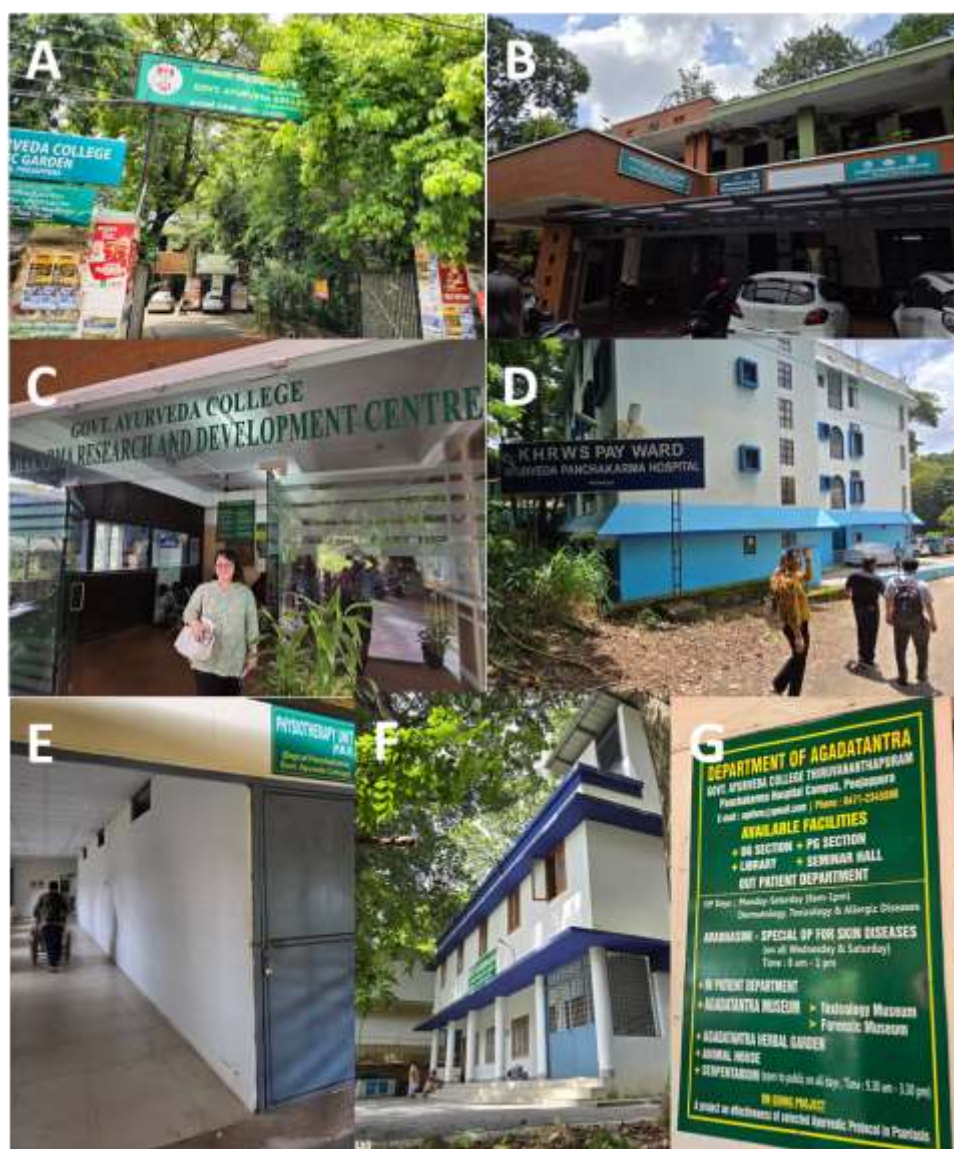
圖二、政府阿育吠陀學院（Government Ayurveda College）。學院大門入口（A）；老人中心（B）；淨化療法研究與發展中心（Panchakarma Research and Development Centre）（C）；阿育吠陀淨化療法醫院（Ayurveda Panchakarma Hospital）（D）；物理治療門診（E）；瑜珈訓練中心（Yoga Training Centre）（F）；以及毒理學系（Agada Tantra）包含的設施標示看板（G）。

接著參訪的是鄰近的政府阿育吠陀學院（Government Ayurveda College），這院區設有社會與預防醫學系（Swasthavritha）和毒理學系（Agada Tantra）。社會與預防醫學系（Swasthavritha）提供預防醫學、社會醫學、瑜珈、自然療法、阿育吠陀營養學和營養學等課程，附設淨化療法研究與發展中心（Panchakarma Research and Development Centre）、阿育吠陀淨化療法醫院（Ayurveda Panchakarma Hospital）其內設有物理治療門診（Physiotherapy Unit）、老人中心（Geriatric Centre）以及瑜珈訓練中心（Yoga Training Centre），提供基於阿育吠陀和瑜珈的預防性醫療保健服務，特別是針對生活上的障礙（如圖二）。