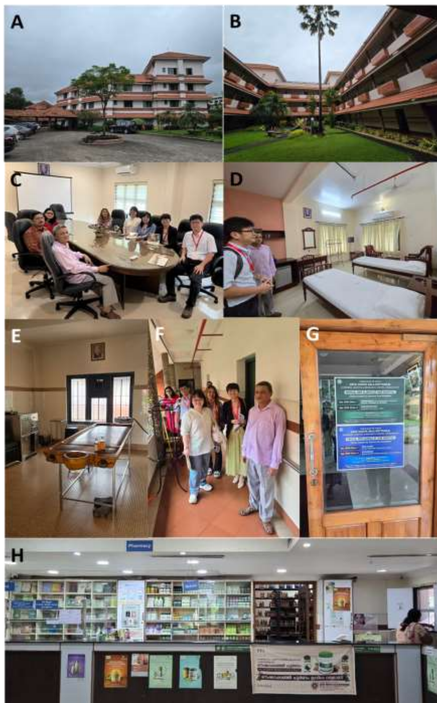
圖十一、Arya Vaidya Sala Kottakkal 阿育吠陀醫療研究中心（醫療養生村）。該機構外觀（A）；該機構中庭（B）院方在會議室進行介紹簡報（C）；參訪病房與醫療診間（D-F）；醫院看診科目（G）；醫院附設藥局（F）。