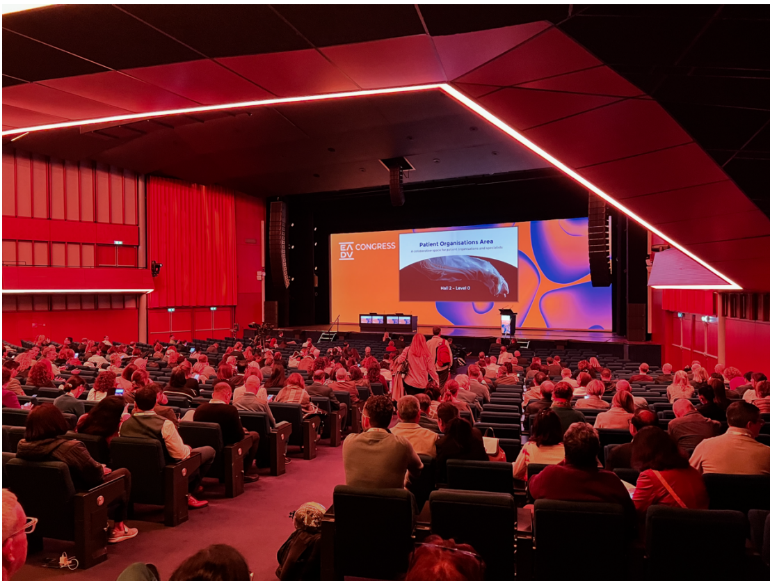
<Plenary session 由頂尖學者演講，場內座無虛席>