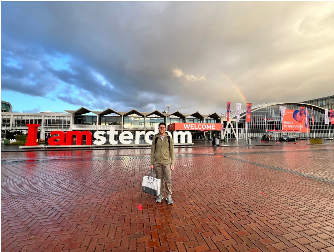
<2024 EADV Congress 會場在阿姆斯特丹的 RAI Amsterdam>