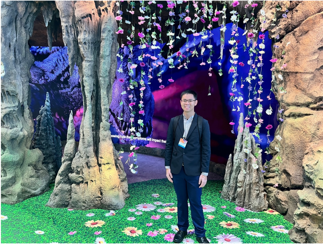
<廠商攤位佈置輝煌，此為 Boehringer Ingelheim 廠商攤位，spesolimab 為 generalized pustular psoriasis 的新治療 >