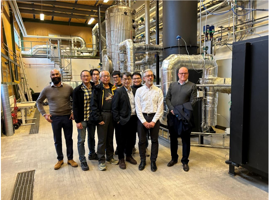
圖 2 瑞典 Studsvik 場址參訪合照