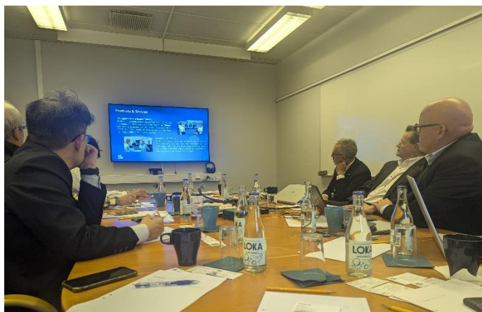
圖 5 與 Studsvik 及 Uniper 專家與會交流

Studsvik 金屬熔煉處理場提供一套完整的熔煉程序，首先對低放射性廢金屬執行初步量測，分類污染程度，再經由噴砂除污移除表面污染後(移除 Co-60 為主)，將除污後的廢金屬與乾淨金屬混合熔煉，達到 Co-60 活度小於 1 Bq/g 的目標值，藉由熔煉可將放射性核種與金屬母材分離，鈾、鈾、鎂等核種會累積至熔渣中，另藉由廢氣系統可分離移除 Cs-137，最終以達成解除管制之目標。