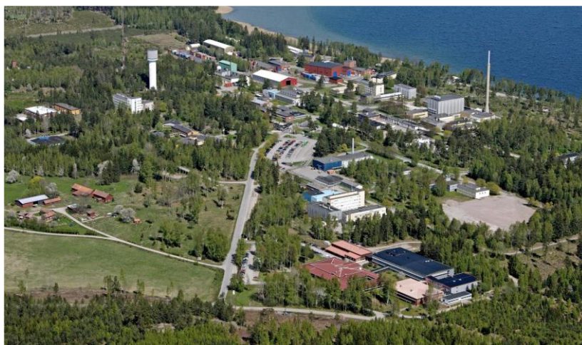
圖 1 瑞典 Studsvik 場址

本次即為參訪瑞典 Studsvik 場址，如圖 2，主要安排參觀新建置的 inDRUM 廢棄物處理示範設施，了解其用途及處理成果，同時在其邀約下與 Uniper 公司的專家一同與會交流。本小節將分為「inDRUM 技術與其處理示範設施」與「Studsvik/Uniper 專家交流內容」。