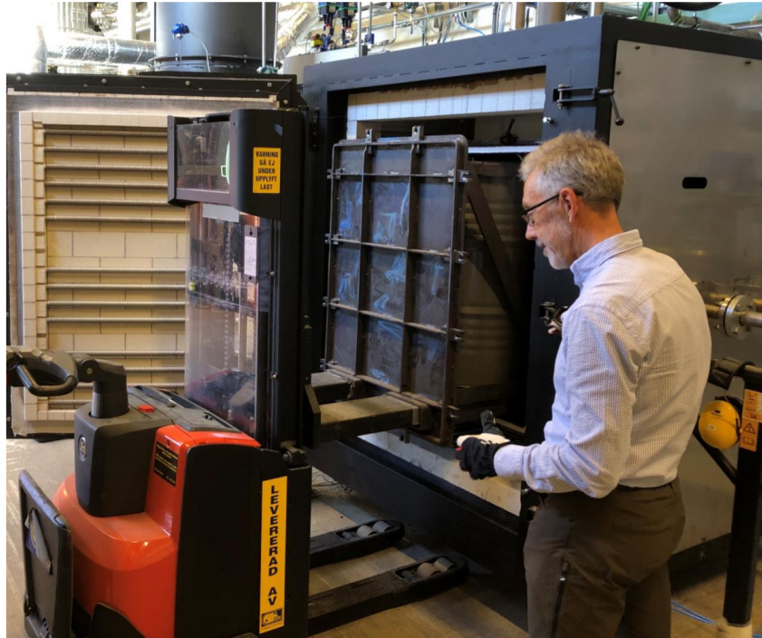
圖 4 廢棄物整桶置入 inDRUM 處理單元