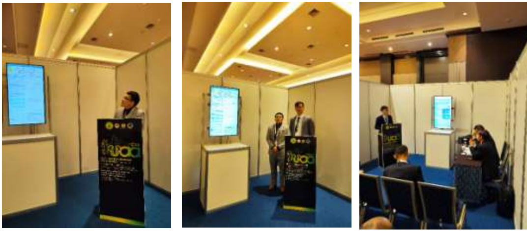
本院住院醫師口頭發表論文