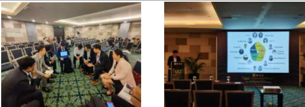
Young Leadership Program—小組討論及成果報告