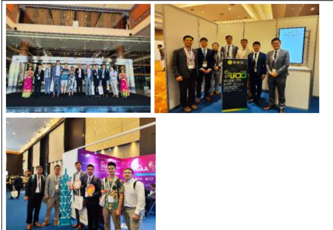
台灣醫師群及印度醫師合影；2025 UAA 輪到台灣主辦(台灣攤位)