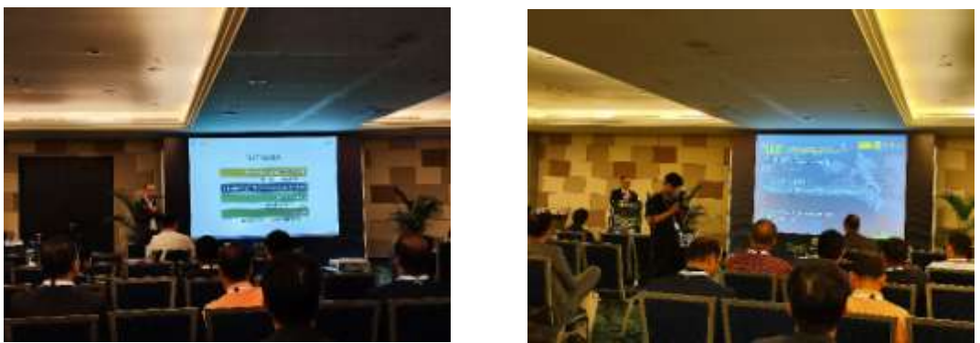
Young Leadership Program