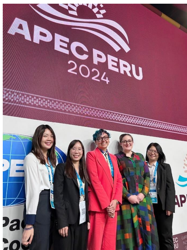
我國代表團與 PPWE 主席 Chantelle Stratford (右 2)、智利婦女與性別平等部國際事務處處長 Anita Peña Saavedra(中)合影