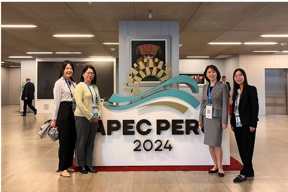
我國代表團與韓國代表－性別平等與家庭部國際合作處處長 Lee Jin-hee (右 2)合影