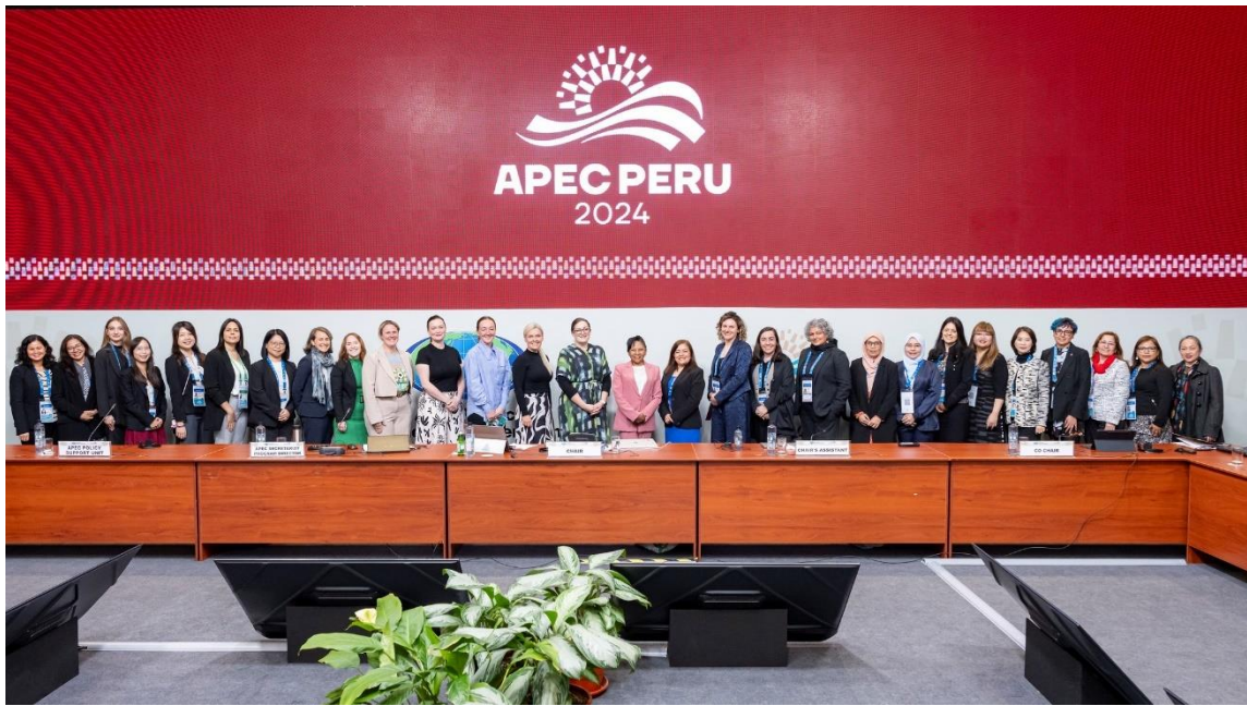
參與 PPWE2 之經濟體代表合照