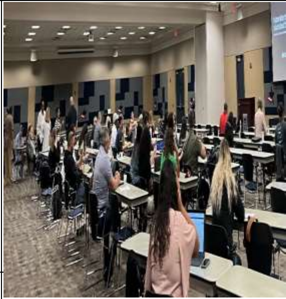
中場休息時間，在場與會人員包含聯邦、州、地方執法官員、學者專家、民間團體及外國政府代表等人員。