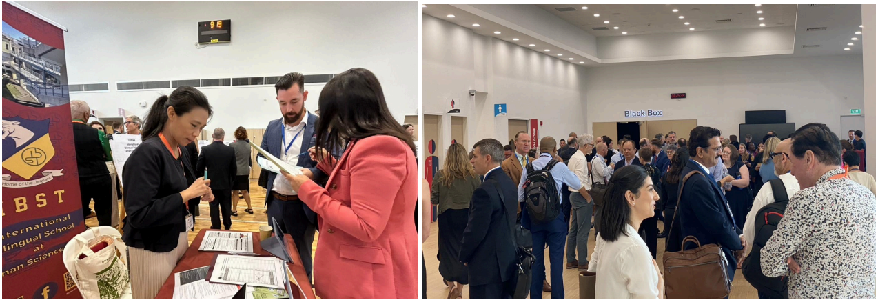
圖二：應聘教師於會場洽詢符合專長職缺/博覽會現場之眾多應聘教師