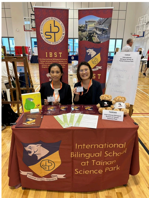
圖一：會場完成設置後合影