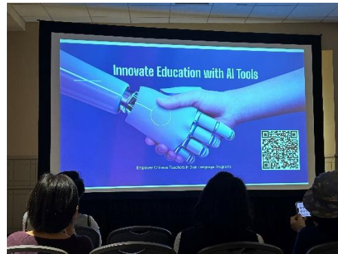
出席 2024 年 ACTFL 年會工作坊情形