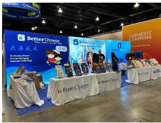
2024 年 ACTFL 年會現場其他展攤情形