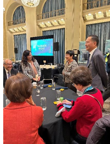
出席「臺灣之夜 (Taiwan Night)」情形