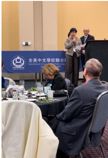
出席 2024 年 ACTFL 年會全美中文學校聯合總會專題午餐會情形