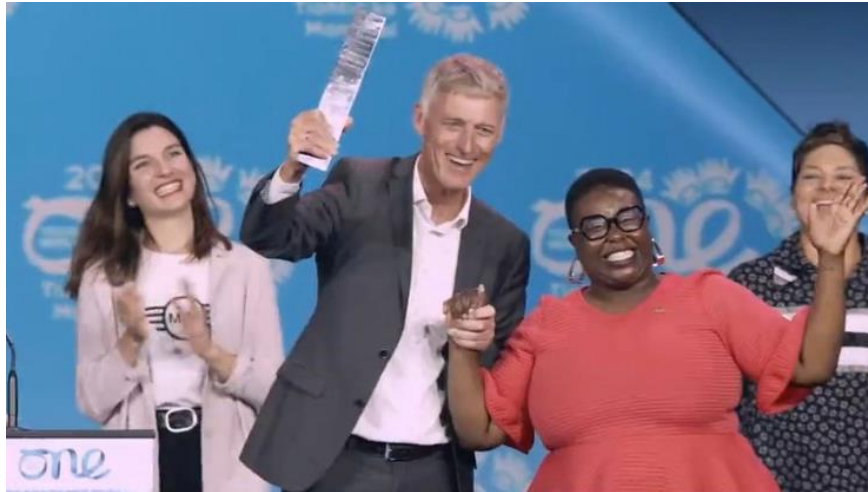
主辦城市交接給 2025 年主辦城市慕尼黑。