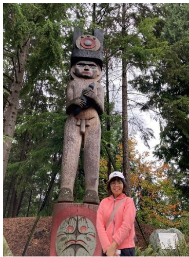
MOA 博物館入口木雕「Welcome Good People」。

MOA 所在位置即為 Musqueam 族的傳統領域，博物館入口旁有件木雕由北美洲西北海岸 Musqueam 族藝術家 Susan Point 製作，名為「Welcome Good People」。木雕人像在創作上結合了 Musqueam 的文化，例如人像抱著能夠帶來正面或負面力量的食魚貂；木雕基座上雕刻的敞開手掌圖案，則有歡迎從全世界各地來訪的觀眾的意涵。