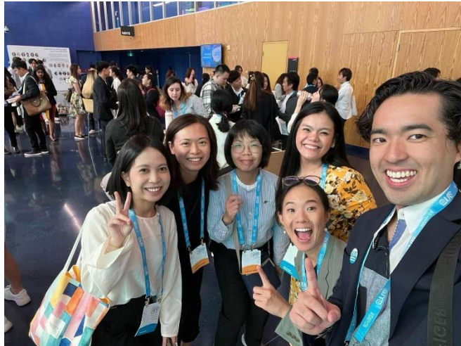
分區青年領袖聯結活動與亞洲區青年代表交流。