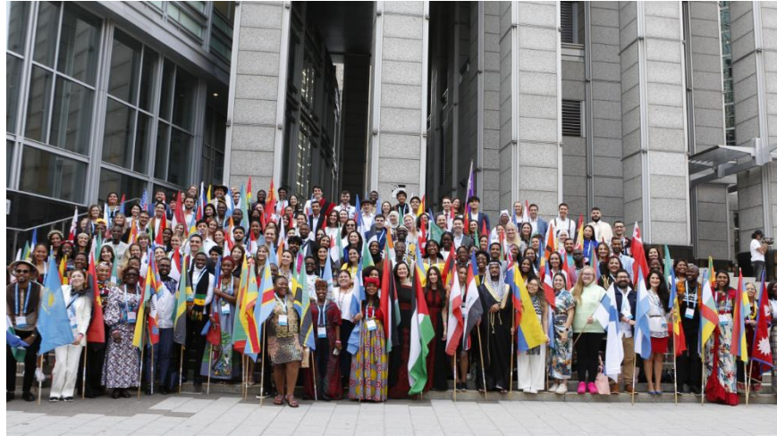
高峰會匯聚來自世界各地的青年領袖。