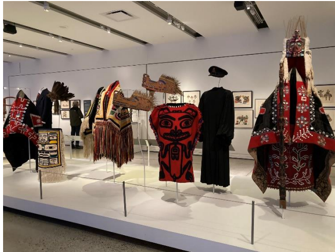
MOA 博物館展出 To Be Seen, To Be Heard 特展。