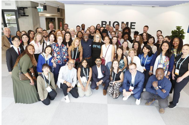
合作夥伴專屬交流活動。