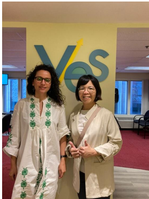
YES Montreal 提供就業服務、創業服務及藝術家服務。

YES Montreal 就業服務團隊在 2024 年新推出「透過教育促進就業準備和職業發展」計畫 (CREATE)，為青年提供 12 週的就業能力及技能培訓。此外，也推出了「資源、就業和職業幫助」計畫 (REACH)，透過一系列的服務，包括專業互動式小組會議和一對一職業諮詢，為求職者提供支持。該機構約有 178 位志工，過去一年共服務 3,220 人，17,632 人次，舉辦就業及創業相關研討會 973 場，6,705 人次參與，成功找到工作或重返校園進修的比例為 79%。