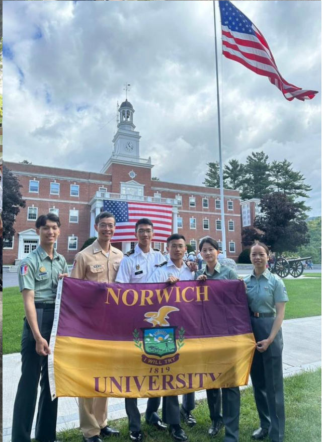
美國勞工節鎮上遊行活動