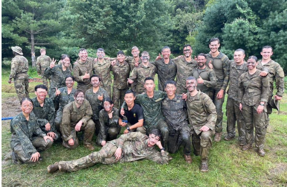
Dog River Run