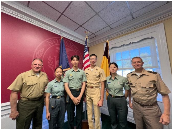
與威爾猛軍校校長、指揮官合影