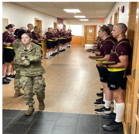
觀摩新生訓練片段