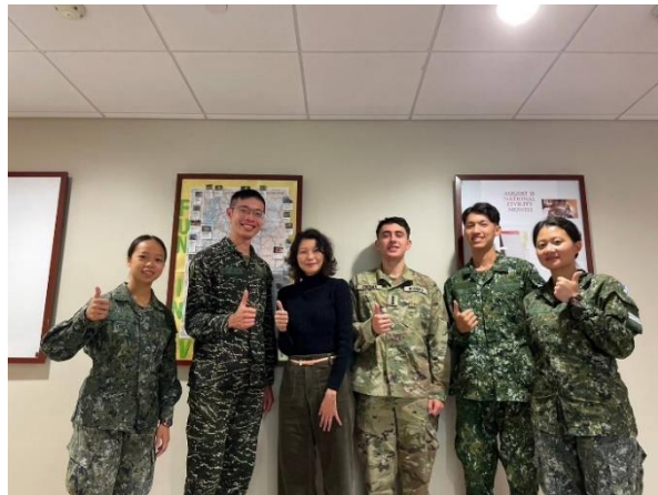
與國際教育處助理副校長合影