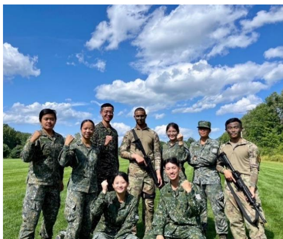
軍事技能演示 (Mil skill demonstrations)