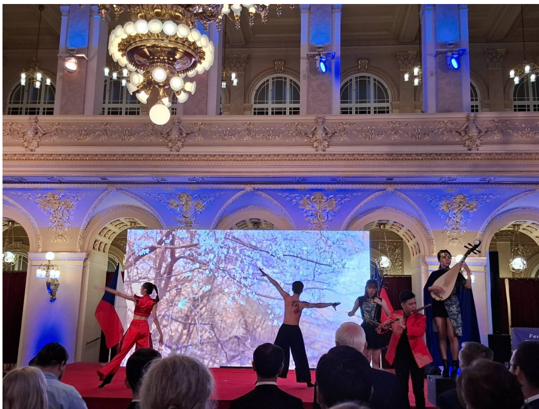
圖 1-1 現場演出片段