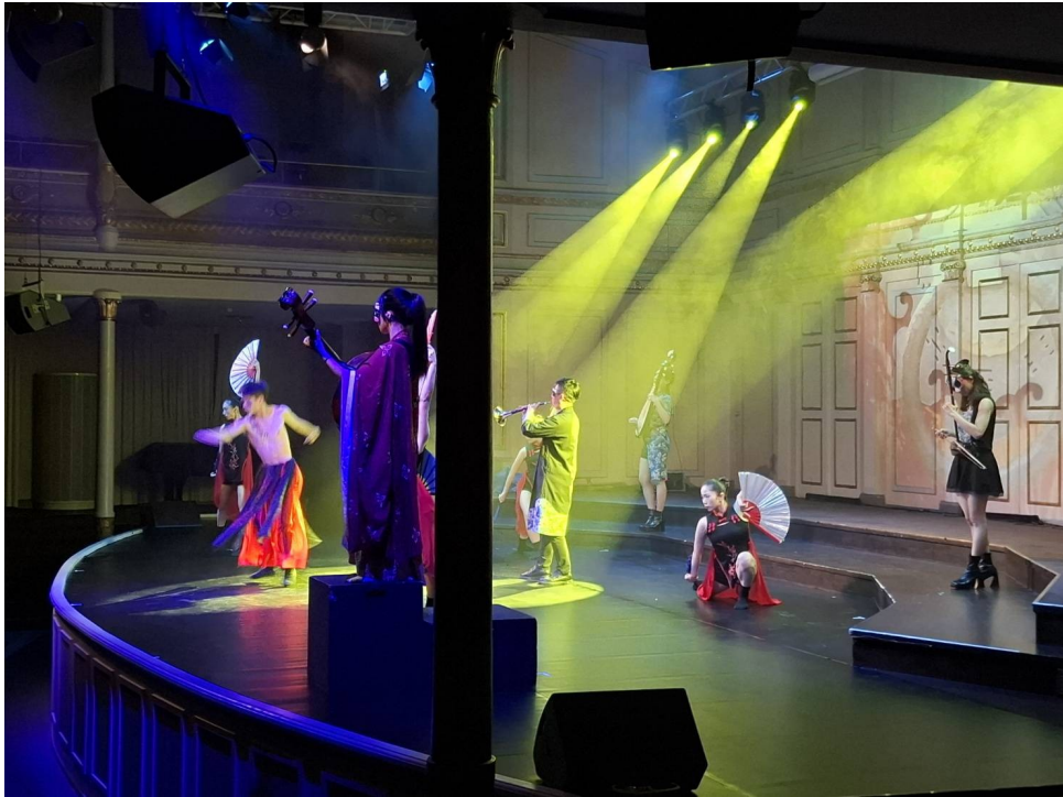
圖 6 現場演出片段