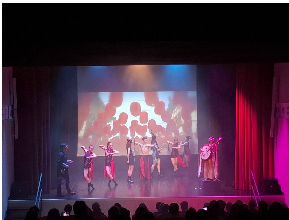
圖 4 現場演出片段