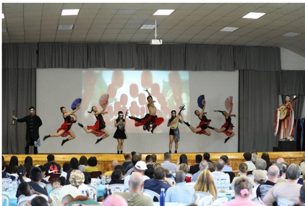
圖 10 現場演出片段