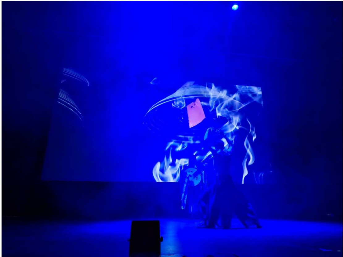
圖 2 現場演出片段