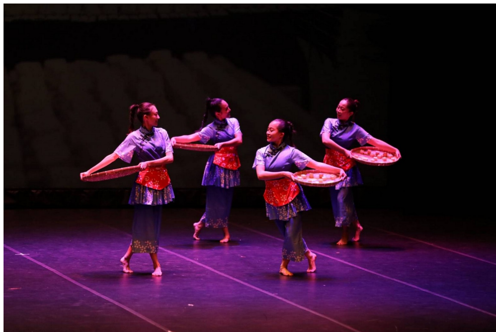
圖 8-1 現場演出片段