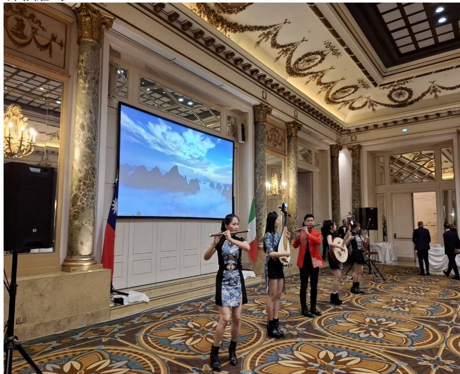
圖 5 現場演出片段