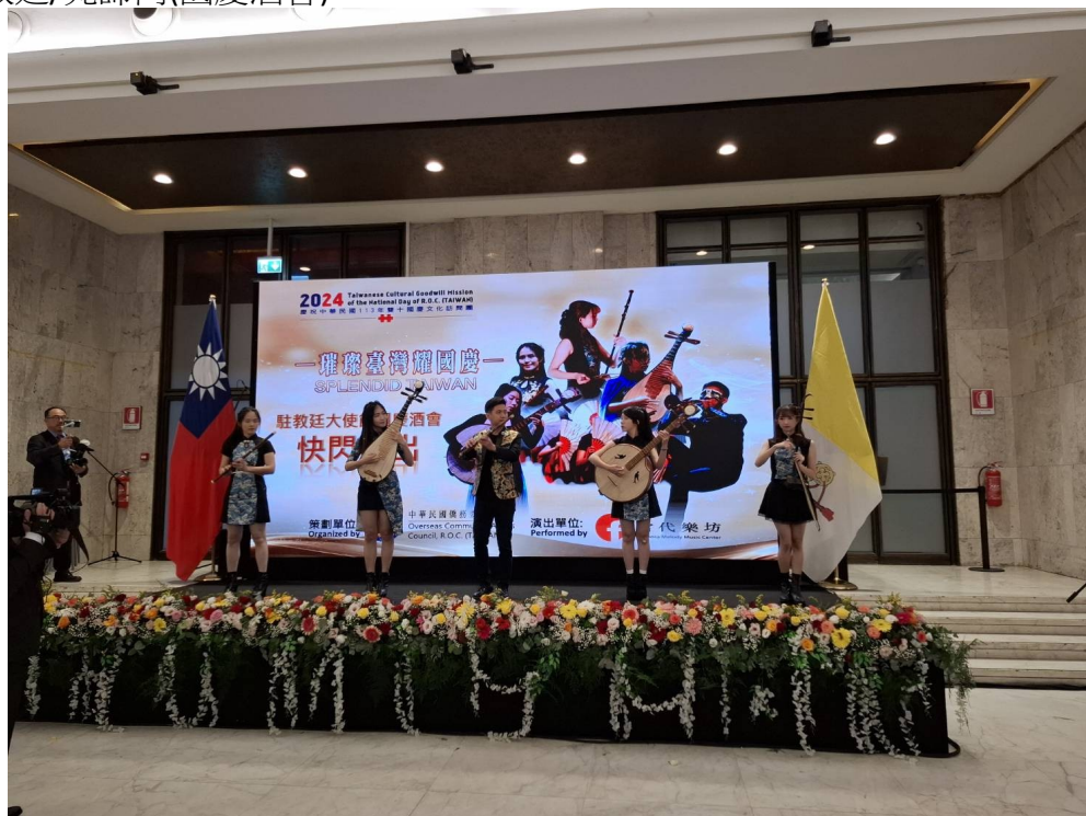
圖 3-1 現場演出片段