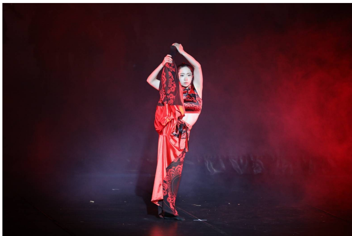
圖 11 現場演出片段