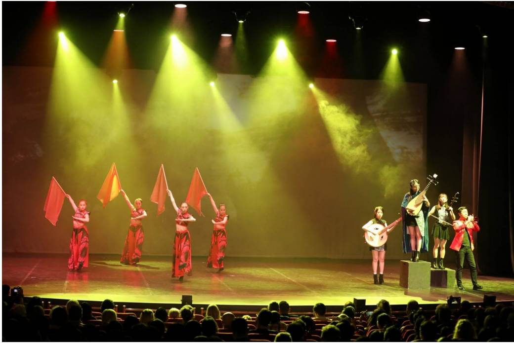
圖 12-1 現場演出片段