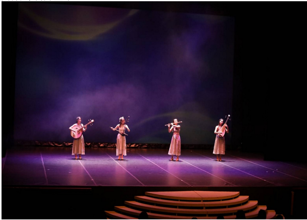
圖 9-1 現場演出片段