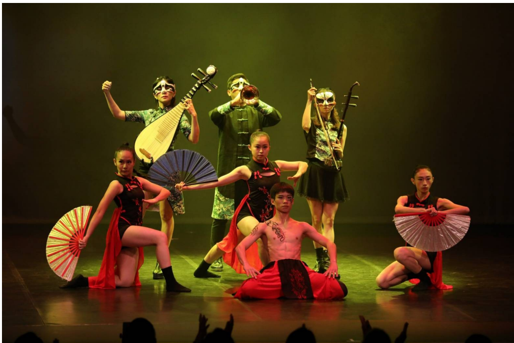
圖 12-2 現場演出片段