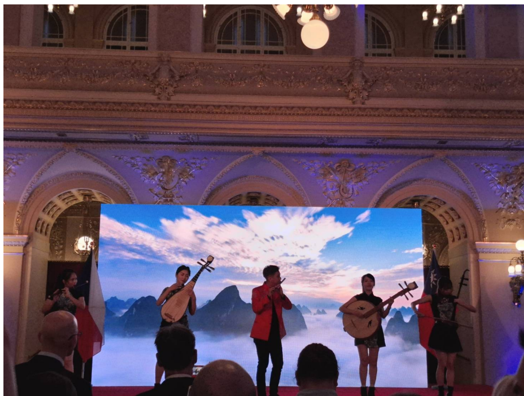
圖 1-2 現場演出片段