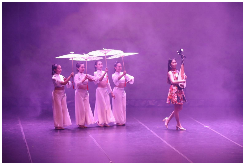
圖 9-2 現場演出片段