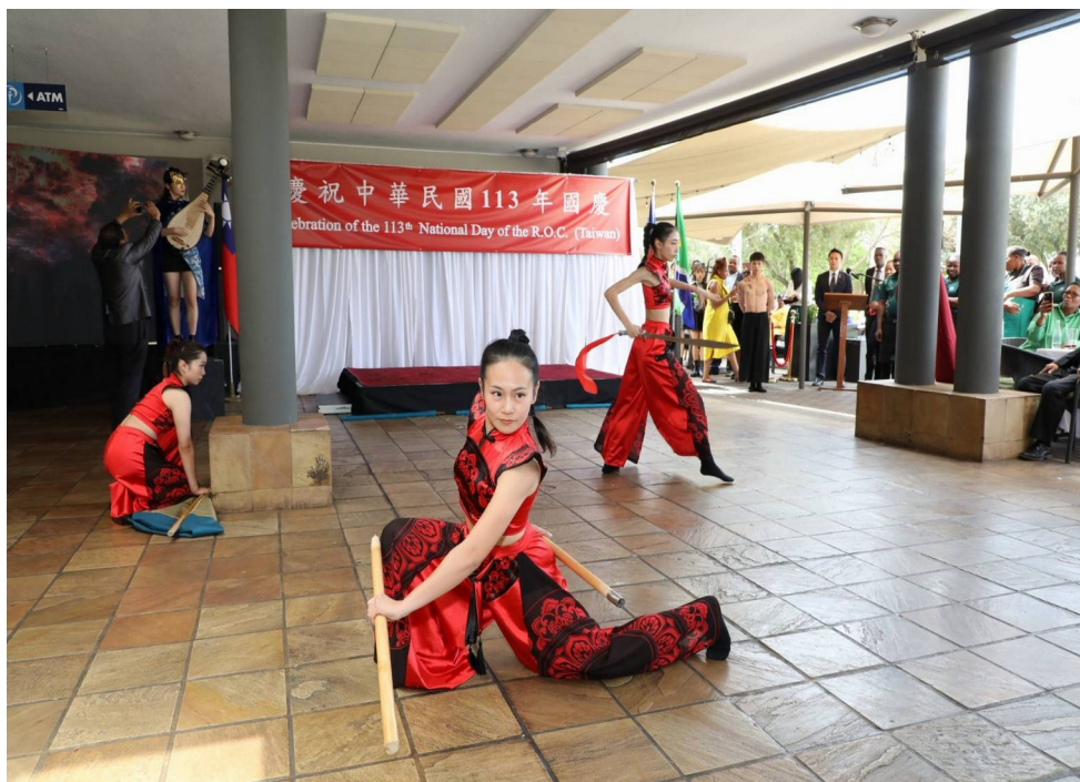
圖 7 現場演出片段