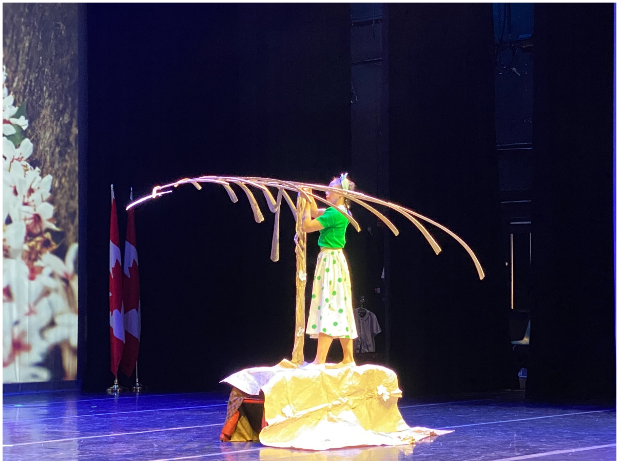
圖 4-1 現場演出片段