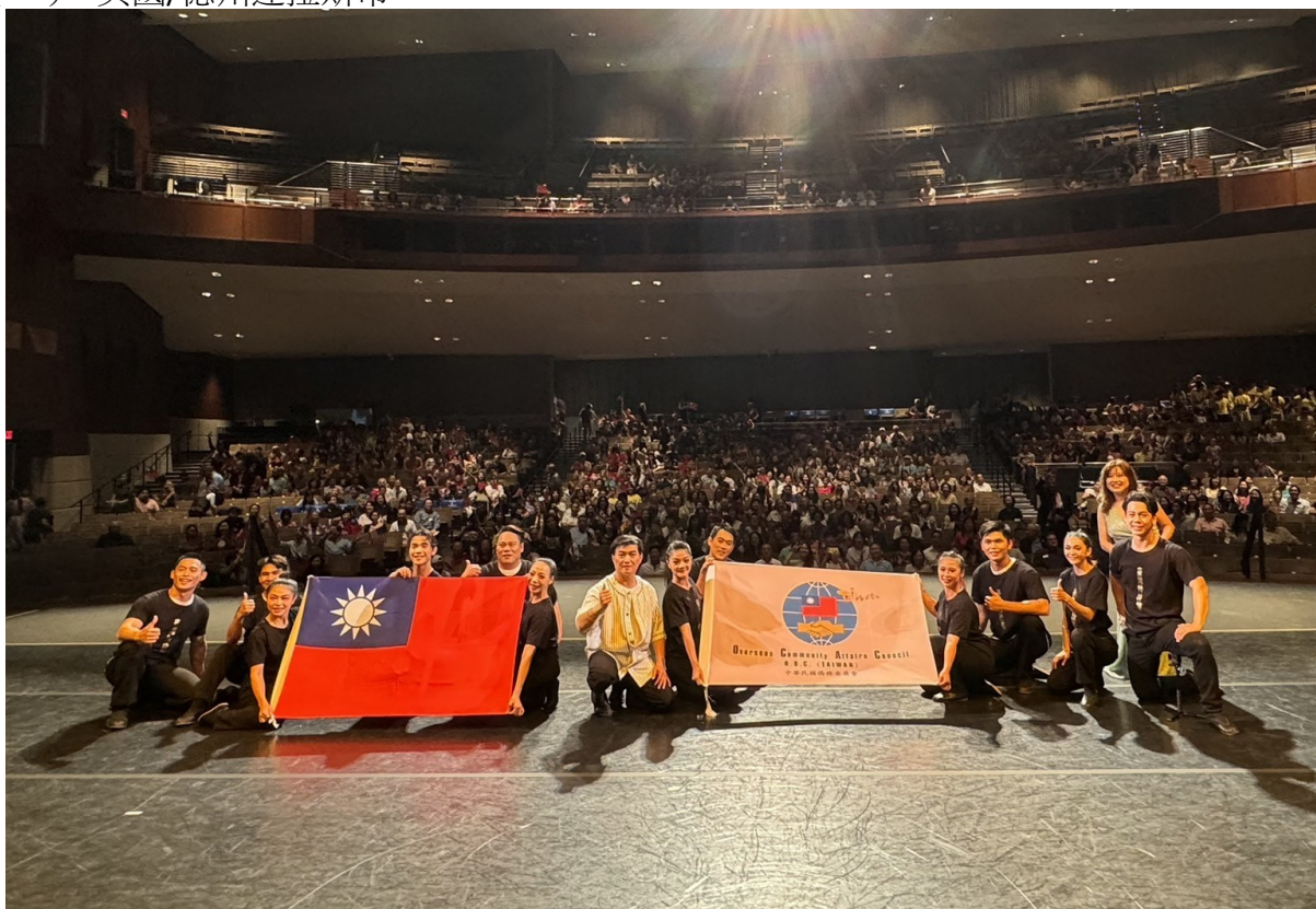
圖 1-1 表演團隊與現場 1,200 名觀眾合影