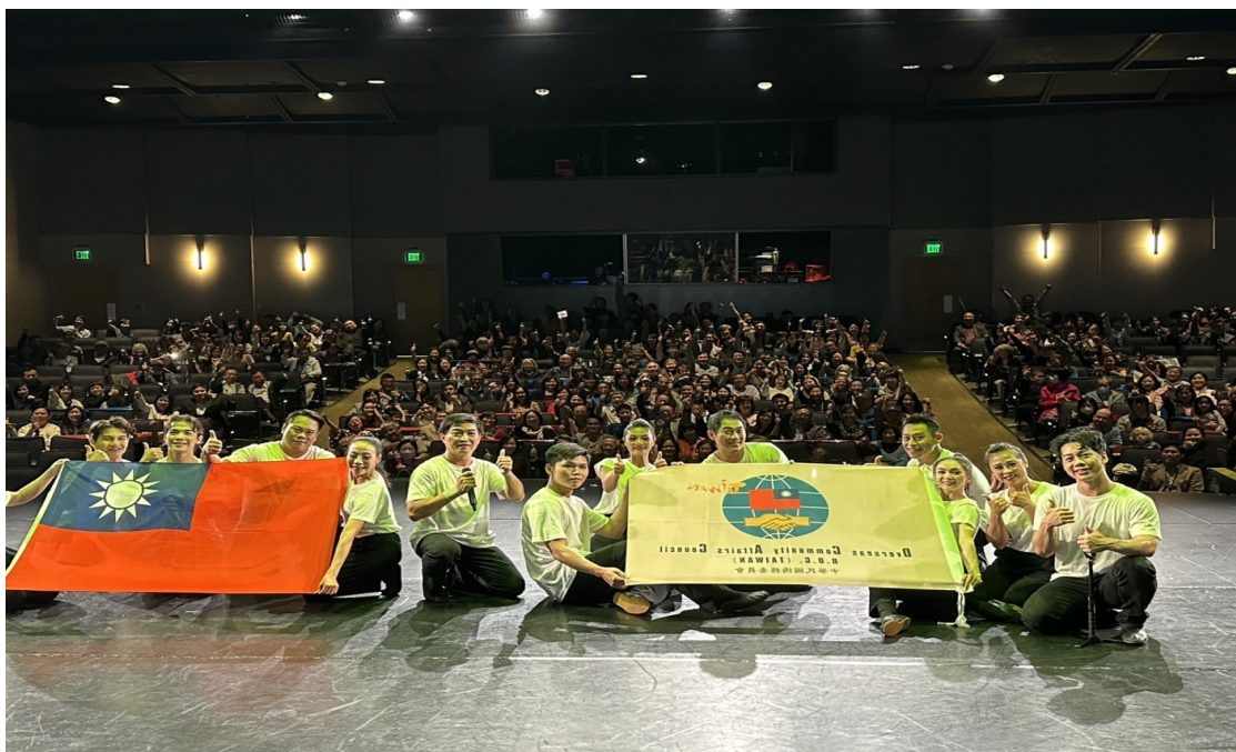
圖 3-1 訪團與現場觀眾合影