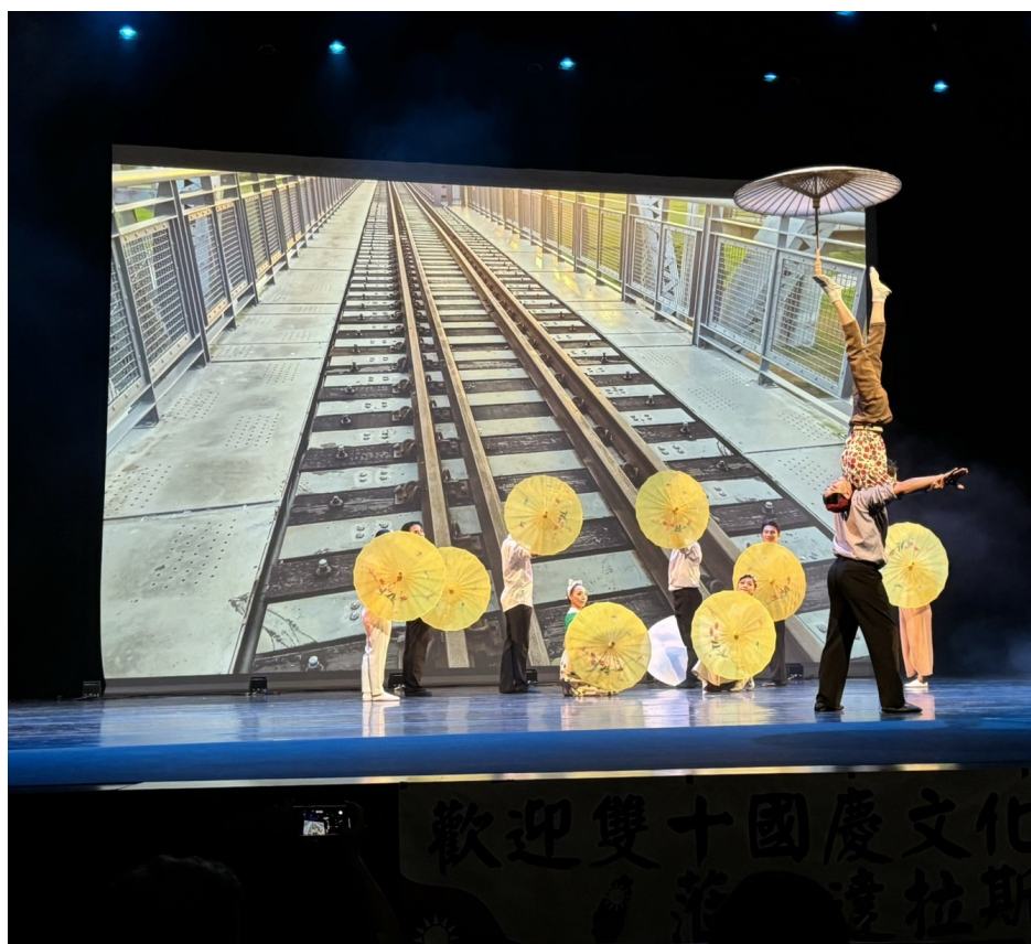
圖 1-2 現場演出片段