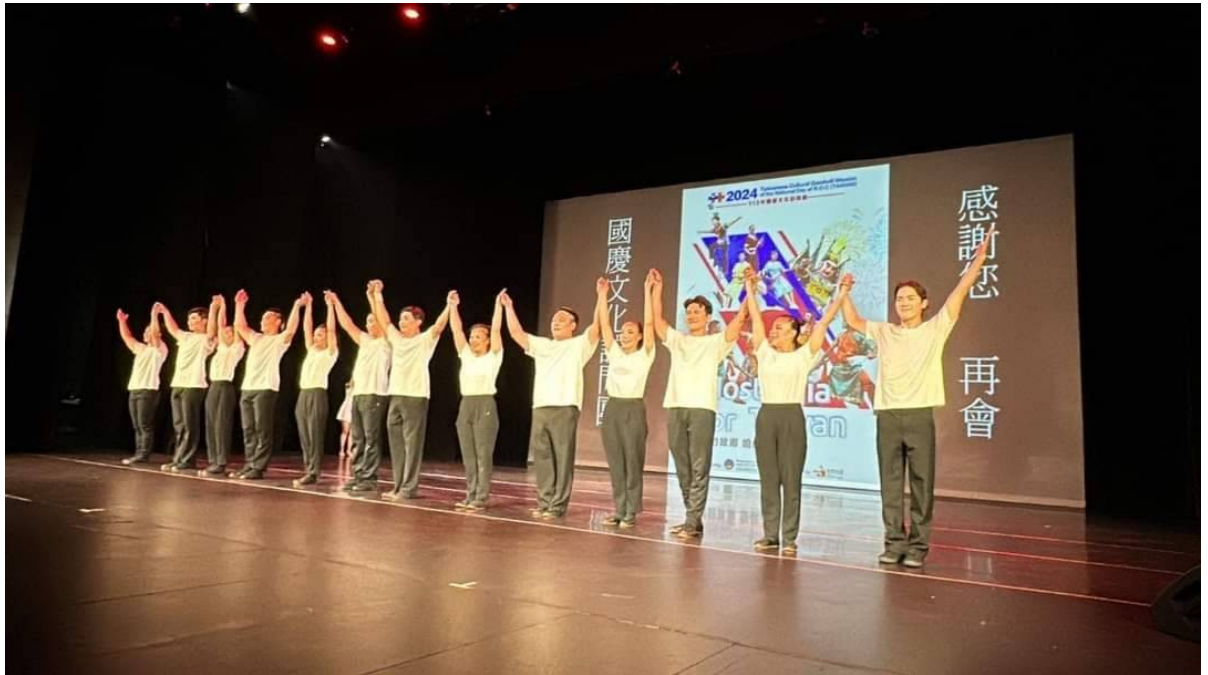
圖 3-1 文化訪問團謝幕