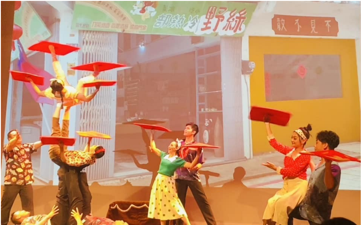
圖 2-2 現場演出片段