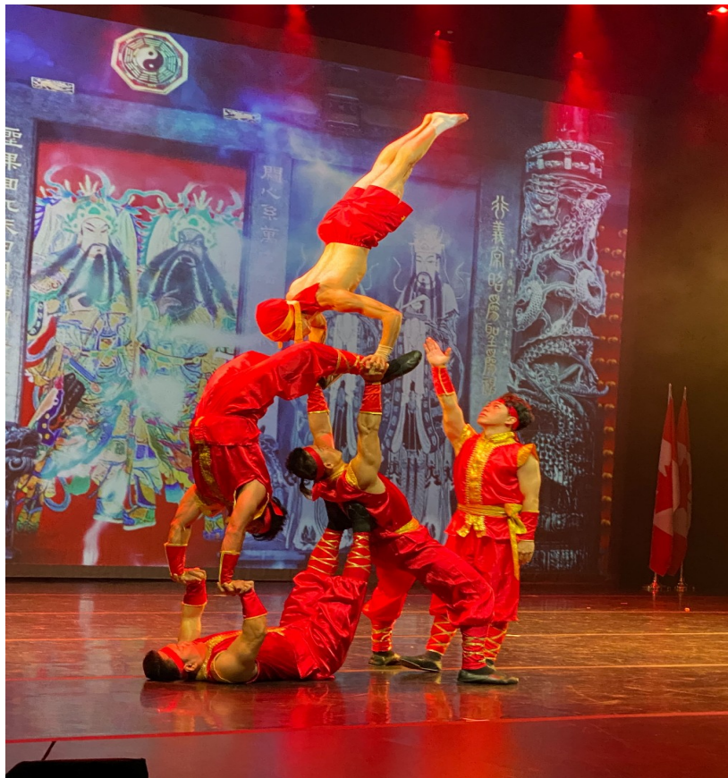
圖 4-3 現場演出片段