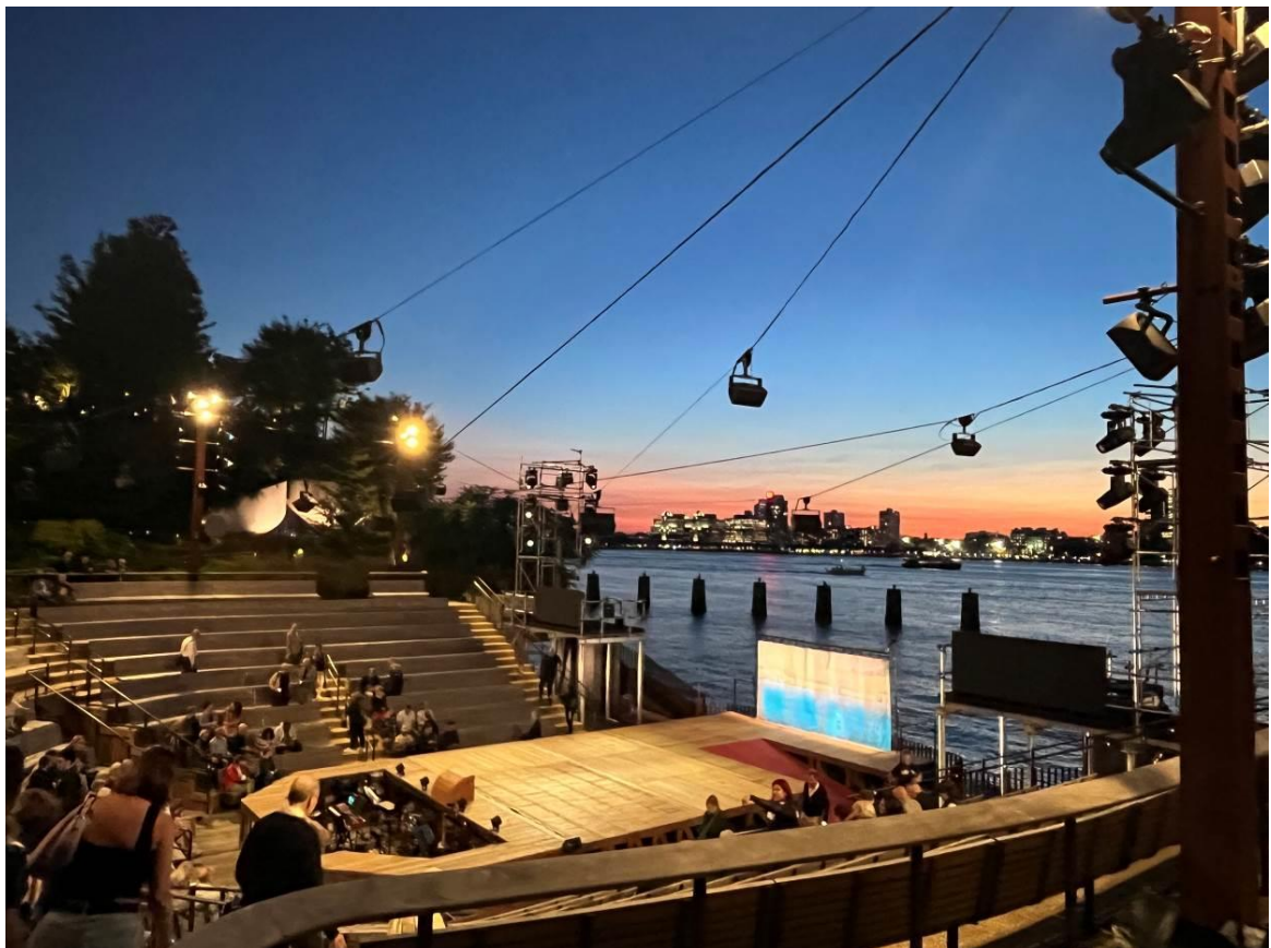
日落時開放觀眾陸續進場，舞台與觀眾席的距離非常緊密、樂池樂手也清晰可見。