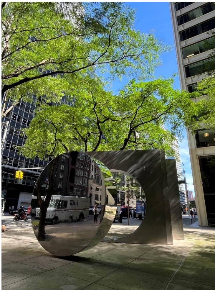
楊英風位於東方航運大樓前的公共藝術作品「東西門」

楊英風的公共藝術作品「東西門」（East West Gate）位於紐約市華爾街附近的東方航運大樓前 (88 pine street)，完成於 1973 年。「東西門」這件作品由兩個相對的門組成，分別代表東方和西方文化的交融。門的設計融合了中國傳統的建築元素和現代主義的簡潔風格，象徵著東西方文化的溝通和融合。