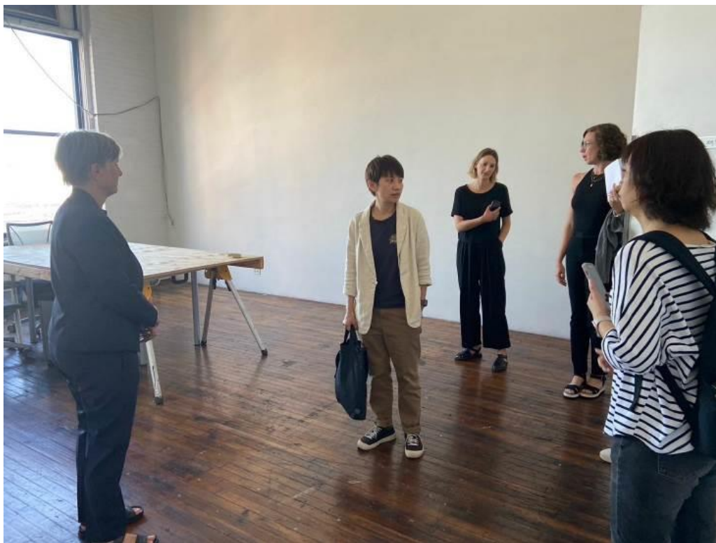
參觀 ISCP 工作室空間。