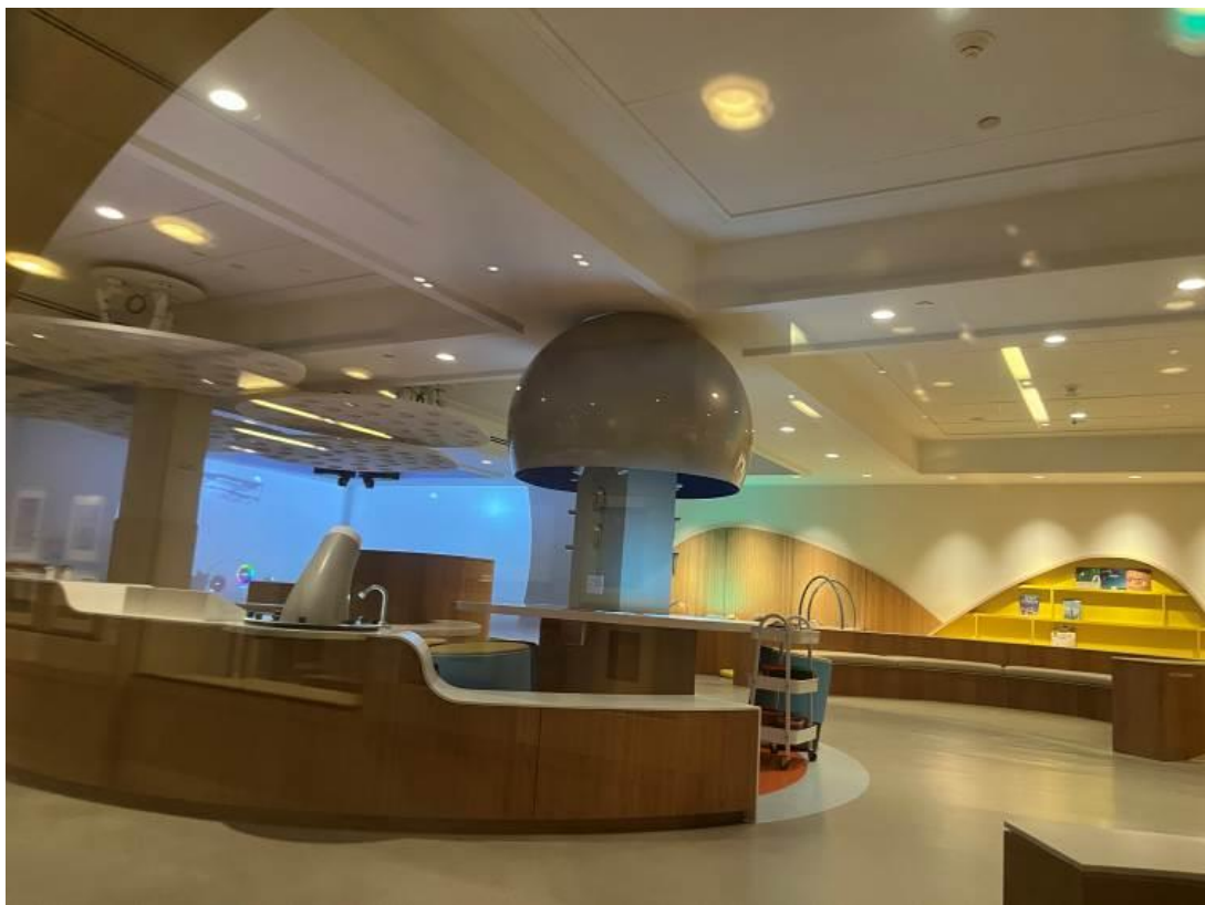
大都會博物館藝術教育空間。