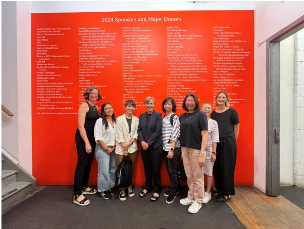
與 ISCP 國際藝術工作室主要工作成員於工作室合影留念。

(4) 因為紐約區的物價，ISCP 的收費相較其他藝術村較高，藝術村有持續在努力找到更多的贊助，但是依目前的情況來看，還是很難有所調整。