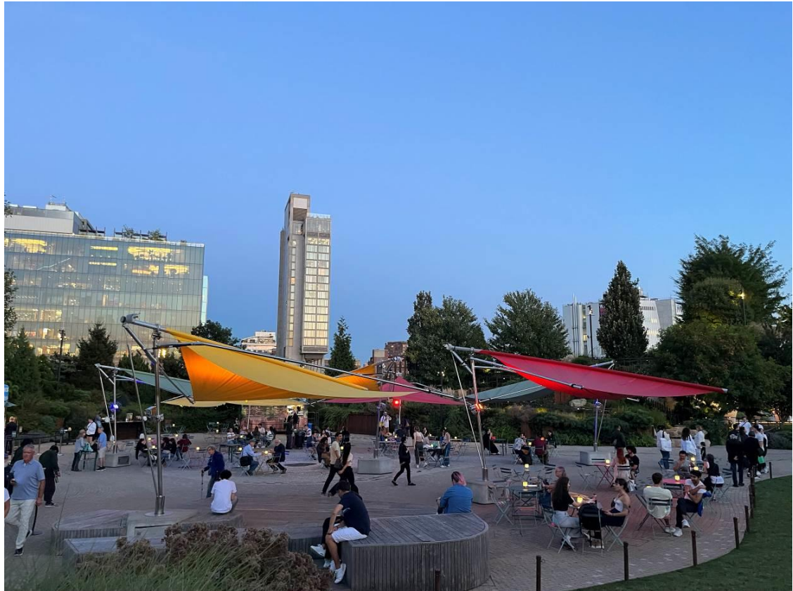
Little island 人造島的劇場空間外，是一個公園區域，進場前可以在這裡休憩。