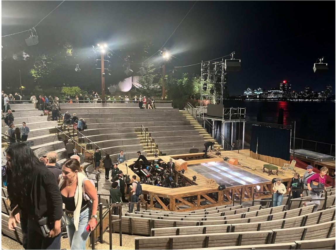
演出過程中，利用了許多舞台的小機關和巧思，演員表演功力深厚非常精彩。