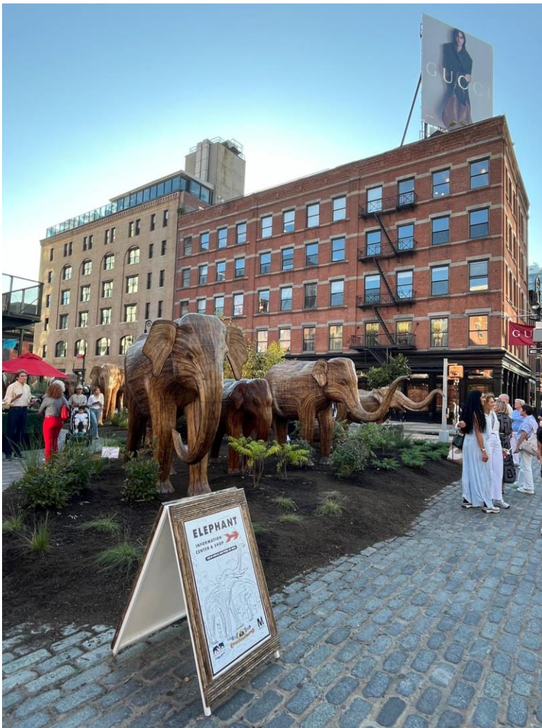
雀爾喜藝廊周邊街區，大型裝置藝術展覽，象群大遷徙《The Great Elephant Migration》。

雀爾喜市場周圍街道，正好在進行大規模的街頭裝置藝術，象群大遷徙《The Great Elephant Migration》有 100 頭大象，每一頭大象外表都不同，是創造者對照身處南印度的象群，一比一擬真打造。希望藉此提高人們對大象保護及生態環境的關注。展覽融合藝術與環保，透過互動體驗，讓觀眾了解大象面臨的威脅及其重要性。搭配各頭大象的展出，周圍佈滿泥土，特別的是這些泥土充滿了大象糞便的味道，讓所有路過的民眾無法忽略的看見身旁的大象。