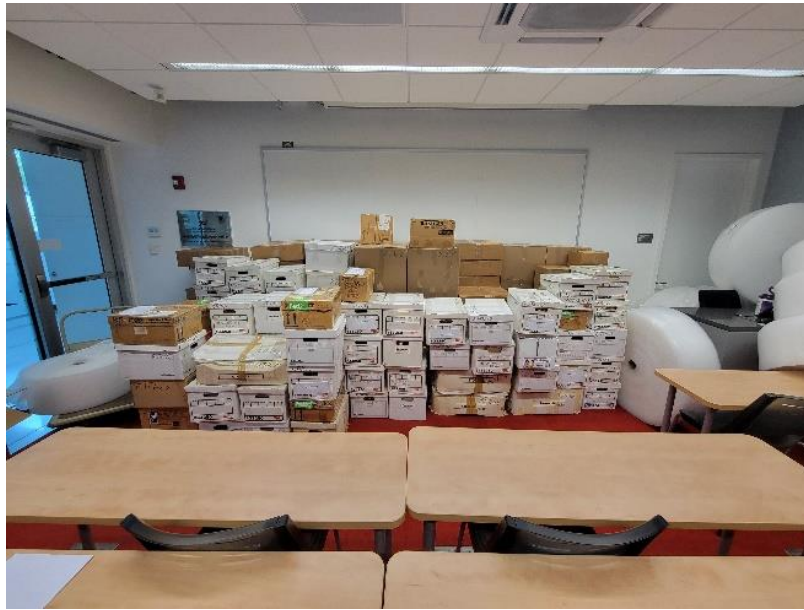
▲ 已封箱但尚未上貨櫃前暫放於學院會議室內