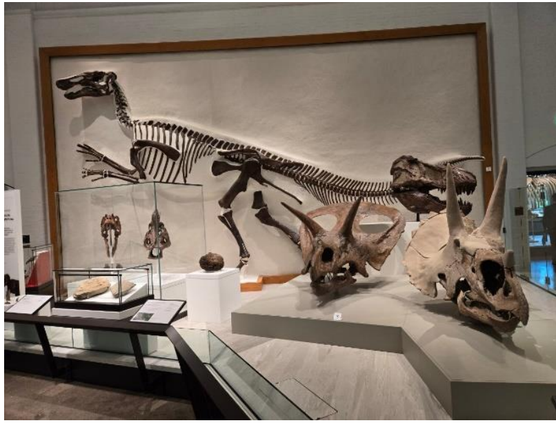
▲ Peabody Museum of Natural History 内展品