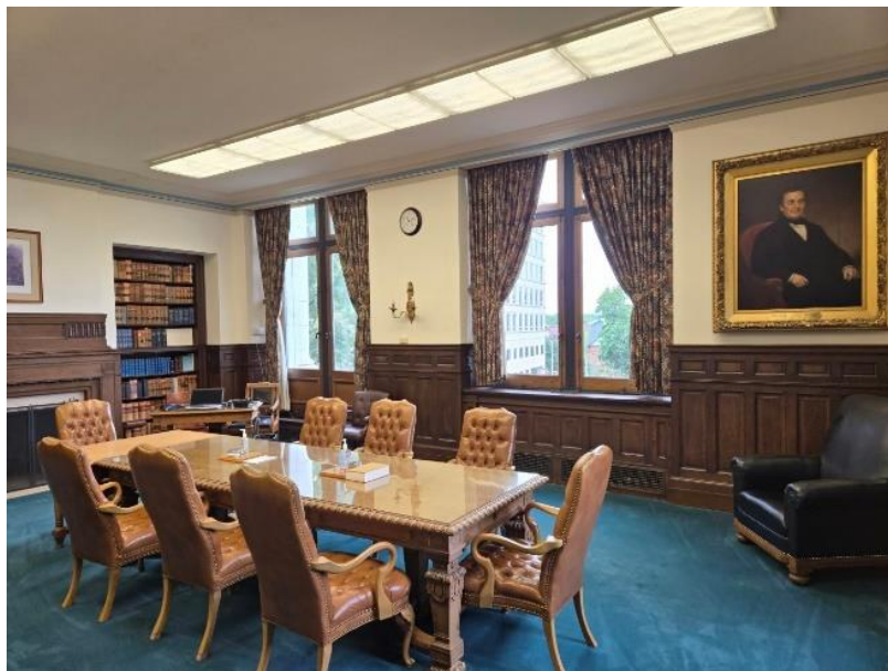
▲ Connecticut Supreme Court 內大法官休息室