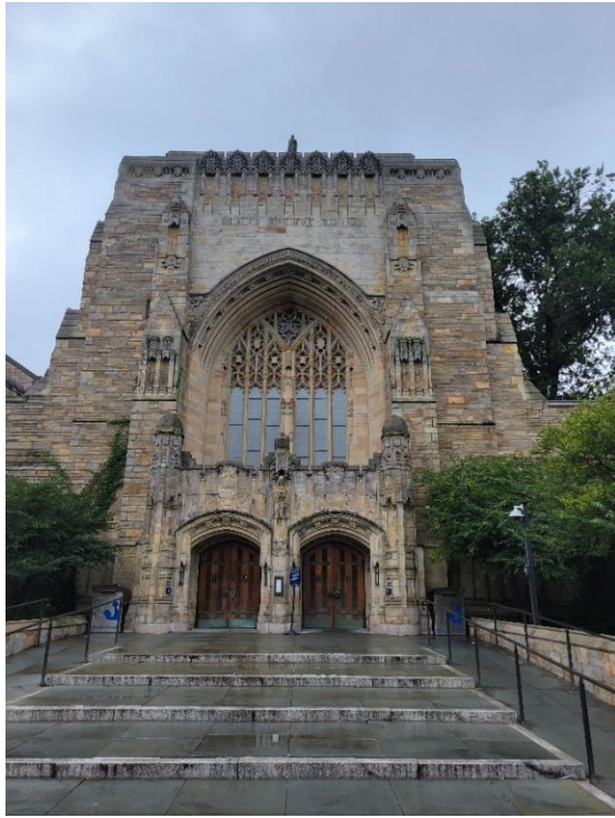
▲ Sterling Memorial Library 外觀