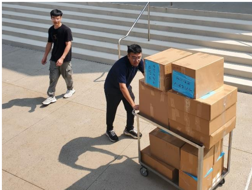
▲ 整理團隊成員搬運箱子至貨櫃車過程照