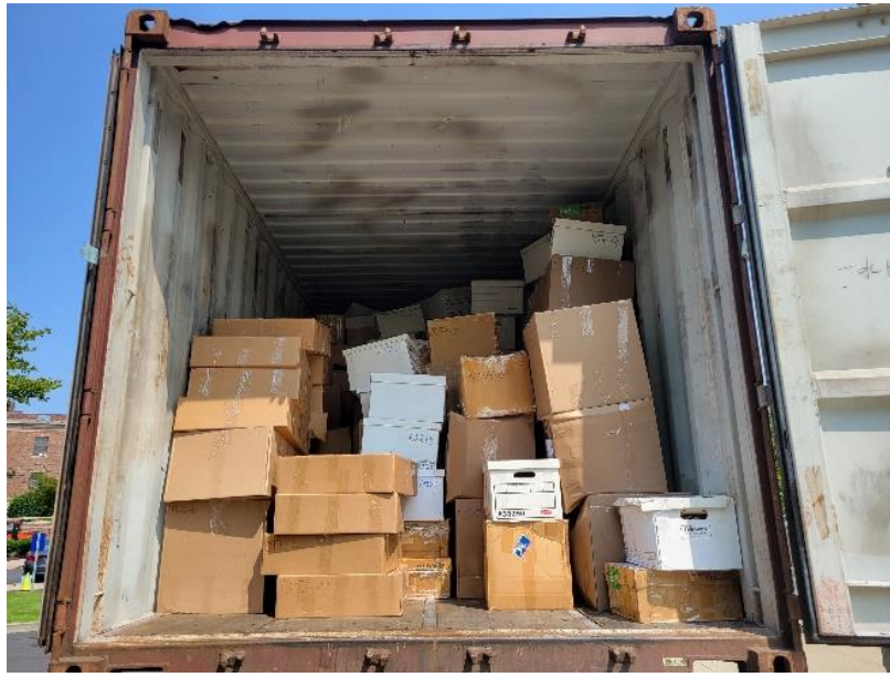
▲ 本次書籍案件文獻封箱運送之貨櫃車