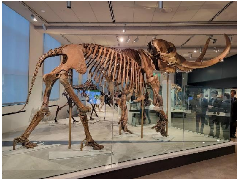
▲ Peabody Museum of Natural History 内展品