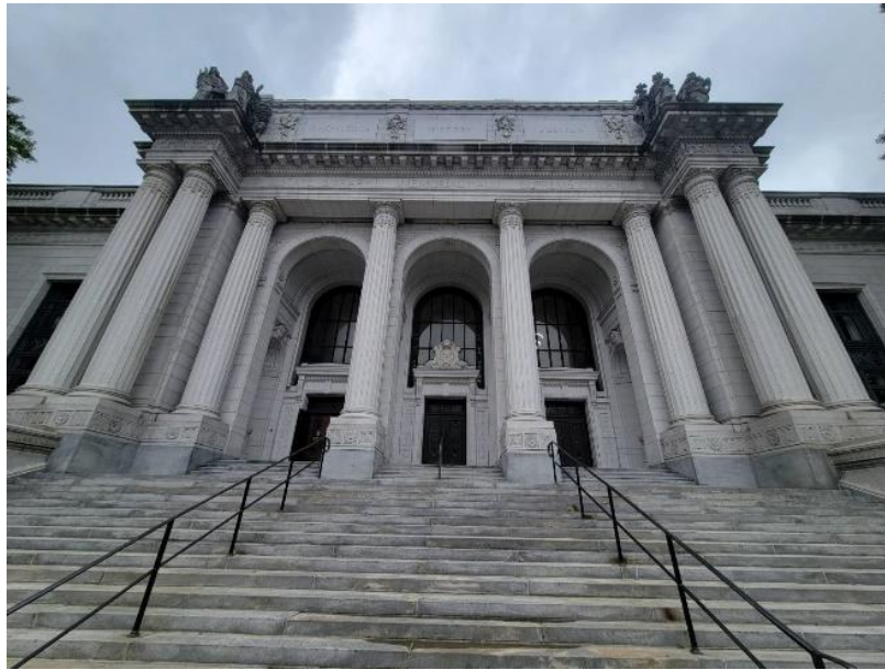
▲ Connecticut Supreme Court，具有典型「法院」的外觀