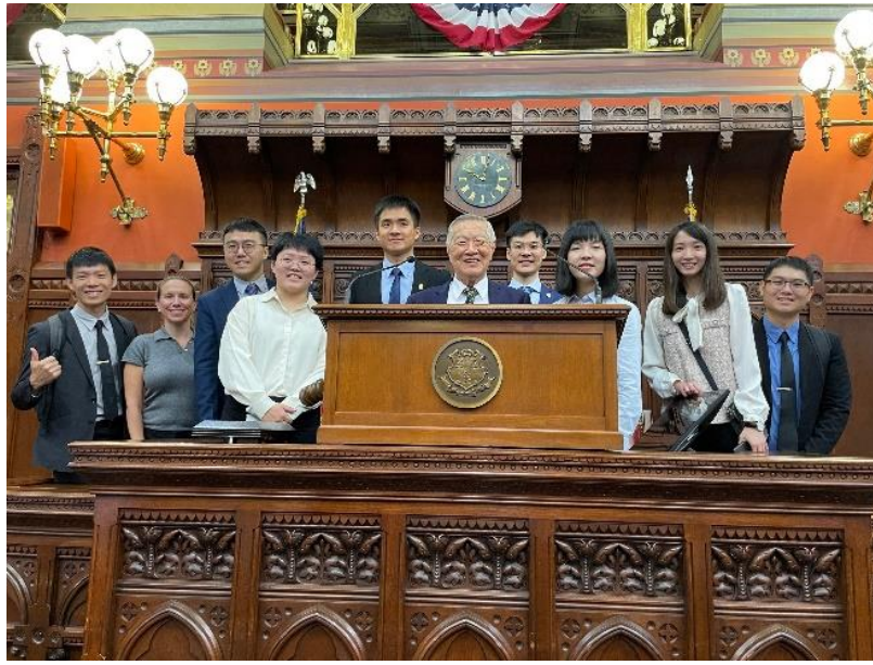
▲ 團隊成員與博士在議會合影