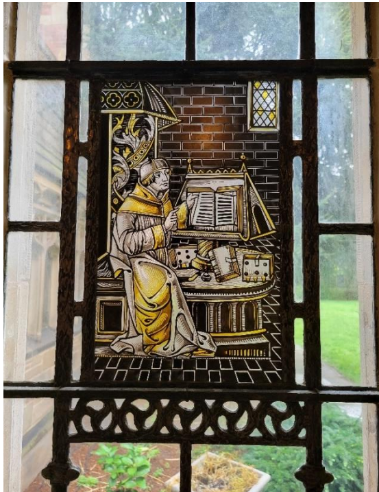
▲ Sterling Memorial Library 內玻璃窗