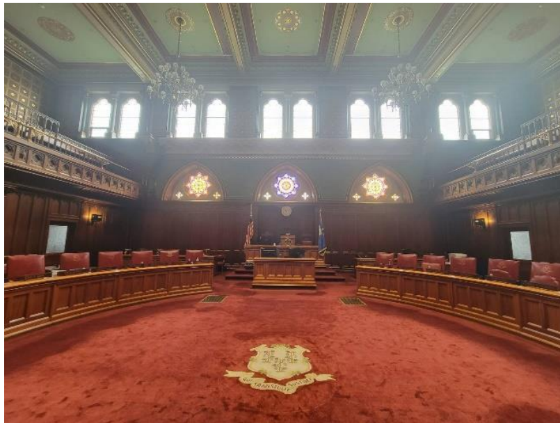
▲ 充滿歷史感的參議院議事廳