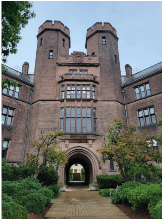
▲ Osborn Memorial Laboratories 外觀