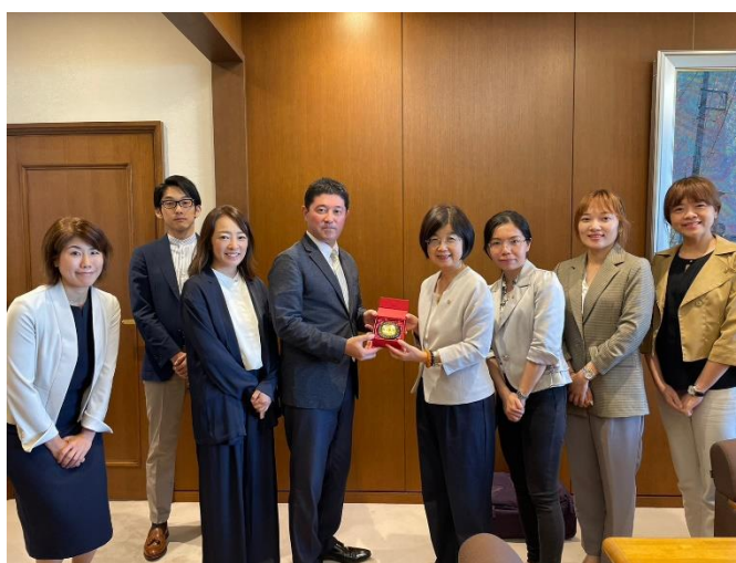
柯院長致贈本學院文鎮

由於我國新制需要律師界的大力配合，我們特別想了解日本律師界在司法修習制度運作上的角色，有何方式讓律師們願意擔任指導律師、參與司法修習生的實習？對此，東二弁表示其實各弁護士会都還是要很辛苦地想辦法拜託律師們來擔任指導律師，無論是用打電話或面談的方式，因無強制措施要求律師們須擔任指導律師帶修習生，律師們主要還是基於前輩幫助後輩的心態來指導修習生。