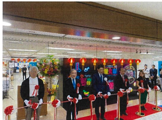
與會貴賓共同開幕剪綵