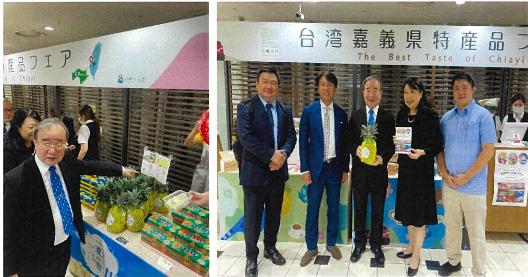
胡次長訪視嘉義優鮮農特產品展售區