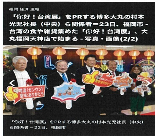
福岡新聞媒體露出