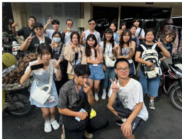
學生於濱城市場外拍攝小組團體照

濱城市場是越南胡志明的大型傳統市場，位於第一郡市中心，是西貢時期少數保留至今的建築之一，市場內販賣許多富有當地特色手作商品及食品，讓學生充分體驗越南日常生活文化。