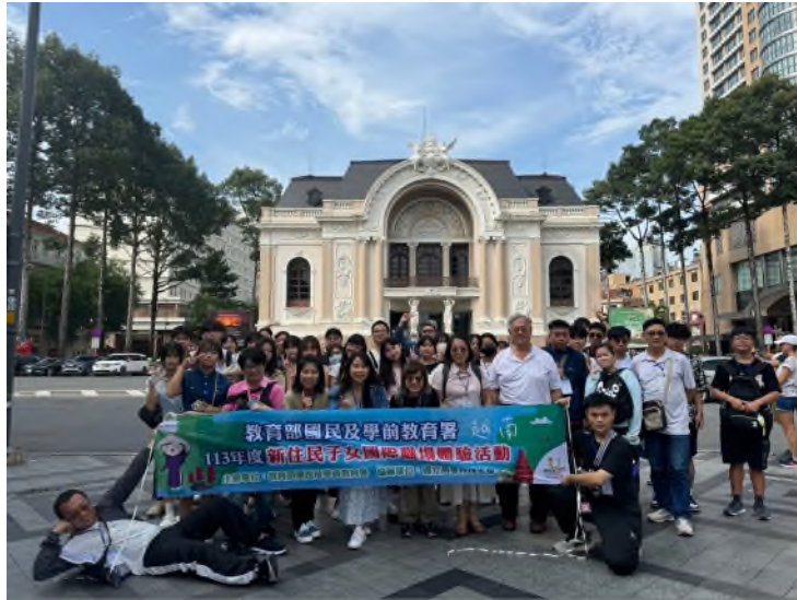
學生於歌劇院外拍攝團體照