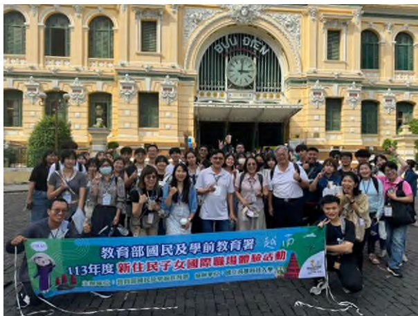
學生於郵政總局前合影

胡志明市中央郵局至今仍在運營，郵局內部有許多櫃檯和郵政服務視窗，供人們寄送信件、包裹和購買郵票等。此外，該郵局還有一些小店鋪，出售紀念品、明信片和其他旅遊商品。