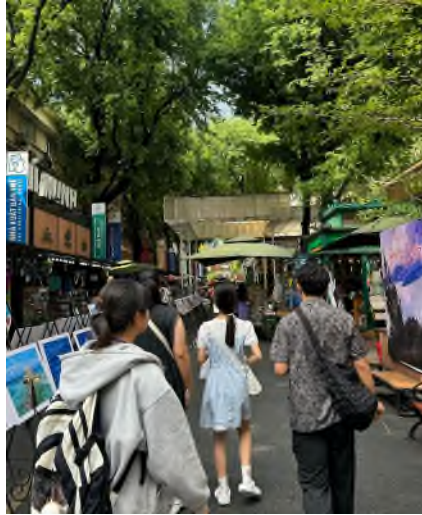
學生於書店街參觀

配合郵政總局、紅教堂、歌劇院…等等鄰近景點，形成一個完整的觀光場域。顯示越南政府在經濟逐步起飛之後，亦逐步加強觀光事業的建設，逐步擺脫以勞力密集之傳統產業方式賺取外匯的模式，邁向另一個經濟層面。