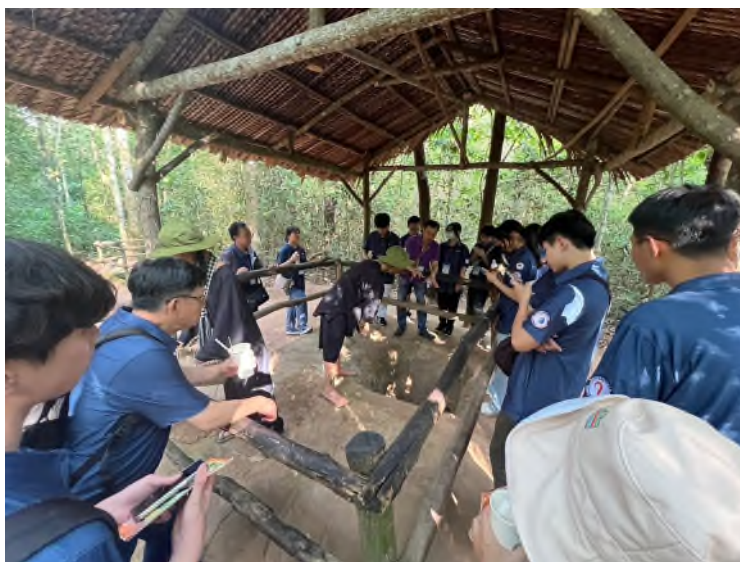
學生聆聽古芝地道歷史解說

現今的古芝地道開放旅客參觀，也可以體驗走地道。第一層必須以半蹲的方式通走，第二層據說得跪著前進，更別說第三層了，甚至必須匍匐前進；在旅客親身體驗過深入地道後，無不為縝密的地下工程所折服，更為越南人民堅忍不拔的民族性格所震撼。