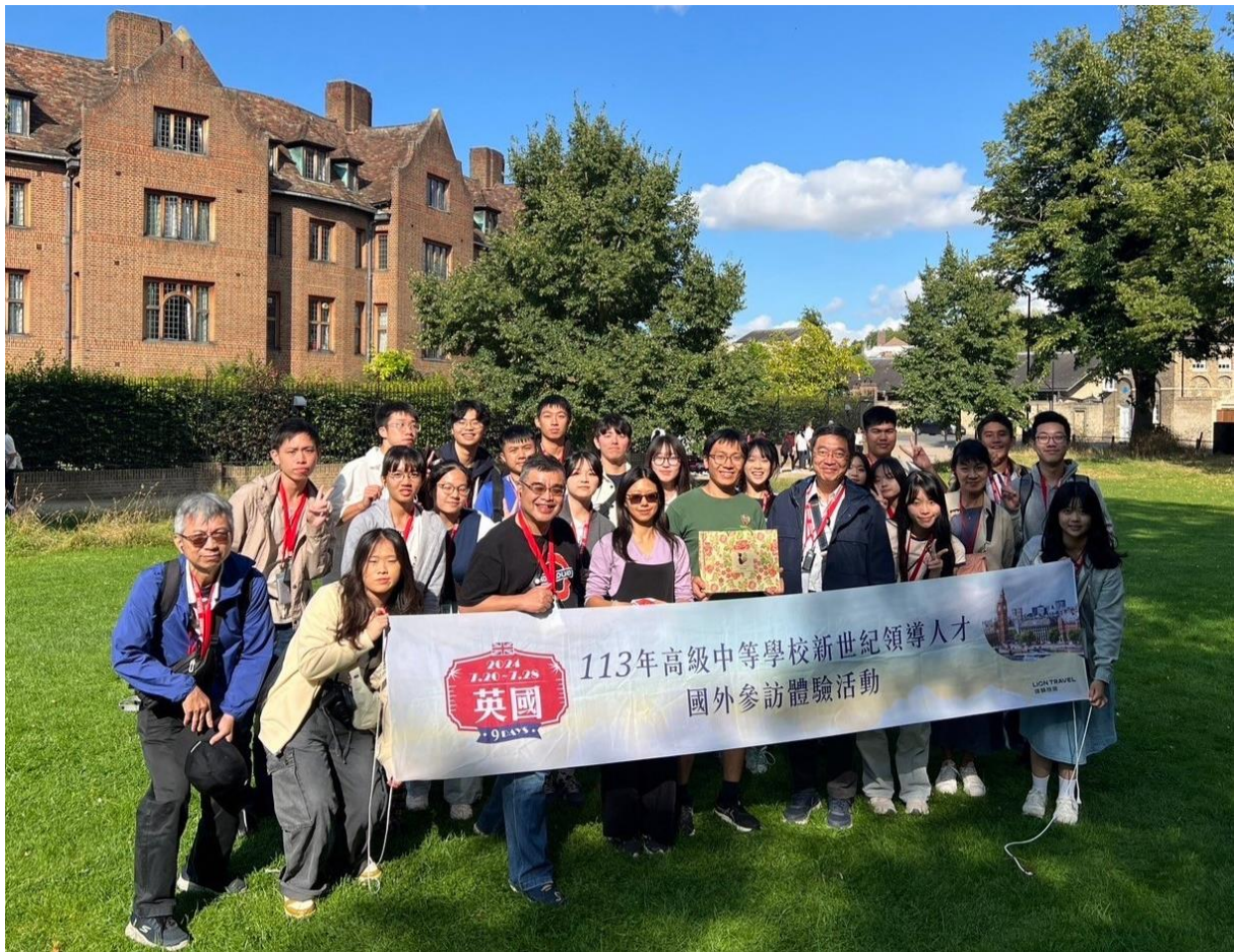
參訪牛津大學合影