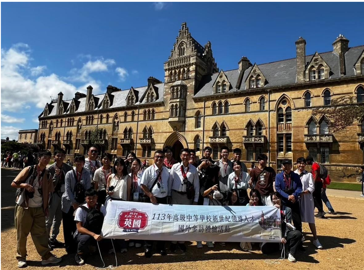
參訪牛津大學合影