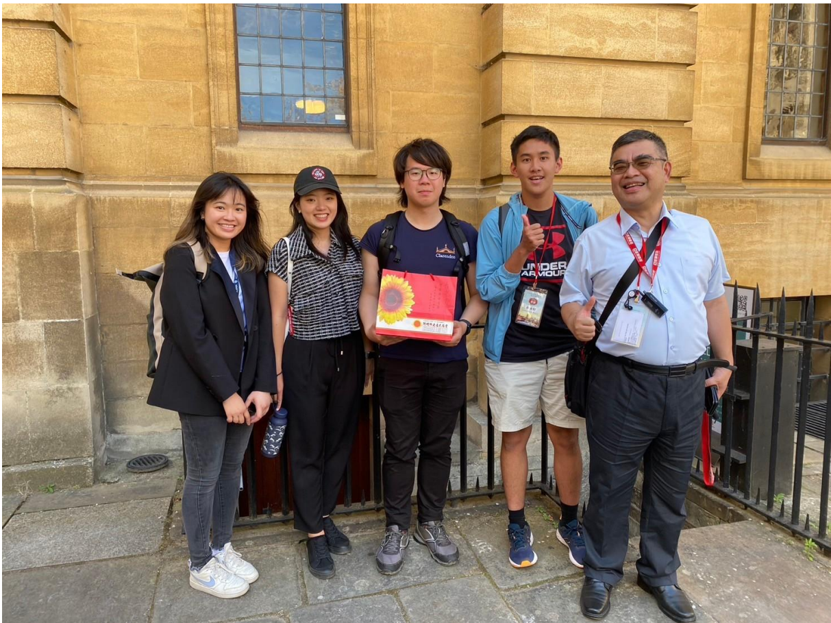
致贈就讀牛津大學的臺灣留學生來自家鄉的禮物