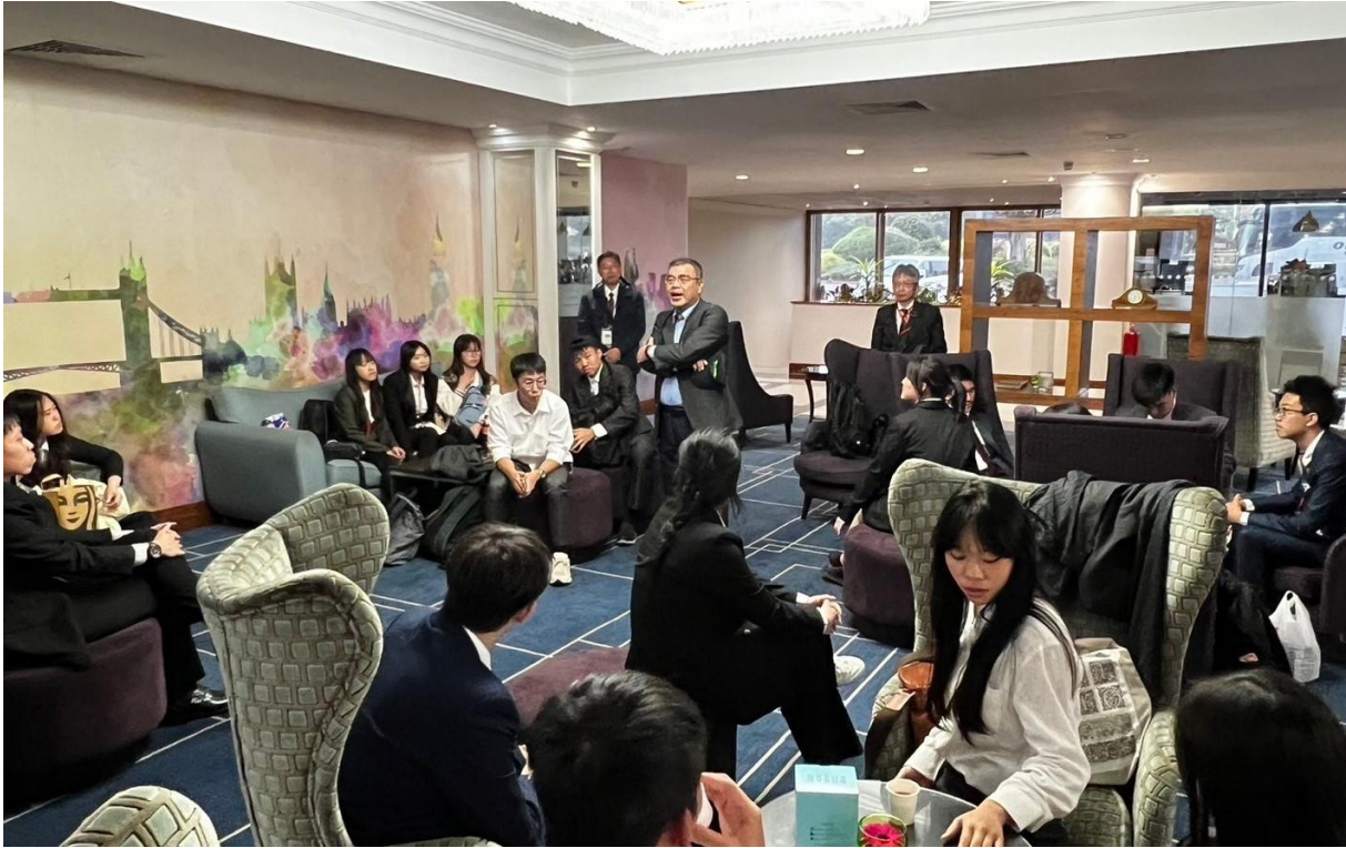
每晚召開檢討會議，分享當天所見所學，省思成為未來領導人才之課題