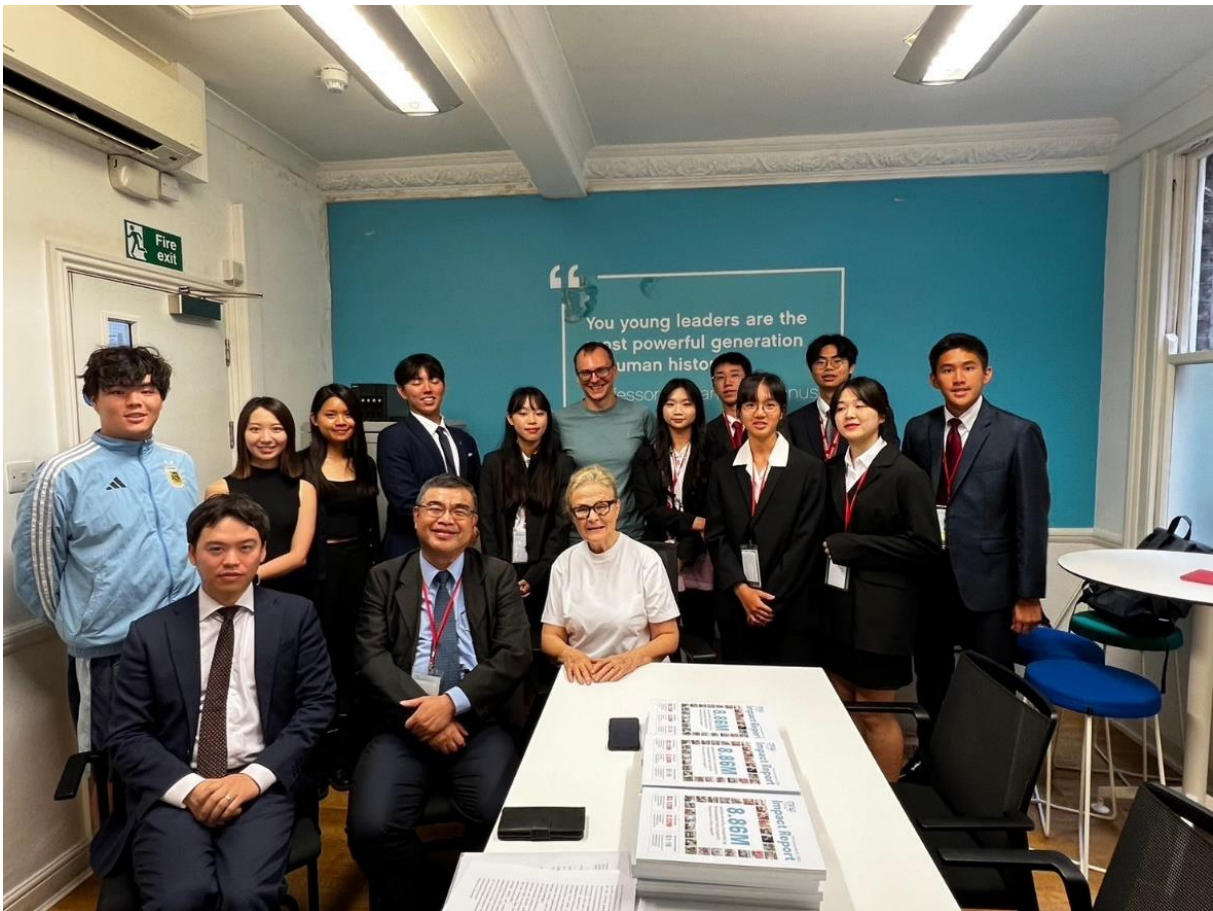
參訪 One Young World 機構合影