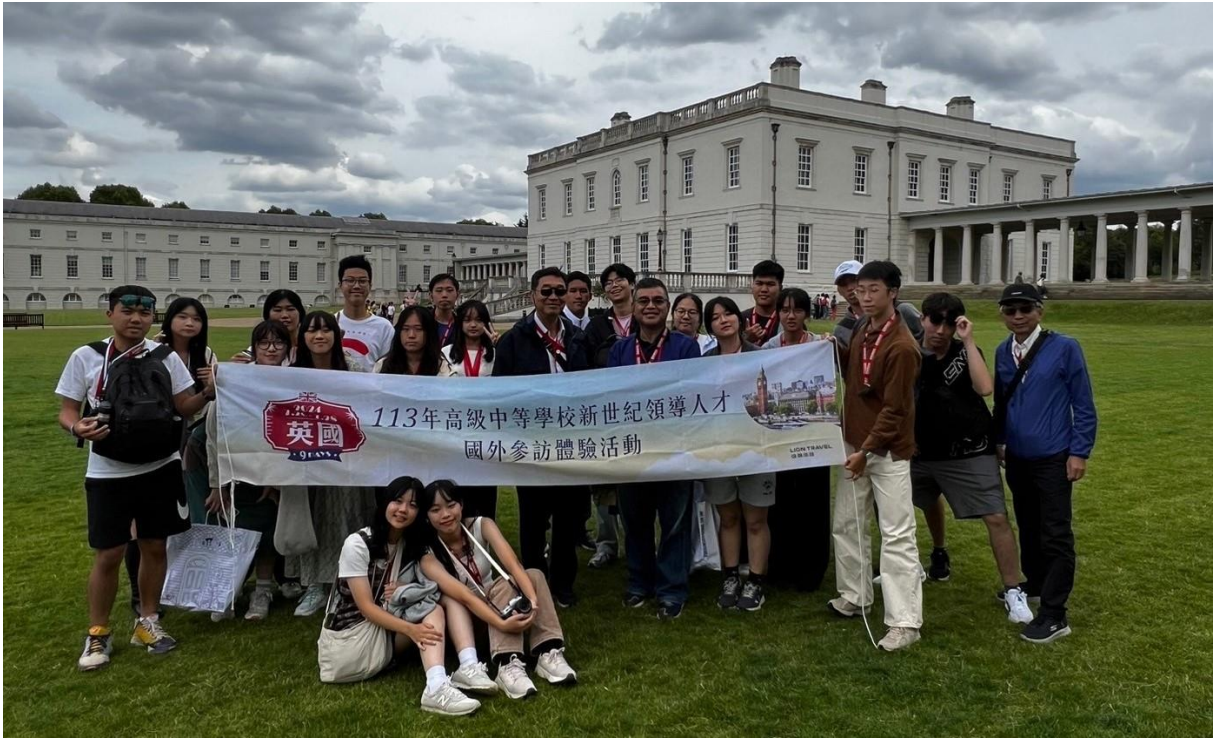
格林維治海事博物館前合影