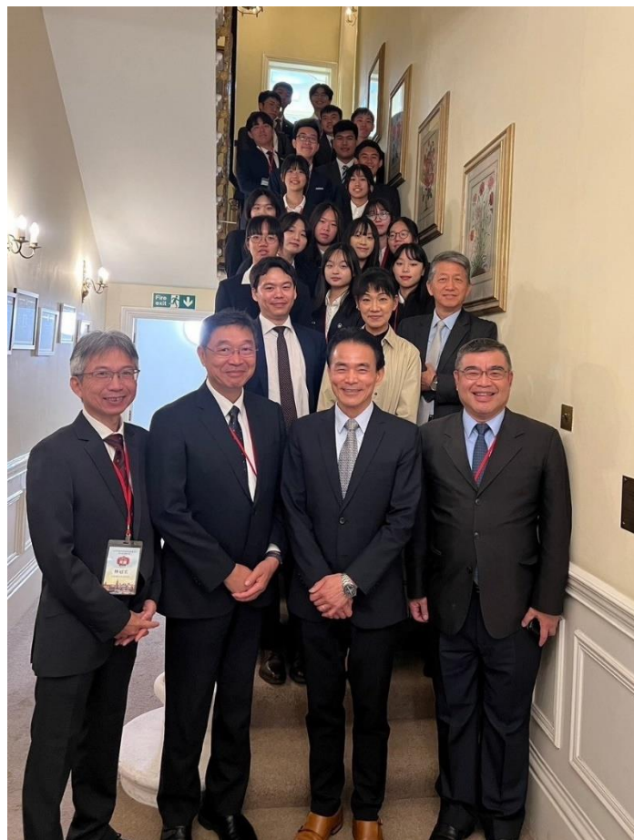
拜會我國駐倫敦代表處合影