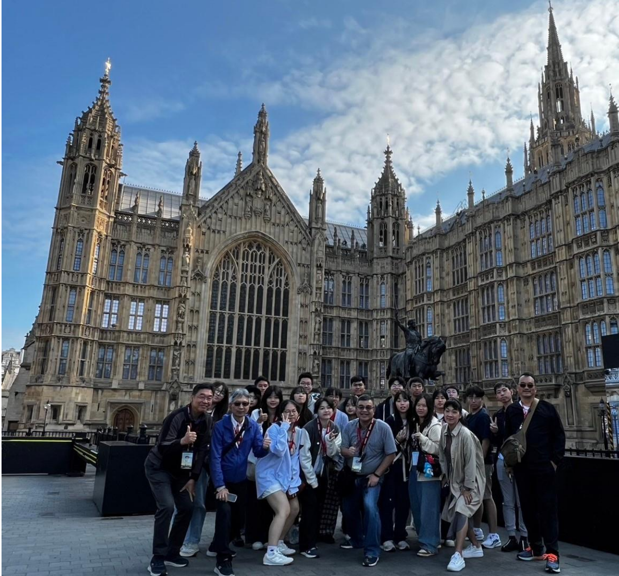
英國國會大廈前合影