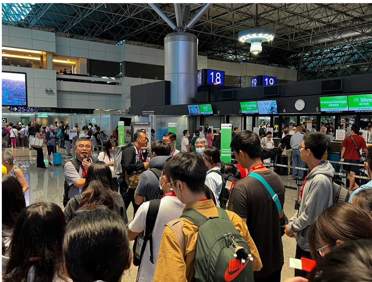
出發前對學員的勉勵與叮嚀