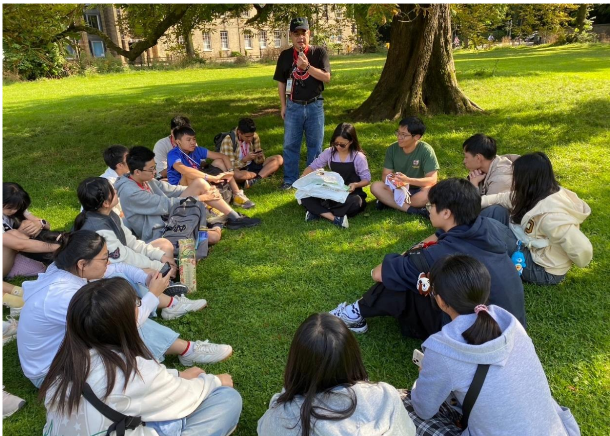
主持就讀牛津大學的臺灣學生與學員的交流活動