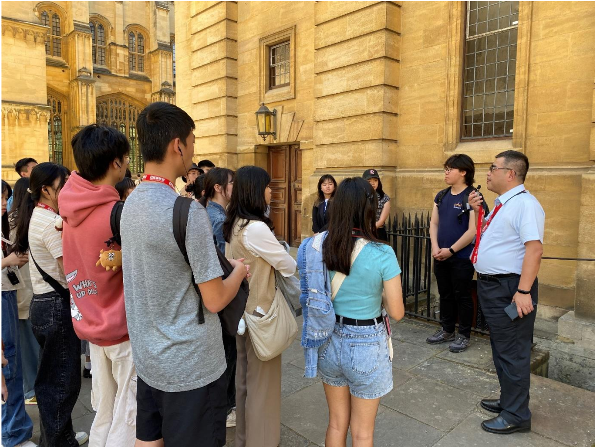
主持就讀牛津大學的臺灣留學生與學員交流活動