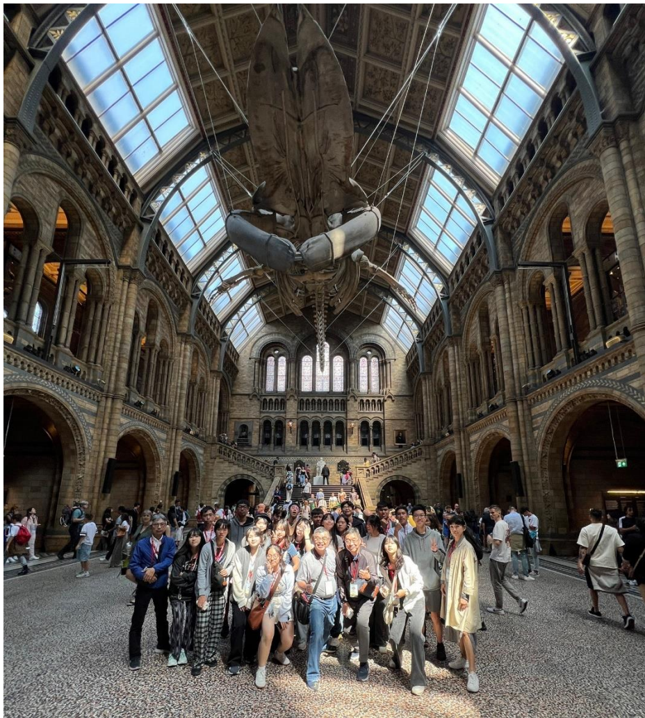
自然史博物館大廳合影