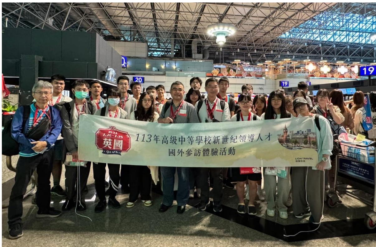
2024年7月20日(六) 上午5:45 於桃園機場第二航廈集合，展開學習之旅