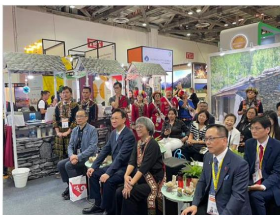
圖:原民會率台灣部落前進新加坡，宣傳台灣觀光與第三屆世界原住民族旅遊高峰會。

【李婉如 / 報導】原住民族委員會為推廣明年4月第3屆世界原住民族旅遊高峰會(WITS)，於10月25至27日赴新加坡參與亞洲規模最大旅遊貿易展「ITB Asia」，向國際貴賓、旅行業者推廣臺灣部落旅遊，並以「TULU IN TAIWAN」為活動口號，向世界宣傳3屆世界原住民族旅遊高峰會在臺灣高雄！