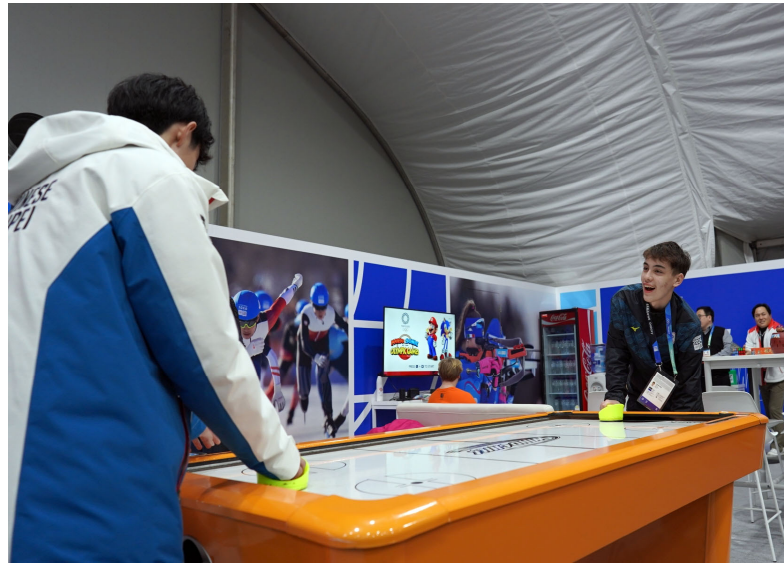
冰球隊選手參與 Athlete365House 體驗活動