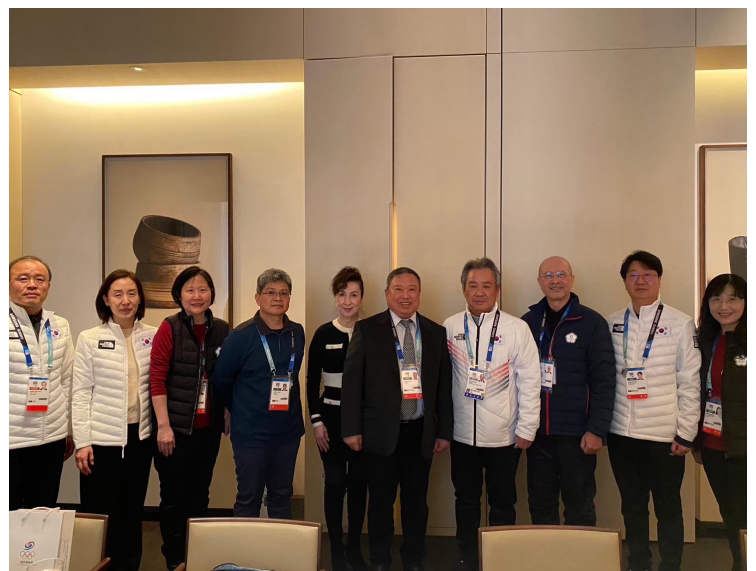
團本部拜會韓國奧會