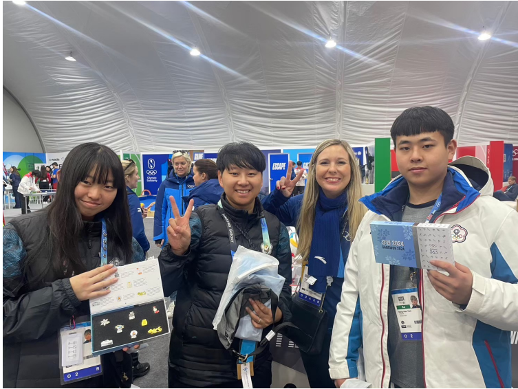
雪橇隊參與 Athlete365House 體驗活動