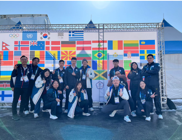
團本部行政及醫護團隊