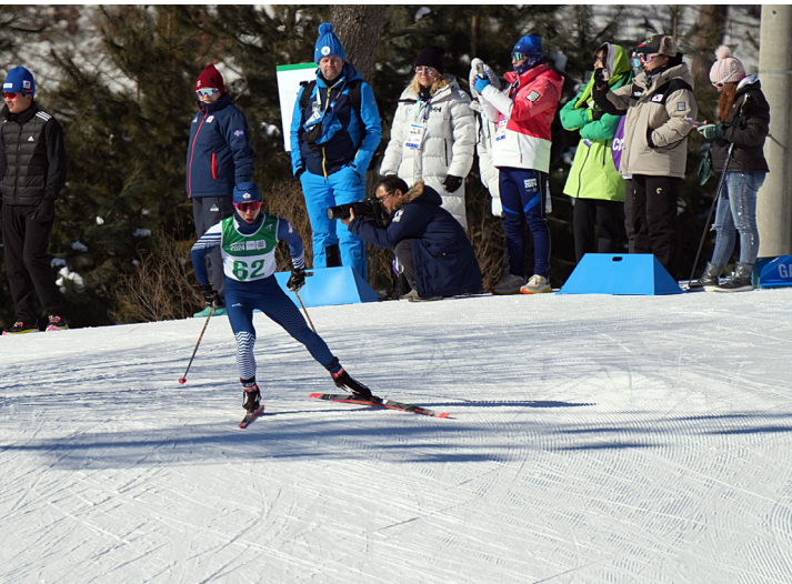
滑雪男子選手比賽情形