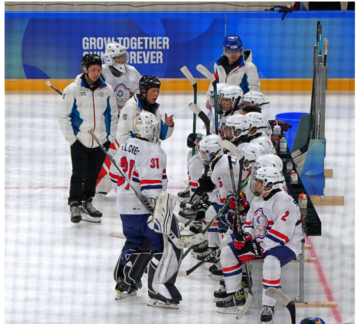
冰球隊上場前準備