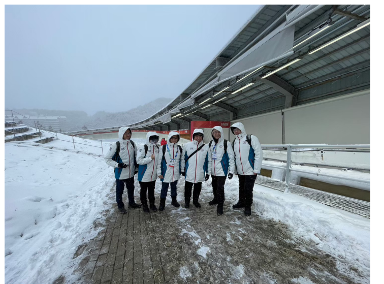
團本部至雪橇場為選手加油