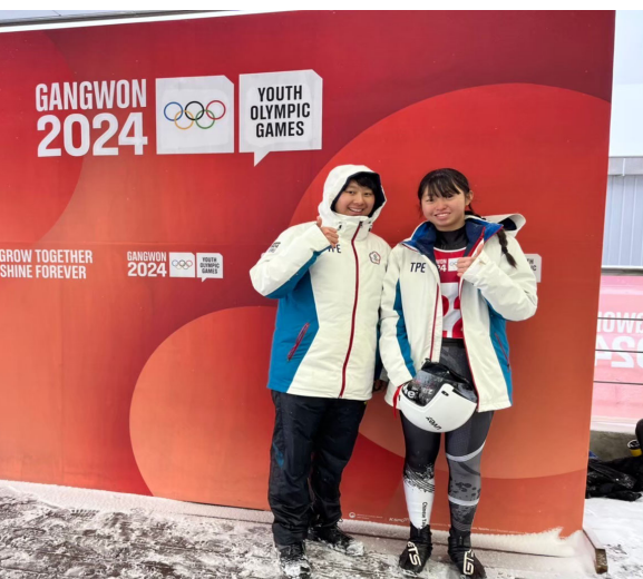
雪橇選手賽後與教練合影