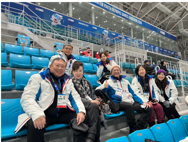
團本部至冰球場為選手加油