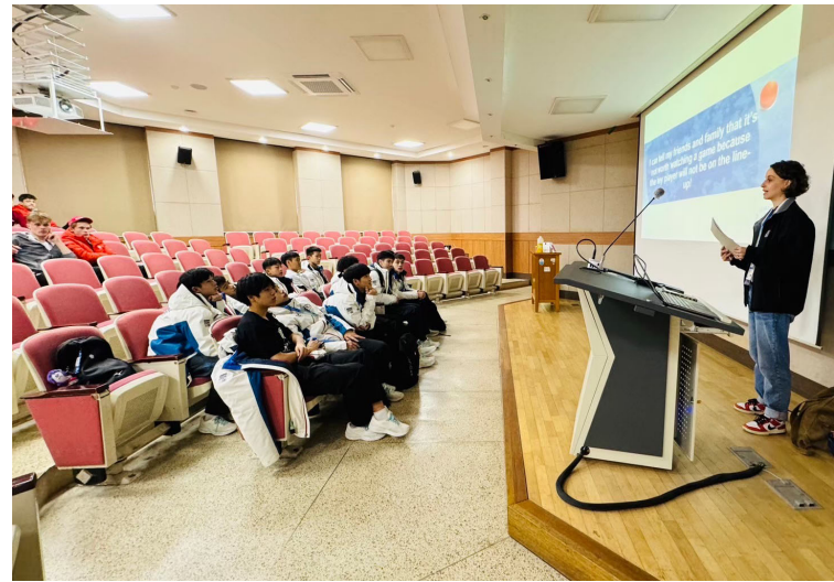
冰球隊參加大會課程