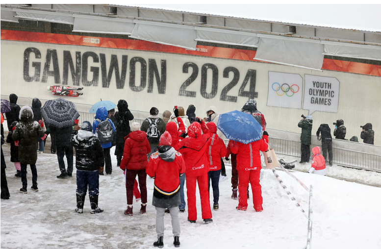
女子雪橇比賽情形