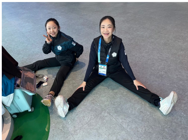
女子花式滑冰練習暖身