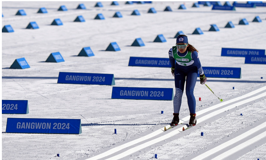
滑雪女子選手比賽情形