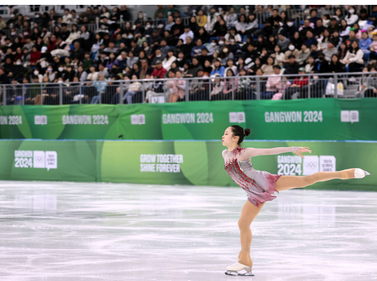
女子花式滑冰長曲演出