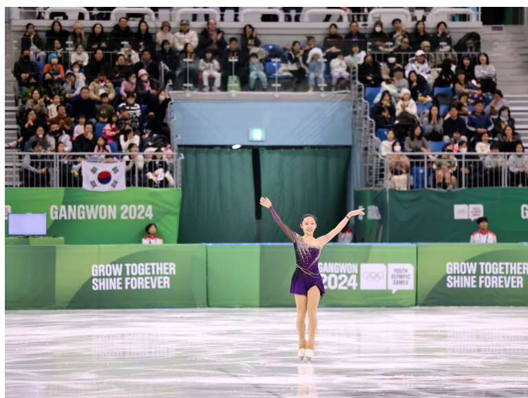
女子花式滑冰短曲演出