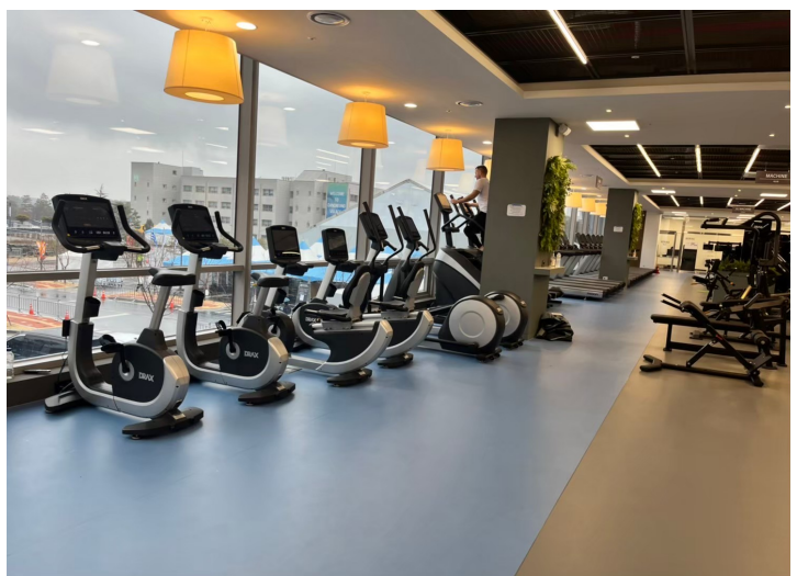
選手村設施健身房