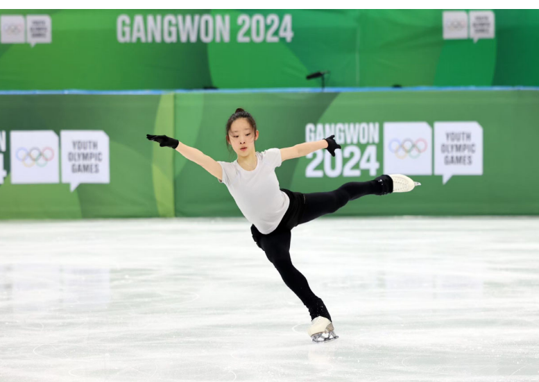
女子花式滑冰上冰練習