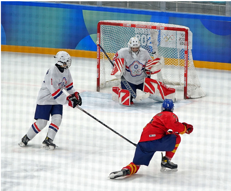
冰球隊與西班牙隊激戰