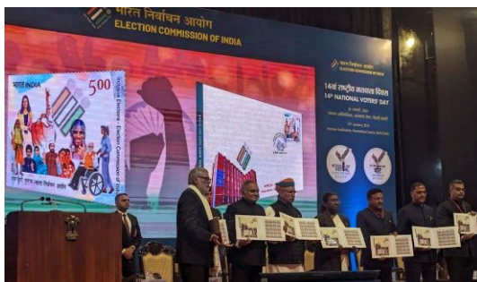
【宣布發行國家選舉人日紀念郵票】