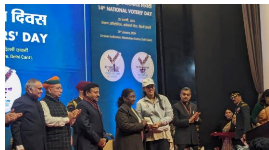
【向初次取得資格選舉人致發選舉人證】