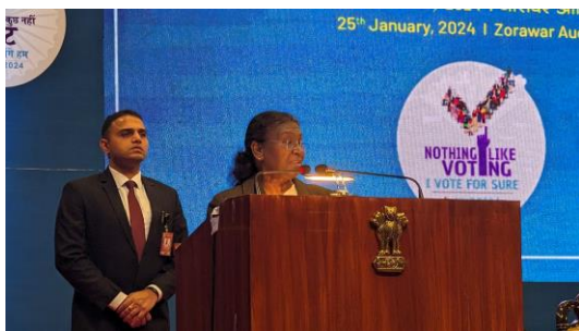
【印度總統蒞臨會場致詞】

本日上午9時出席第14屆印度國家選舉人日慶祝活動，印度選舉委員會成立於1950年1月25日，每年1月25日為印度國家選舉人日慶祝活動，除紀念該會之成立外，提高民眾選舉意識，鼓勵其參與選舉，慶祝活動中印度總統Droupadi Murmu女士蒞臨會場致詞，代表印度選舉委員會向初次取得資格選舉人祝賀，並致發選舉人證，另頒發最佳選舉實踐獎，表揚2023年選舉選務人員，於資訊科技運用、安全維護、選務作業、無障礙投票措施、選舉人名冊作業以及選民宣導等領域的傑出表現。印度總統Droupadi Murmu女士於會中也與印度選舉委員會共同宣布發行「包容性選舉」主題紀念郵票。