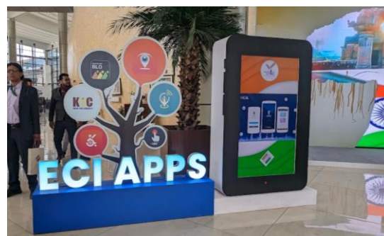
【印度選舉委員會各種手機APP簡介】