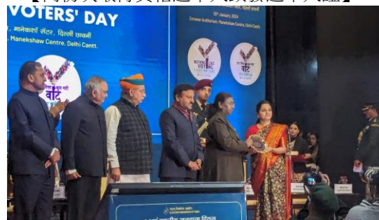
【績優選務人員表揚】