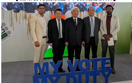
【會場外與工作人員合影】