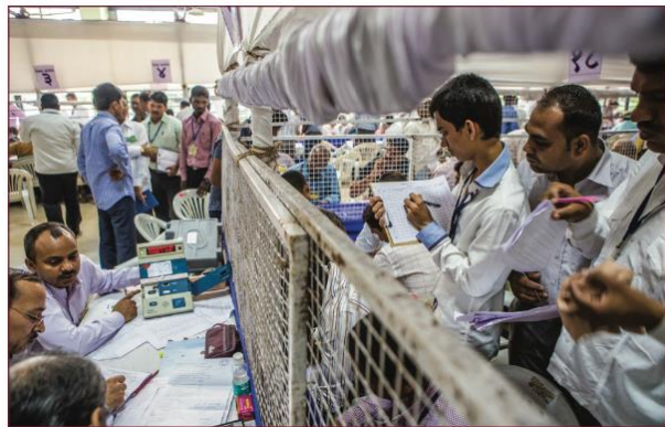
【候選人及其代表於右側護欄外參觀開票情形】

後，即宣布該輪EVM開出之開票結果。所有EVM開票結束後，將開票結果上傳計票系統。