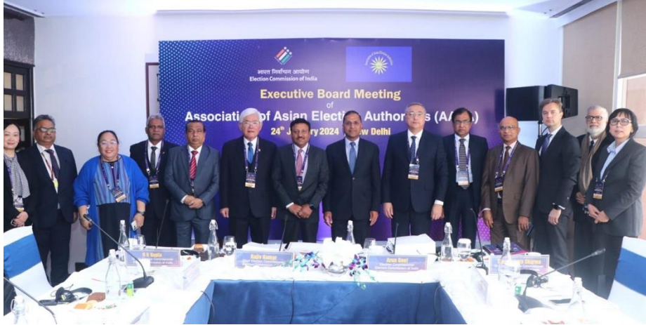
【與會人員於會後合影】

(三) 建置AAEA網站，印度選舉委員會將提出AAEA網站初步設計規劃並徵求各會員國意見。