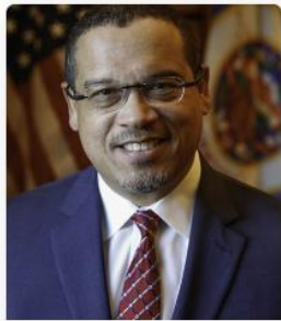
Keith Ellison Minnesota