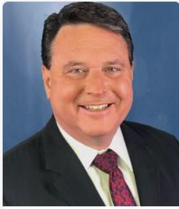
Todd Rokita Indiana