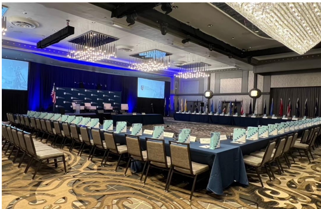
首都論壇邀集全美州檢察長，為 NAAG 年度盛會

自 2019 年起，全美州檢察長協會的年度會議在名稱、形式、地點上有所變更，改制成每年 12 月固定在華盛頓哥倫比亞特區召開冬季年會，並舉行首都論壇，且進行協會的正副會長改選、年度獎項頒發及新舊任州檢察長交流，也開放給公眾報名。另外在春季間則是舉辦州檢察長研討會（NAAG Attorney General Symposium），地點每年由協會執行委員會決定，其中一半的議程屬於閉門會議，參加者僅限於州檢察長及其團隊，另外一半的議程則開放給公眾報名。