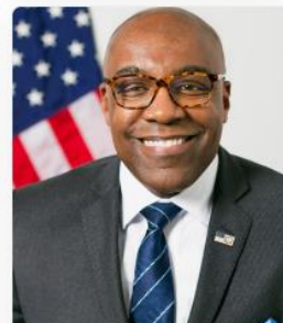
Kwame Raoul Illinois