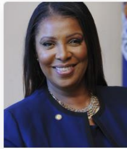
Letitia A. James New York