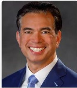
Rob Bonta California