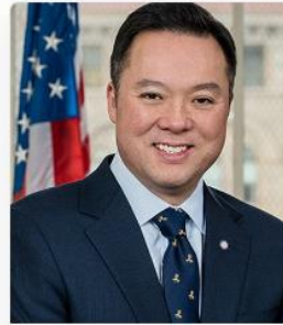
William Tong Connecticut