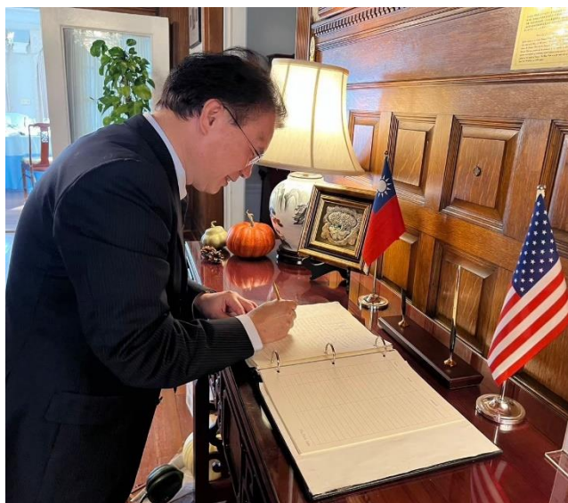
黃次長率團蒞訪雙橡園