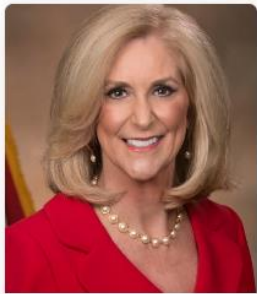
Lynn Fitch Mississippi