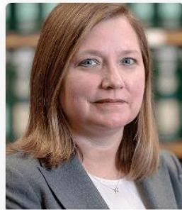
Michelle A. Henry Pennsylvania