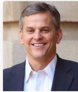
Josh Stein North Carolina