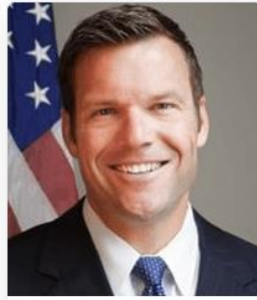
Kris Kobach Kansas