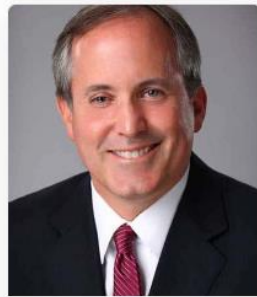
Ken Paxton Texas