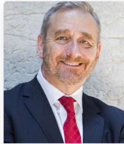
Dave Yost Ohio