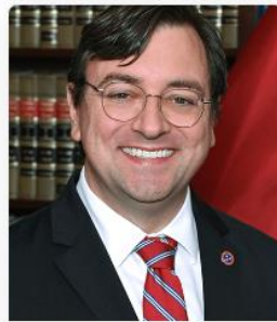
Jonathan Skrmetti Tennessee