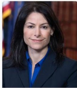
Dana Nessel Michigan