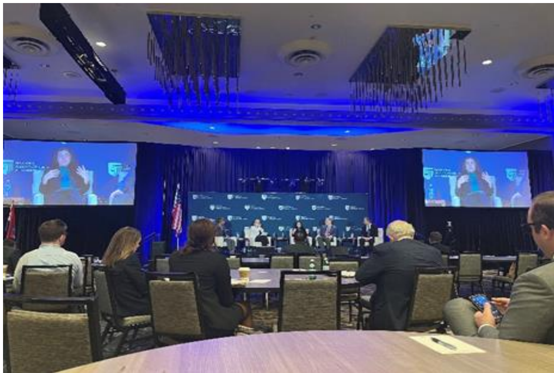
首都論壇「Protecting the Public in the Age of AI」主題座談

該公司推動負責任的人工智慧的相關道德原則包含可解釋性、公平性、穩健性、透明性、隱私保護等原則：(1)可解釋性原則：指在創建無縫體驗時，良好的設計不會犧牲透明性；(2)公平性原則：在經過適當校準之後，人工智慧可以幫助人類做出更公正的選擇；(3)穩健性原則：當系統被用來做出重要決策時，人工智慧必須具有安全性和強健性；(4)透明性原則：透明度強化信任，而促進透明度的最佳方式是透過揭露；(5)隱私保護原則：人工智慧系統必須優先考慮並保障消費者的隱私和數據權利。