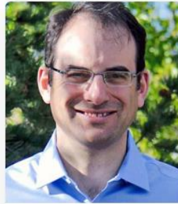
Phil Weiser Colorado