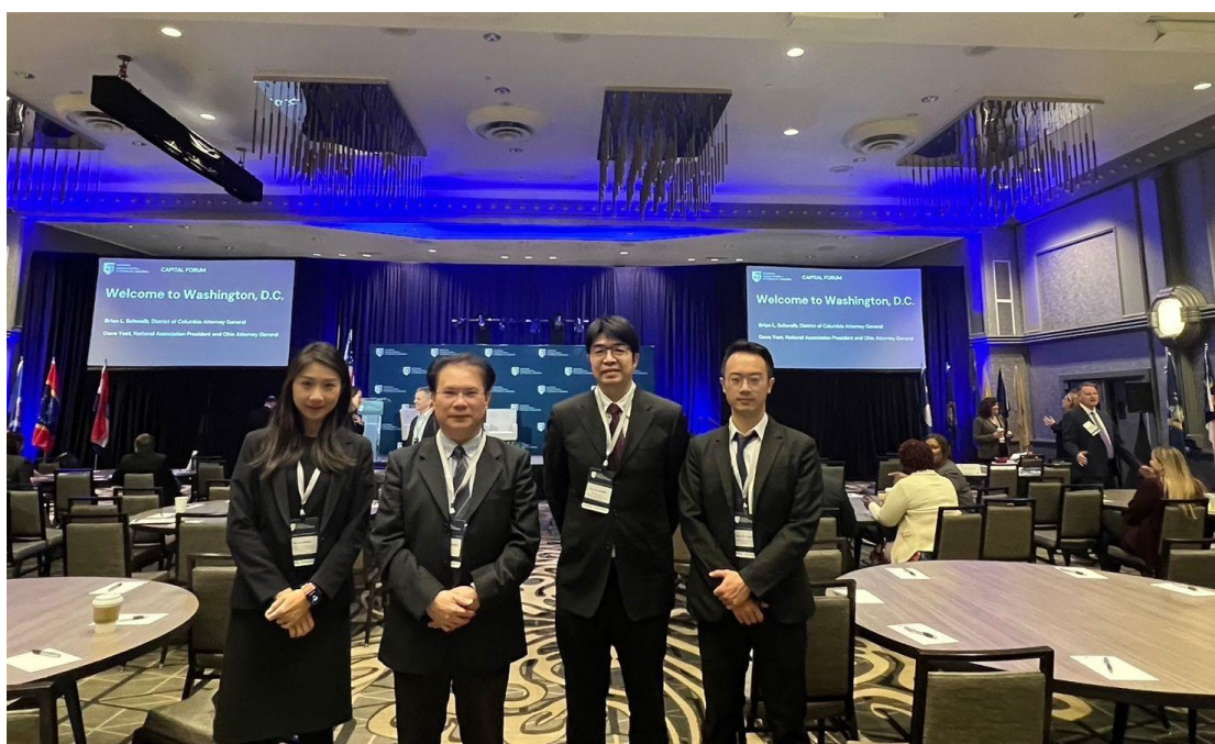
黃常務次長謀信（左二）率團於華府首都論壇會場合影

暨所有同仁的協助，此外，本次出訪亦有賴外交部、美國在臺協會、法務部調查局機場調查站、駐舊金山臺北經濟文化辦事處及法務部各相關司處同仁的協調與幫忙，方能圓滿達成任務，也特別在此致上代表團誠摯之謝意。