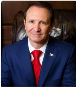
Jeff Landry Louisiana