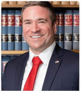
Andrew Bailey Missouri