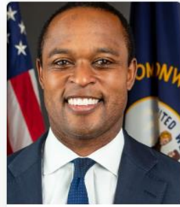
Daniel Cameron Kentucky