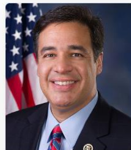
Raúl Labrador Idaho