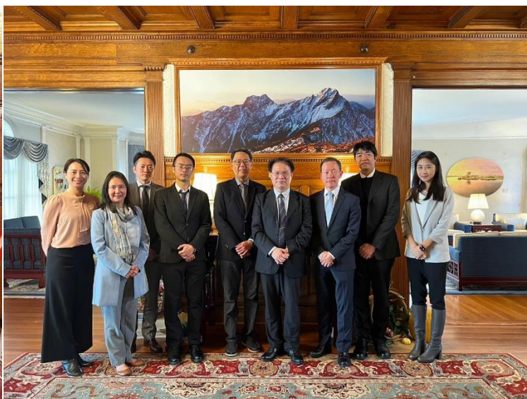
代表團與姜公使及駐美代表處人員合影

姜公使現為駐美國代表處副代表，具有國立政治大學外交研究所碩士、美國哈佛大學甘迺迪政府學院經濟發展研習班結業等學歷，曾任駐芝加哥辦事處處長、外交部歐洲司司長等重要職務，餐會中，姜公使表示，該處十分重視我國與全美州檢察長協會的互動與友好，強調我國持續維繫與全美州檢察長協會的交流、友誼的重要性，並對於本部全力支持此互動往來，表示感謝。黃次長則就我國法務部自民國76年前起在駐美代表處的協助推動下，持續獲邀組團赴美參加全美州檢察長協會夏季年會，並於近年改為參加冬季論壇，實為建立及維繫雙方司法人員情誼的絕佳場合，本部向為重視，請駐美代表處持續協助推動，雙方也就現下重要司法及執法議題彼此交換意見，餐敘氣氛融洽，讓代表團有賓至如歸的感受，對於雙橡園的特殊歷史及待客之道，留下美好深刻的印象。