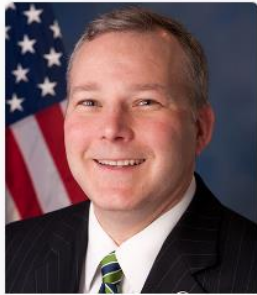
Tim Griffin Arkansas