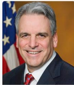
Peter F. Neronha Rhode Island