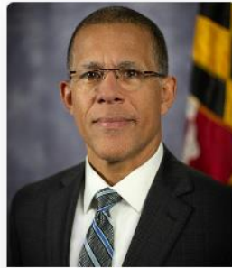
Anthony G. Brown Maryland