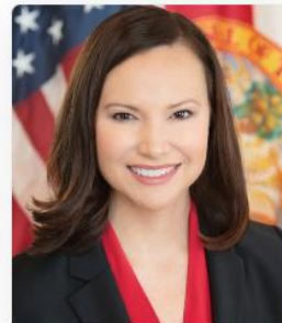
Ashley Moody Florida