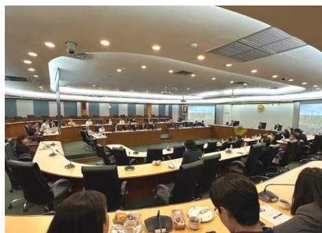
拜會泰國農業大學，校方代表介紹學校資訊。