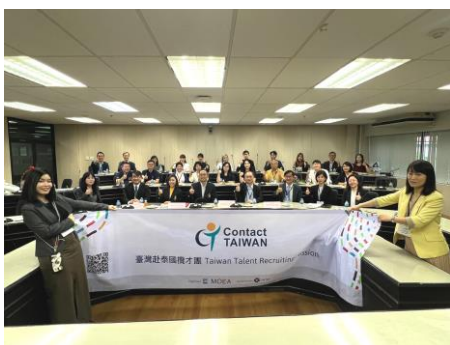
拜會朱拉隆功大學，本團團員與校方代表合影留念。