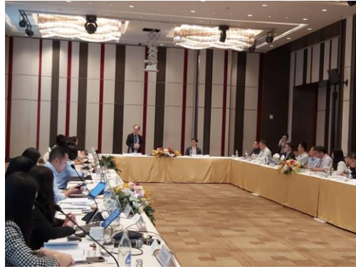
於飯店辦理團務會議，向團員說明本次行程安排。