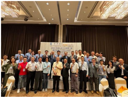
臺商座談餐會，邀請深耕泰國多年臺商分享經驗。