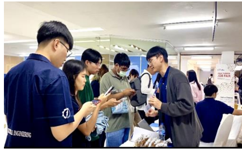
瑪希頓大學徵才，人才於活動現場註冊 Contact TAIWAN 會員並上傳履歷。