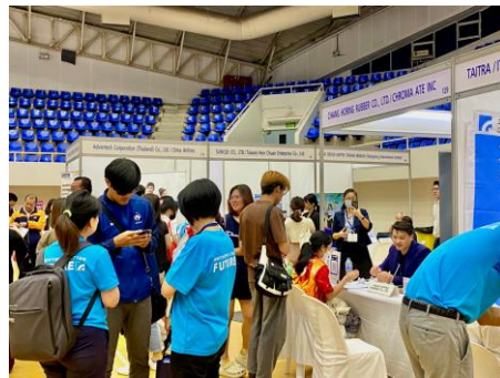
國立法政大學徵才，企業與人才交流熱絡。