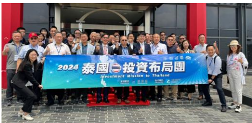
參訪 Yamato 工業區，與當地人力仲介、銀行、法律顧問討論落地泰國相