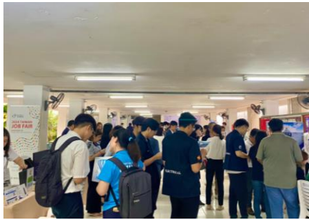
瑪希頓大學徵才，吸引 3 百多名學生到場面談，現場氣氛熱鬧非凡。