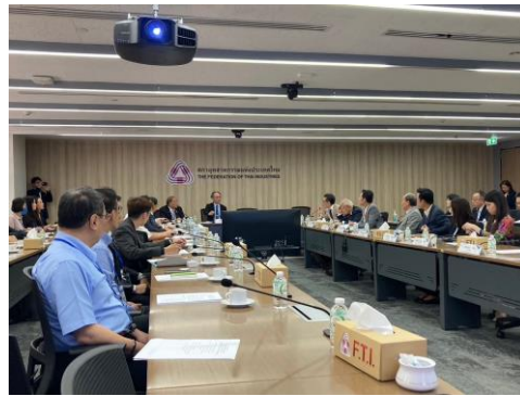
拜會泰國工業總會(FTI)，討論產業推廣經驗。