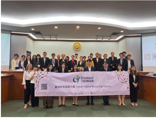
拜會泰國農業大學，本團團員與校方代表合影留念。