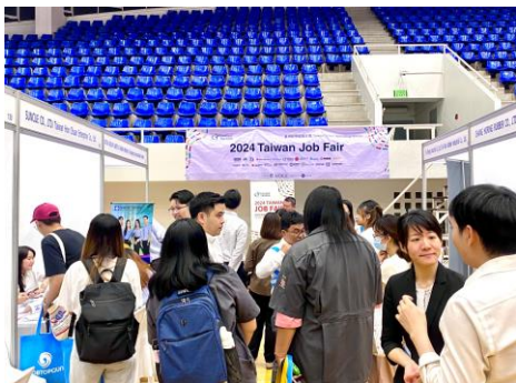
國立法政大學徵才，人才對於 Taiwan Job Fair 深感興趣，紛紛前往至各攤位了解職務內容。