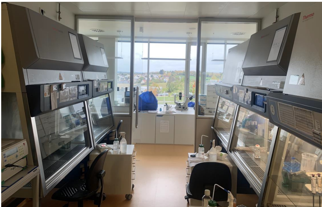
圖 6. 我在進修期間每天都在這裡工作的實驗室

我在前幾個月慢慢熟悉實驗室的工作流程後，開始和團隊中的一位學生一起進行一個小的研究計畫。可惜這個計畫最後成果不如預期，不過從中學到了很多經驗，我也在有了一些 CAR construct 的設計經驗後。和指導教授討論提出了自己的研究計畫，並且自己設計了計畫要用的 CAR construct，生產出 CAR T 細胞後，設計實驗來驗證自己的假設是否正確。研究計畫進行中總是起起伏伏，有時為了好的結果而開心，更多的時候卻是搞砸實驗，或是看著實驗的結果懷疑自己的假設到底對不對。進修的最後幾個月為了能加緊趕工，每天幾乎都在實驗室待到半夜搭最後一班公車回家，最後經過一整年的努力，完成了一點成果，可惜礙於目前正在投稿中，尚無法在報告中呈現完整內容。