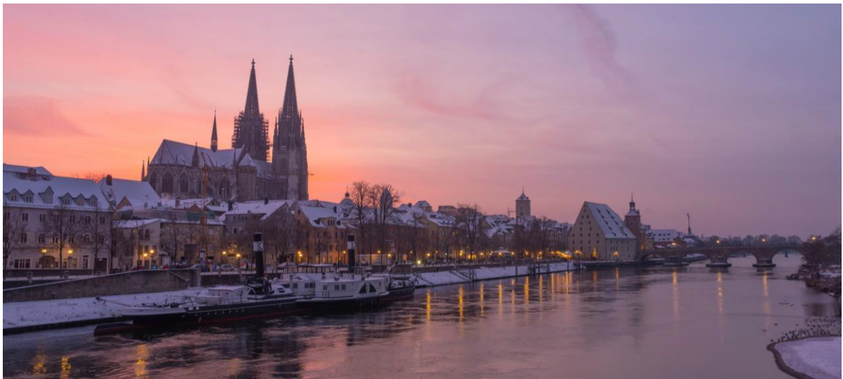
圖 4. 進修地點德國拜揚邦雷根斯堡冬日一景