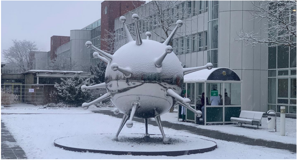
圖 3. 萊布尼茲免疫治療研究所門口的 T 細胞的雕像。