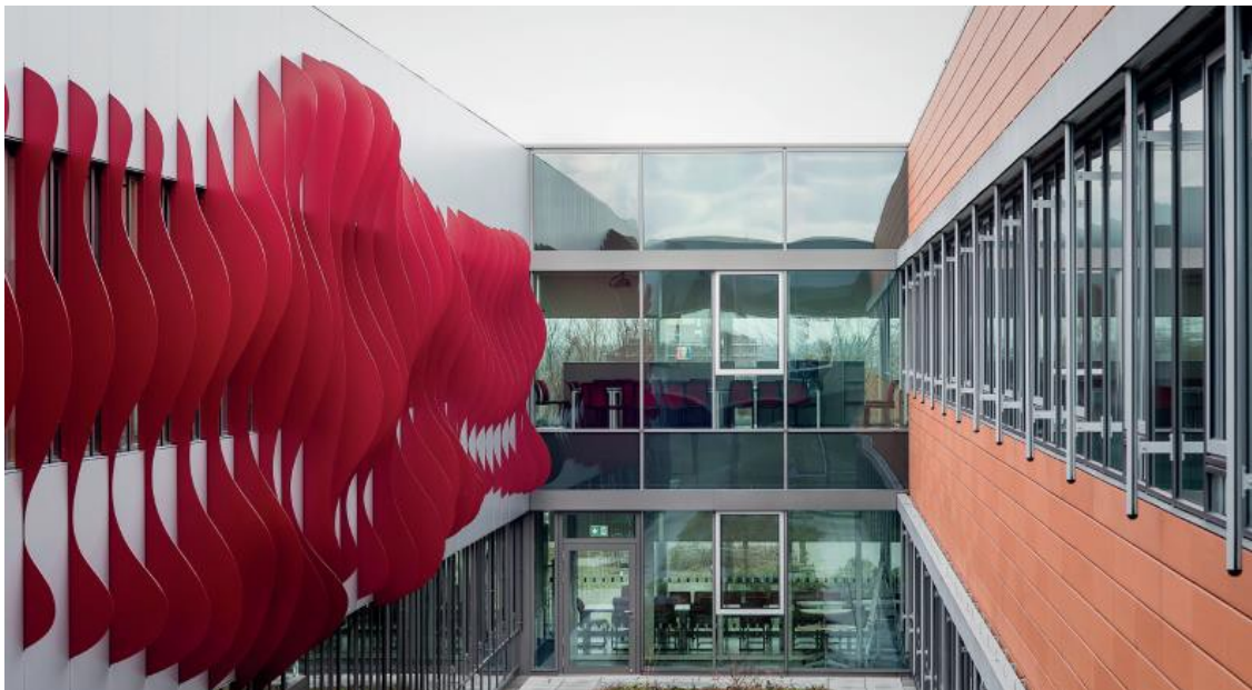
圖 2. 萊布尼茲免疫治療研究所中庭一景

萊布尼茲免疫治療研究所除了主要進行基礎研究的研究團隊之外，旗下的 José Carreras Center (JCC) 是由三大男高音之一的卡列拉斯血癌基金會 (José Carreras Leukemia Foundation) 贊助下所成立，設有符合歐盟潔淨度 A-D 級 (等同於 ISO 4.8/5 至 ISO 8) 標準的實驗室空間，能夠進行符合 GMP 等級的各種細胞處理，包含細胞篩選、培養、基因轉殖等，以提供免疫細胞治療的臨床試驗需求。同時，萊布尼茲免疫治療研究所也和拜揚邦臨近的幾家大學和大學醫院 (Wurzburg Friedrich-Alexander-Universität, Julius-Maximilians-Universität Würzburg 等) 一些進行免疫治療研究的研究團隊，共同組成跨區域的合作研究聯盟 Collaborative Research Centre/Transregio (CRC/TR) 221，定期召開免疫治療研討會，並有數個合作研究案也以此平台為基礎正在進行中。