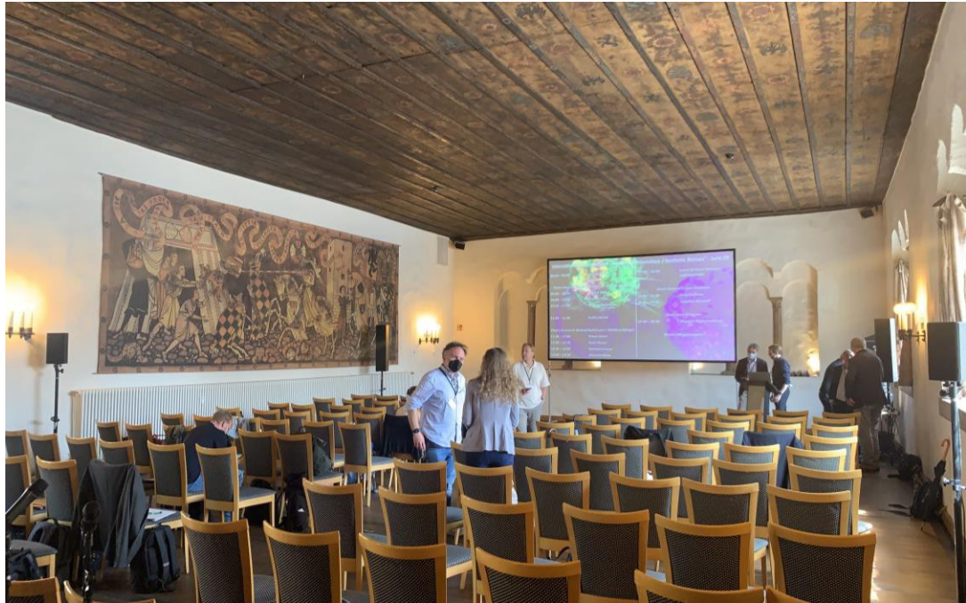
圖 7. LIT Symposium 舉行的地點