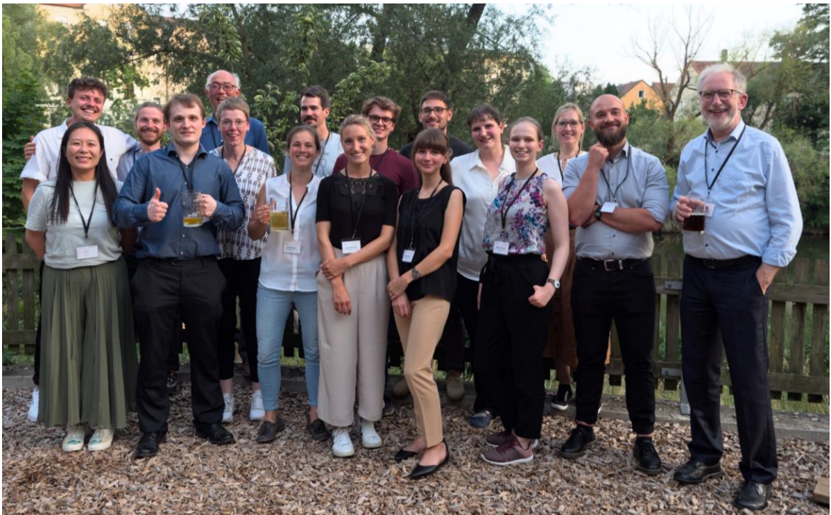
圖 5. Hinrich Abken 實驗室同仁合照

我在加入 Hinrich Abken 教授的研究團隊之後，一開始有個博士後研究員帶領我熟悉實驗室常進行的各項實驗，像是如何 subcloning，產製病毒，並將 CAR 基因轉導(transduction)至 T 細胞中，以及各種 CAR T 細胞的功能檢測，比如說各種 T 細胞的分型、毒殺能力、分泌 cytokine、分裂能力等。研究團隊的 lab meeting 固定在星期二上午舉行，因為德文中的星期二為 Dienstag，所以我們都稱 lab meeting 為 D-Day. Lab meeting 主要會由各研究成員報告目前的研究進度，並由大家發問或提供意見。除了大家一起的 lab meeting，教授也會挪出半小時到一小時時間和個人進行較深入的討論，主要會著重在研究方向和實驗上的細節等等。由於團隊中有來自英國、中國、還有我這個來自台灣的非德國成員，因此各種會議皆是以英文為官方語言。我一開始在這些會議上要用英文向大家報告的確十分緊張，但透過這些會議和討論，讓我慢慢熟悉每一個成員現在手上的研究計畫，也了解這些領域目前要回答的重點問題在哪裡。實驗室中所建立的實驗 SOP 和同儕所提供的寶貴經驗，都給了我莫大的幫助。