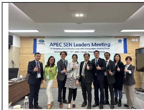
圖 12 會議現場留影