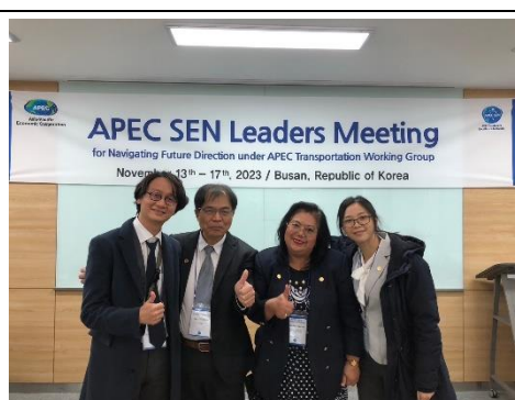
圖 3 會議現場留影