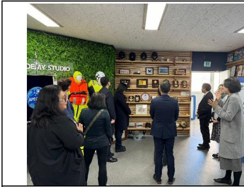
圖16 參觀APEC SEN秘書處辦公室