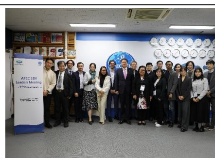
圖 15 會後院長致贈禮全體合影