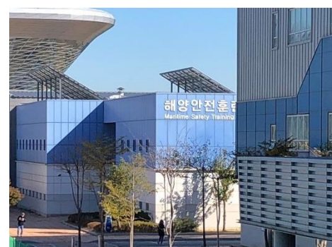
圖 5 會議地點KIMFT教學設施