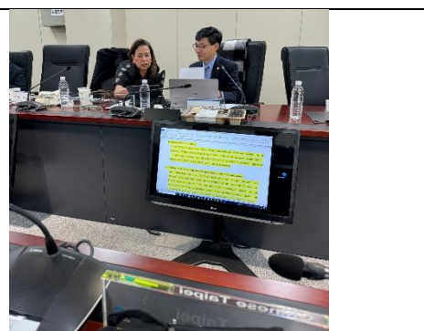
圖 11 討論ToR修正草案