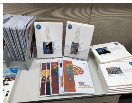
圖 7 會議現場擺放APEC SEN出版品