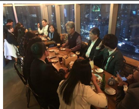
圖 13 晚宴