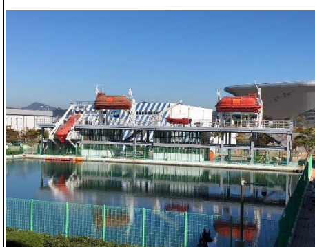
圖 4 會議地點KIMFT教學設施