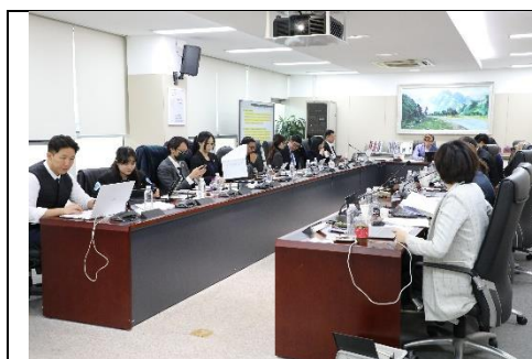
圖 14 會議現場總結討論

有關後續有意角逐主席或副主席人員，經成員間討論後應須具備APEC SEN活動經歷。另有關組織章程文書審核流程將提供給各成員經濟體。